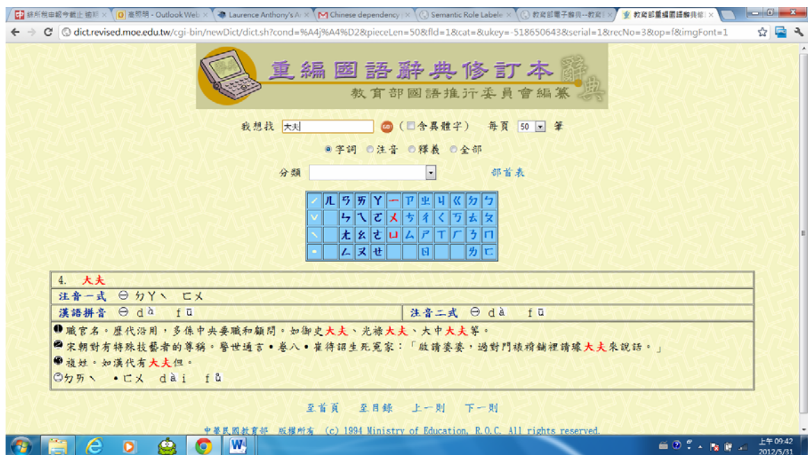
圖十一 教育部重編國語辭典修訂本檢索結果