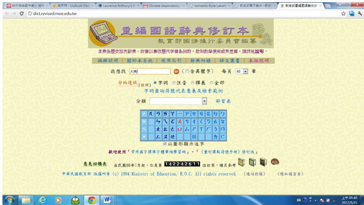
圖十 教育部重編國語辭典修訂本檢索介面