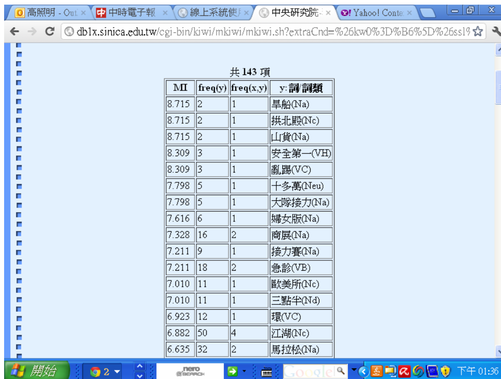
圖十七 現代漢語平衡語料庫進階檢索功能中的搭配語的檢索