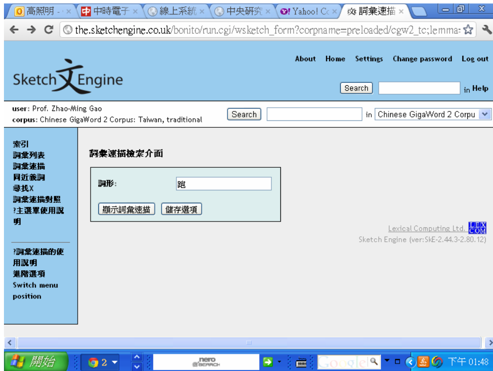
圖十八 Sketch Engine 詞彙速描介面