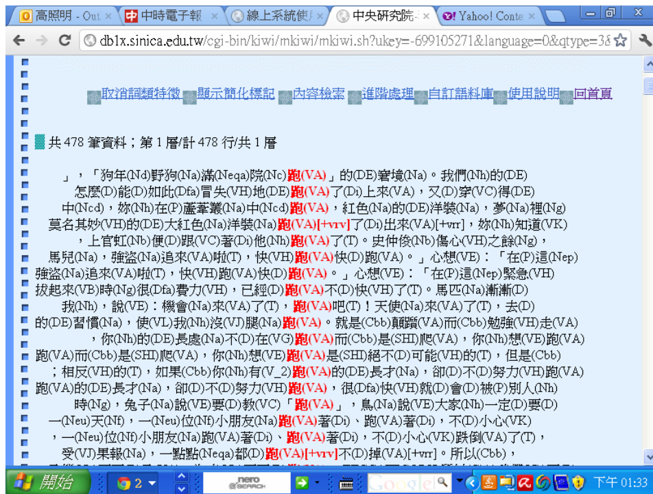
圖十五 現代漢語平衡語料庫檢索輸出結果(顯示詞性)