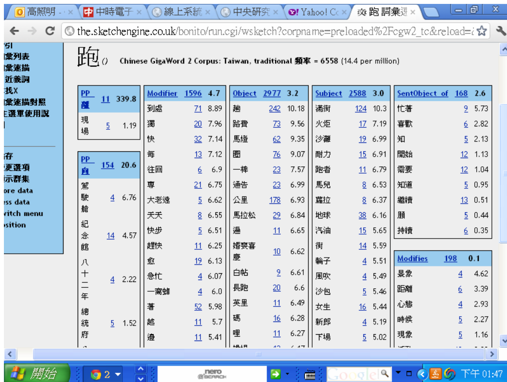
圖十九 Sketch Engine 詞彙速描輸出結果