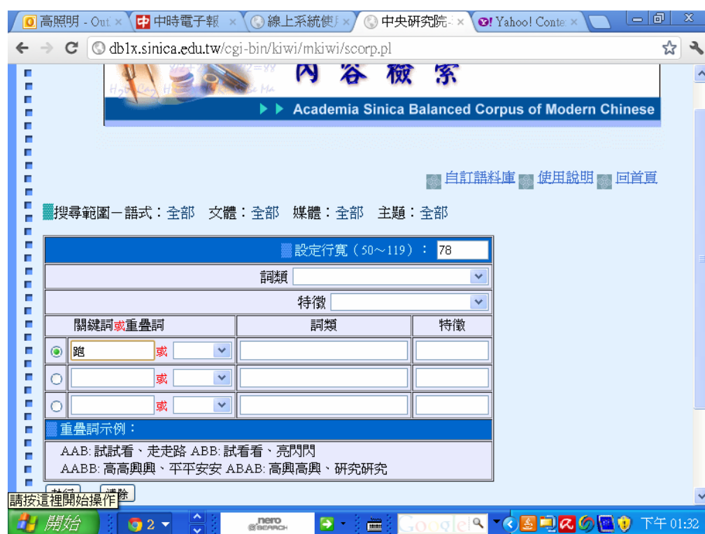
圖十三 現代漢語平衡語料庫的檢索介面

目前正體字的中文語料庫最具有代表性的兩個，分別是中研院詞詞知識庫小組的現代漢語平衡語料庫及 Sketch Engine。前者包含 1 千萬詞，後者則包含 4 億 5 千多萬詞，兩者除了語料的數量之外，最大的差別在於 Sketch Engine 從分詞到詞性標記到語法依存分析完全是程式自動處理，且沒有經過人工檢查，現代漢語平衡語料庫除了程式處理之外，則經過人工多次的檢查，正確率較高。至於檢索的方式，兩者都支援關鍵詞檢索，也可以搭配語詞性檢索，也都可以檢索關鍵詞左邊或右邊若干詞之內的搭配語。現代漢語平衡語料庫並支援各種重疊詞的檢索，以及依據文類來檢索。