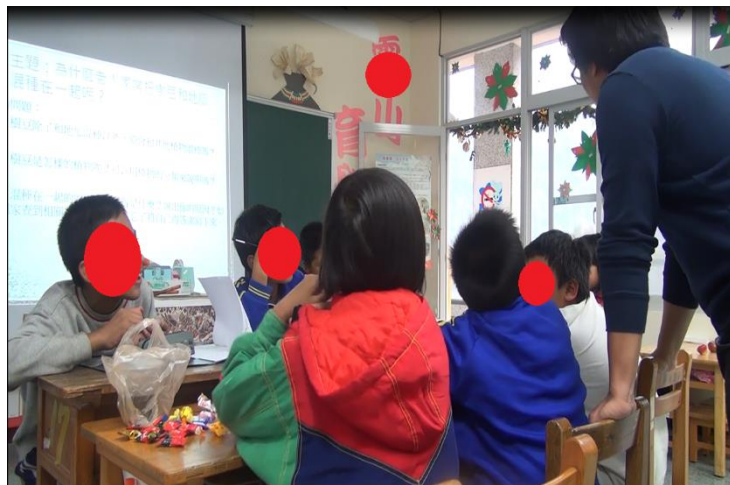
【圖 1 參加科學展覽競賽的孩子大多是非體育以及藝文專長的孩子】

筆者這幾年一直有機會代表學校參加地方縣市政府所舉辦的科展競賽，除了希望學生能徜徉於探究的教學環境下，拓展自己的觀察和探索能力，透過五官的運用，從生活情境當中找尋問題並解決問題外，還賦予了自己一項任務，那就是期望自己能透過科學