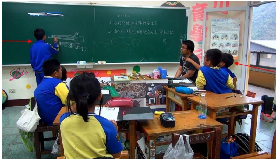
【圖 5 透過合作學習討論各自想像的可能答案】

足夠的時間，去組織自己要表達的內容。漸漸的，發現了孩子口語表達以及組織能力的提升。