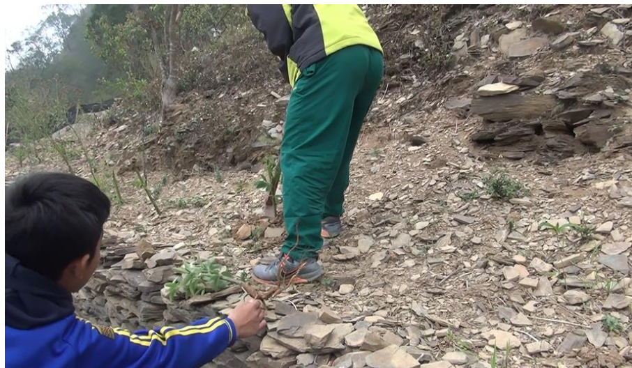
【圖 4 實地進行樹豆的挖掘以及外觀的觀察，開發學生觀察的能力】

參加科學展覽競賽是需要花費相當多的心力，將自身文化以及生活背景做為探究主題的來源，更需要其他人的協助，但是，真實的經歷探究的過程後，發現了學生和老師的改變：