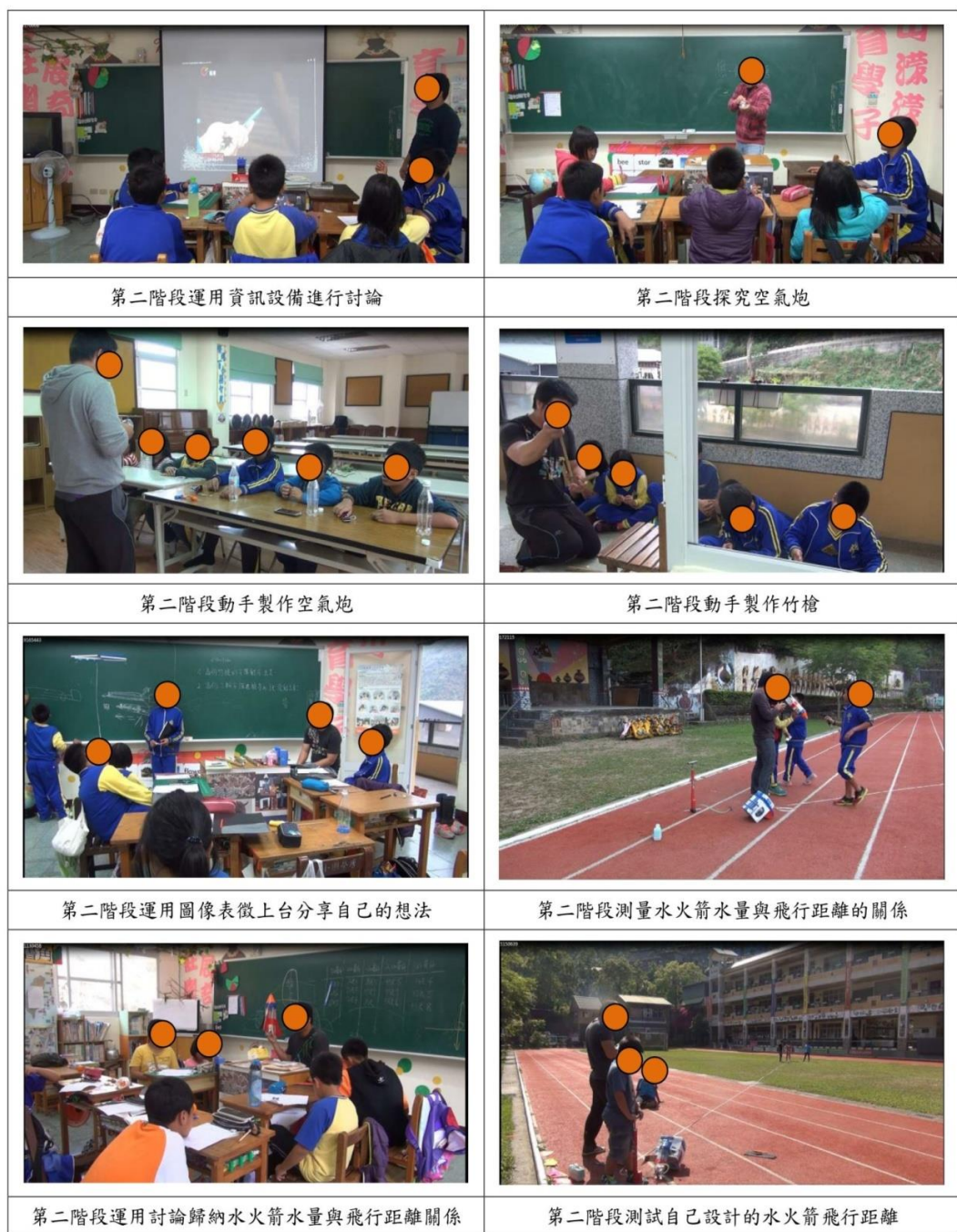
【圖 2 透過科學展覽競賽真實的進行科學探究教學】