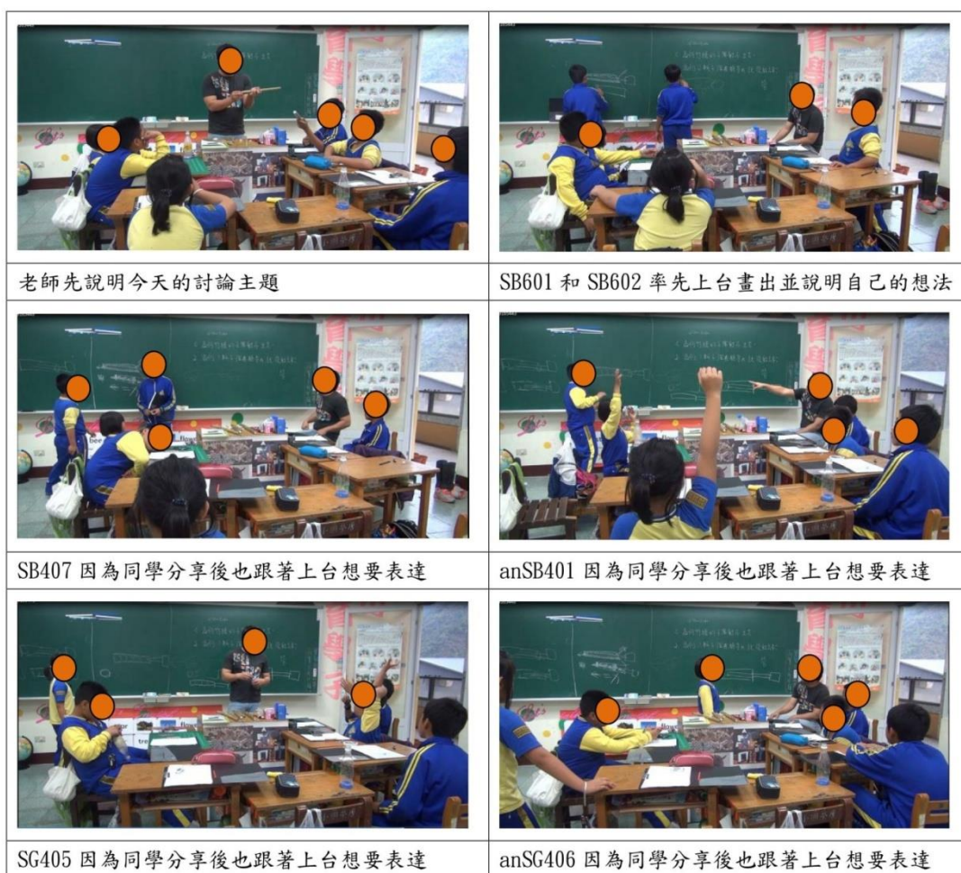
【圖 7 讓學習主導權回歸孩子，可提升學習動機，更願意分享想法】

該領域的大門。過去曾經進行錯誤的方式，以為「好玩」就能夠讓孩子主動學習，但在科展競賽的準備過程當中，發現將學習的主導權交還孩子，學習的內容和探究的主題都讓孩子決定，老師只要成為輔導者以及協助者即可，再也不用花心思去想孩子喜歡什麼、對什麼感興趣。