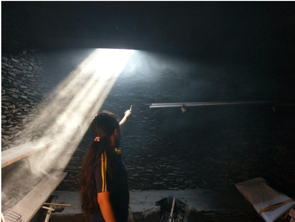
【圖 3 透過文化素材—石板屋內的科學來做為科學展覽的探究主題】

科學的本質在於「進步」，若能透過自身文化找尋科學因子，並將其運用於教學之中，藉此提升學生的學業表現，除了達到文化傳承的使命外，更能提升學生對於自己文化的認同，對自己的文化本質更具信心。懷著這樣的信念，便開始了「民族科學」的自我探索過程。