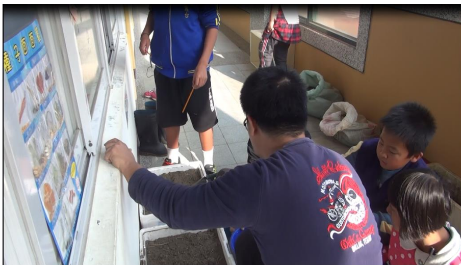
【圖 8 帶領科展讓孩子受惠，同時也讓老師成長：從杜威做中學的概念出發】

與其他教育夥伴聊到學校一般行政事務的時候，許多人都不喜歡學校每年必須要繳交一件科展的作品，這反映出學校科學教育背景的教師人數太少，也說明了帶領學生進行科展是一件辛苦的差事。但在這過程當中，教師的成長也是顯而易見的，最明顯的就是「提升了課程與現實生活連結運用的能力」。在 108 課綱即將施行的這段期間，我並覺得素養導向的教學以及課程有任何難度，因為，在帶領學生進行科展活動的時候，我已經在做素養導向的教學以及課程設計了。生活中所有一切的事物都能成為課室學習的主題，只要老師兼備課程與現實生活連結運用的能力即可。