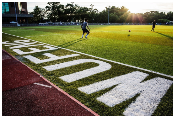
全國首面FIFA認證吳鳳科技大學人工草皮足球場

フリー百科事典『ウィキペディア（Wikipedia）』（2019）。人工芝。日本：YAHOO網站。引用網址： https://ja.wikipedia.org/wiki/%E4%B%A%BA%E5%B7%A5%E8%8A%9D