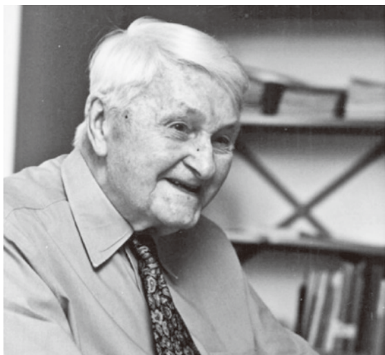
九十多歲時的李約瑟

但姑且不論次序問題，這樣組織材料有兩個主要問題。第一個問題李約瑟本人也很清楚：中國古人對其所從事的學科或學科間界線的概念，與我們的概念不盡相同（在某些例子中，甚至連接近也談不上）。我們也許不