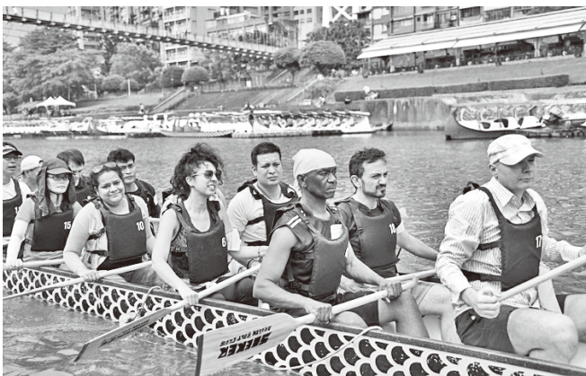
外籍訪問學人端午活動於新店碧潭合影及划龍舟體驗