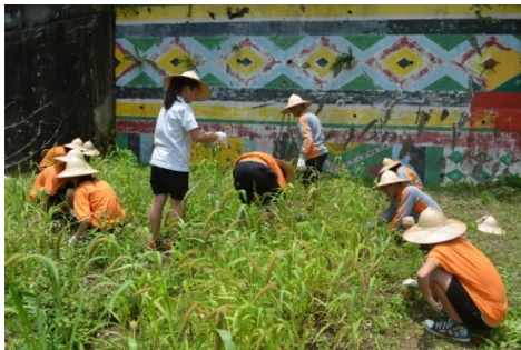
圖5. 七年級農耕課程-小米園區除草