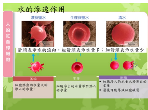
圖10.泰雅醃肉的生物學原理-水的滲透作用、擴散作用