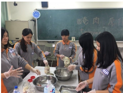
圖9.九年級飲食課程-女生醃肉實作