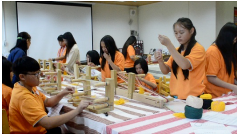
圖7.八年級編織課程-女生織布實作