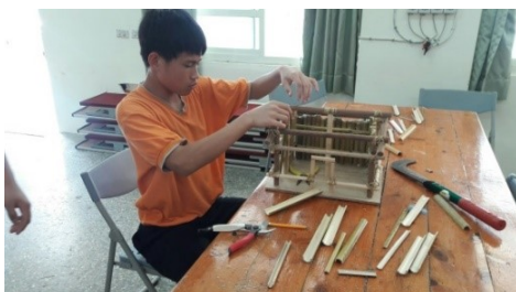
圖6.八年級編織課程-男生竹屋模型製作