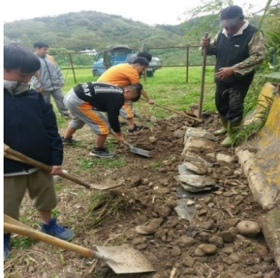
圖4.七年級農耕課程-砌石