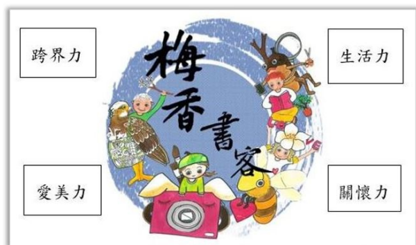
圖 1.新成國小學生圖像