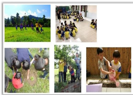
圖 2.新成國小家族混齡之照片紀錄

家族制度目前已經進入第三年，也正好搭上12年國教校訂課程的列車，新成教學團隊的師長們準備將家族系統納入正式的彈性學習課程中，學校就是像是大家庭，孩子們在家族中，找到歸屬、找到彼此照應的溫暖。