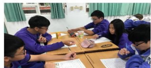
流程四：學生以小組進行海洋職業升學與就業配對學習單之討論與回顧。