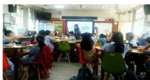
國小職涯融入生涯教育 水產養殖產業之大富翁遊戲體驗