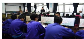
流程一：學生觀賞海洋職業探索宣導影片，了解海洋職業內容。

學生了解產業的多樣性及發展趨勢（整體教學實施情形如圖2）。以海洋職涯試探與發展為主題的課程設計，著實讓教師可藉此改善在教學現場上以陸看海的政策觀，以及海洋場所活動體驗不足之困境，透過Kahoot！活潑互動的教學有助於師生在海洋產業職涯之認識，培養深厚的海洋通識素養（教學包課程資源連結，請至 http://tmec.ntou.edu.tw/p/405-1016-38051.c6264.php?Lang=zh-tw ）。