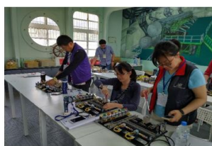
海洋職業生涯試探與發展-種子教師培訓研習之柴油引擎發電配線實作

為此，邀請各縣市薦派優質教師進行種子培訓，讓現場教師了解海洋教育政策之沿革，透過既有教學素材的指導促進教師的相關知能，並實際體驗海洋職涯試探教學策略應用擴散效應。此外，亦提供全國各縣市申請學生職涯宣導、家長親職教育與教師增能的巡迴服務，同時邀請資深種子擔任指導團隊進行觀課、議課與評課，發揮協同教學的集體智慧，共同精進教學策略，讓學生、家長與教師對海洋產業與職場有更為正向的認識，提升未來投身於海洋產業的可能性（實際培訓與巡迴情形如圖4）。