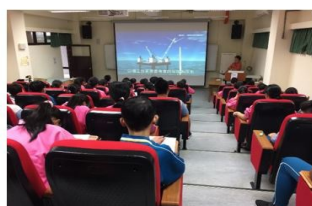
海洋職業生涯試探與發展宣導講座巡迴服務-國中場海運職人講座分享