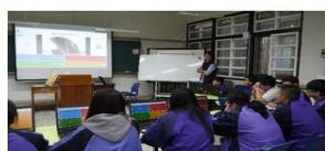
流程二：學生進行海洋職涯試探Kahoot! 答題回饋。