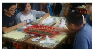
國小職涯融入生涯教育 海岸工程產業之消波塊實作

在國小階段是以「生涯認知」為主，進行自我與生涯察覺，帶領學生認識自己的長處，探索不同類型的工作內容，了解自己與工作世界的關聯性，其課程具備活動性與豐富性的特質，以因應新世紀時代的生涯教育之需要（教育部，1998）。「國小海洋職涯融入生涯教育教學示例」是先讓學生依據個人的興趣與專長進行海洋職涯類別的分組，並以小組討論擴大對各職業的思考，再者以體驗與實作的活動設計，引導學生探索職業的工作內容，如以「養殖大富翁」體驗水產養殖所需面臨的天災損失與技術得利職場現實、或者以「消波塊DIY」了解對於海岸工程對環境維護的重要性，藉由個人興趣、專長與海洋職涯對應，協助學生面對未來職涯選擇時的決定權（國小教學實施情形如圖3）。