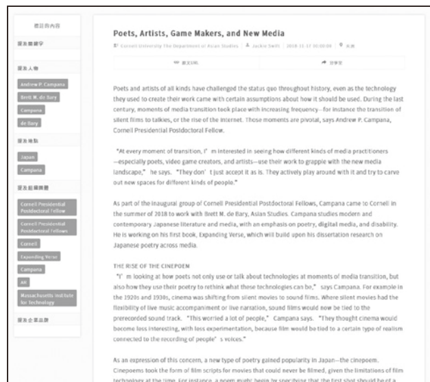
圖 2 點選文章列表後呈現之詳細內頁