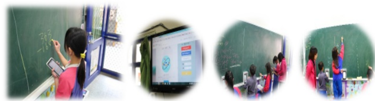
圖6.「均一教育平臺」教學實況

□老師透過平臺，掌握個別學生作答與學習情形，用以修正或調整教學的步調與內容，提供適性適切的教學。