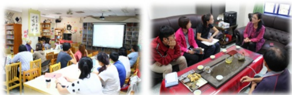
圖9. 教師團隊深度對話、交流、分享

本校為第一年參與數位學習計畫，之前也尚未執行行動載具的相關計畫，因此，在載具融入教學中，安排教師的成長活動，鼓勵在教學中運用行動載具學習進行創新教學，在不斷檢討與修正下，教師課程規劃與教學策略滾動式修正，以激發學生學習的興趣與動機。