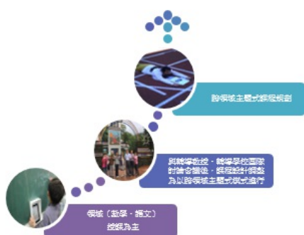
圖5. 數位學習教學活動規劃轉變歷程