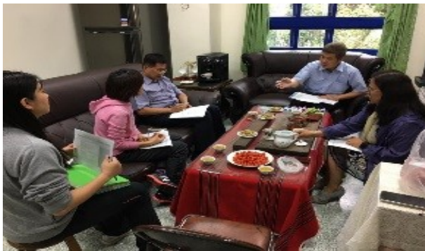
圖3. 教師團隊深度對話、交流、分享