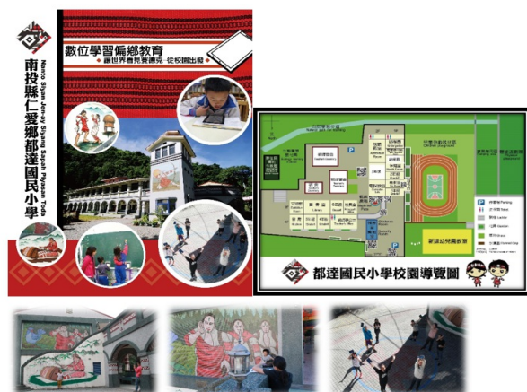
圖8.「校園導覽」指導學生拍照~教學實況

6、賽德克族數位文化學習網： http://163.22.102.129/dyna/webs/index.php?account=pgps06