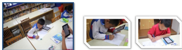
圖7. 運用平板在「均一教育平臺」教學實況