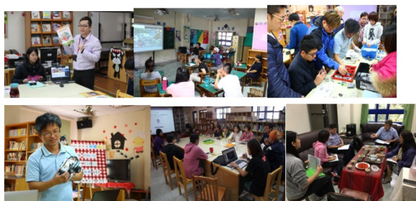
圖10. 教師數位教學進修

為增進數位學習團隊的視野及豐富專業知能，鼓勵派員參與各項數位相關教學活動與研習，也邀請專家學者講座與蒞臨進行資訊知能精進研習活動，透過實際操作，讓教師更容易應用在創新教學中。