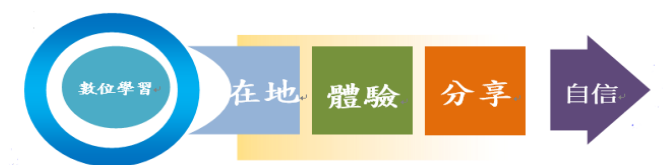
圖1. 從校園、在地出發，在體驗（操作）中有意義的學習，重視情感的交流、對話交流，進而建立學生學習自信心。

(四) 計畫特色：從校園、在地出發，在體驗（操作）中有意義的學習，重視情感的交流、對話交流，進而建立學生學習自信心。