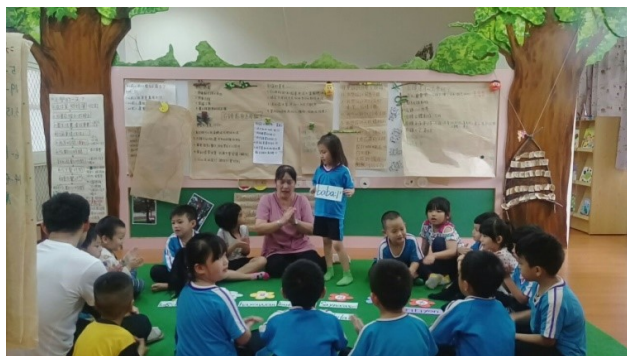
圖10. 幼兒園推動沉浸式族語幼兒園

本著學習資源共享與大完滿經驗，相關資源得以共享，構築「享趣東河、優遊泰夏」的學習網絡，擴大學習圈，讓部落皆是我們的學習場域。行銷發揚原住民傳統智慧，提供他校學生深度了解瓦祿風情，體驗在地的獨特文化與自然資產。落實從生活中學習、做中學的教育理念，讓「知識走出書本、能力走進生活」的課程改革訴求。幼兒園辦理沉浸式族語幼兒園，從小扎根部落走讀。