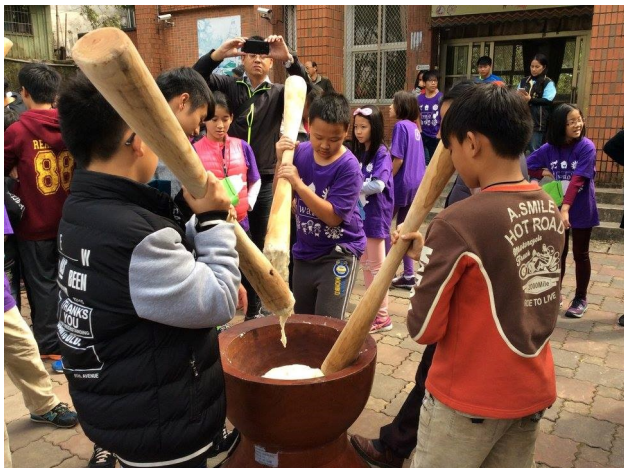
圖13. 體驗課程tinawbon (搗糯米糕)