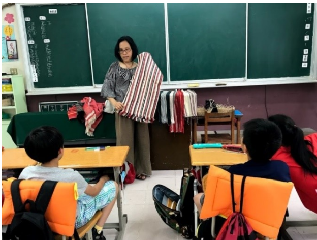
圖3. 認識編織服飾：民族美學