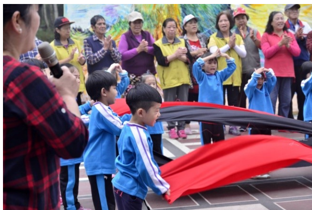
圖11. 部落長輩是學習族語文化最好資源