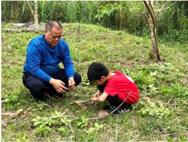
圖2. 製作陷阱：學習力學

野炊就地取材，山林生活難不倒他。課程設計具多元化、精緻化、適性化，符合學生需求，學生學習意願高。