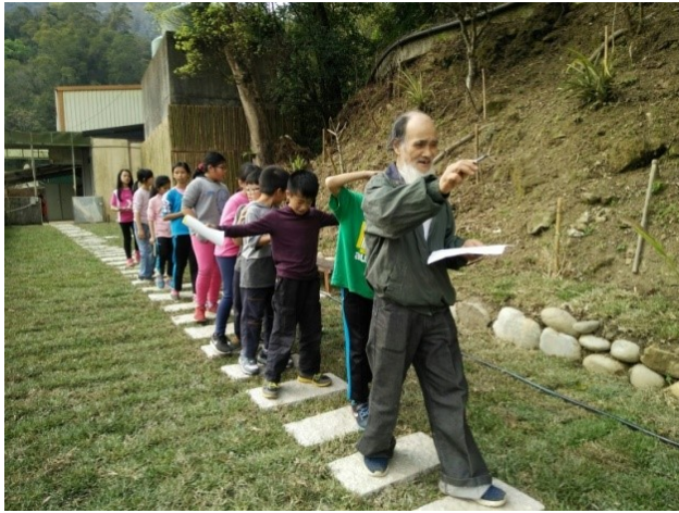
圖4. 耆老介紹植物：學習與大自然共處