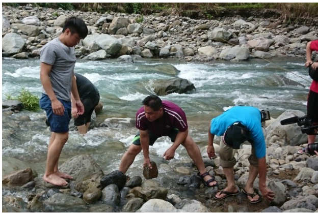
圖5. 部落青年回鄉服務協助課程：服務學習