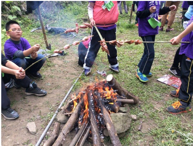
圖7. 大自然教室之無具野炊課程