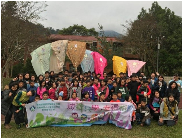
圖12. 城鄉交流體驗自製肩旗

藝術陶冶課程，製作矮靈祭傳統祭旗、臂鈴、裝飾品等，內容多元且貼近生活之實用性，增進原住民文化之認同與了解，達到傳承原住民文化之目的，且實施績效良好。這樣可以幫助學生認識自己家鄉的人文環境，使學生真實地感受自己與鄉土之間的密切關聯，激發對斯土斯民的熱愛。