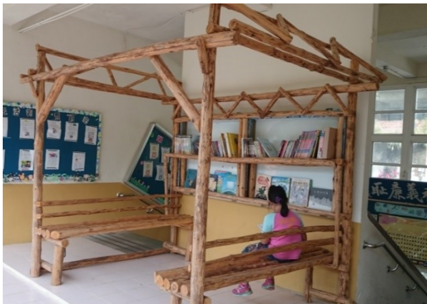
圖8. 賽夏風讀書角：營造具民族特色環境

學校空間活化，整合區域資源，建立富含民族情境之教學場域。在地化與生活情境脈絡化，賦予校園新生命，盤點現有資源，保留部落文化創作力，涵養學校創意，創造藍海新學園。持續創新教學，提升教師對學習的新思維，教育有無限的創意及巧思。