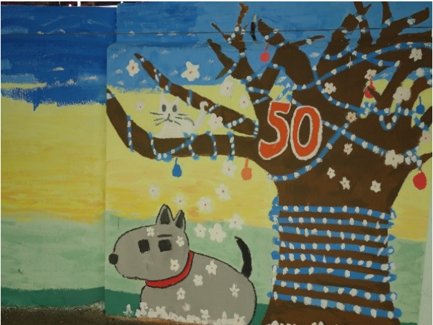
圖3. 學生校慶彩繪牆之二