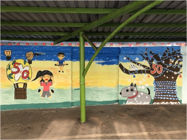
圖2. 學生校慶彩繪牆之一

「彩繪完成的隔天，學校內引起了一陣陣的讚嘆聲，就連我要選個停車位，都多花了幾秒的時間，只為了看看各班新奇的設計！」 1