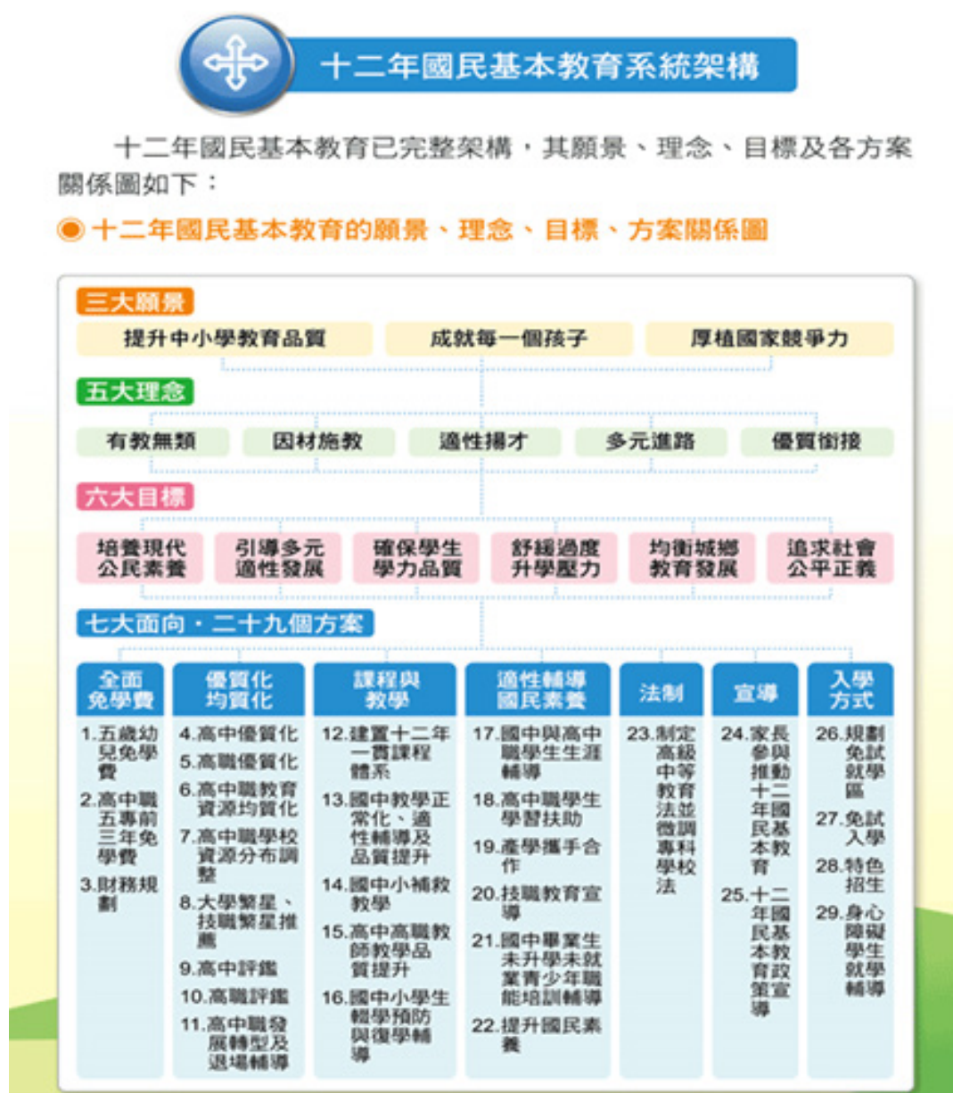
圖 2 十二年國民基本教育的願景、理念、目標、方案架構圖

待能夠達成 6 大教育目標，將重要工作分爲 7 大面向與 29 個方案，其中與本研究及師資培育政策直接相關之「課程與教學」面向，重要工作包括：（一）建置十二年一貫課程體系；（二）國中教學正常化、適性輔導及品質提升；（三）國中小補救教學；（四）高中高職教師教學品質提升；（五）國中小學生輟學預防與復學輔導（教育部，2015），其推動架構如圖 2。