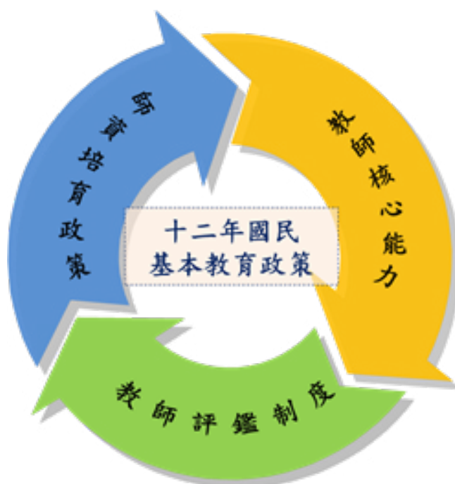
圖 1 研究架構圖

前述的教師評鑑相關指標研究有一共同特徵，就是研究成果所建構之指標與或機制，皆可用來評估教師外顯的能力與績效，而欲達成這些指標，教師所應具備的觀念態度與基本素養，可稱為教師的核心價值與核心能力，是一種內隱的指標，不易由外在觀察，教育領域以教師評鑑為主之相關研究，更需聚焦探討教師核心價值及核心能力。本研究之流程與架構以圖 1 表示。