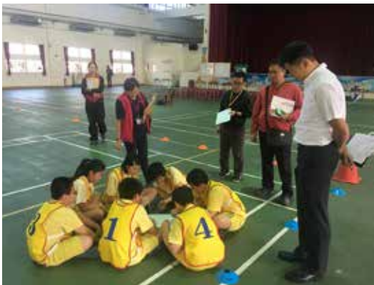
圖4 種子培訓Two：體育教學模組種子教師實際教學演練

習，課程為球類教學模組（低年級、中年級及高年級）、動作教育模組及教學方法。第二步驟於106年3月至5月，種子教師實際教學演練，並由教授進行觀課輔導，給予回饋。第三步驟於106年6月於國立臺灣師範大學舉辦反思工作坊，進行反思回饋暨分享。後續並預計於106年9月份舉辦體育教學模組種子教師授證典禮。