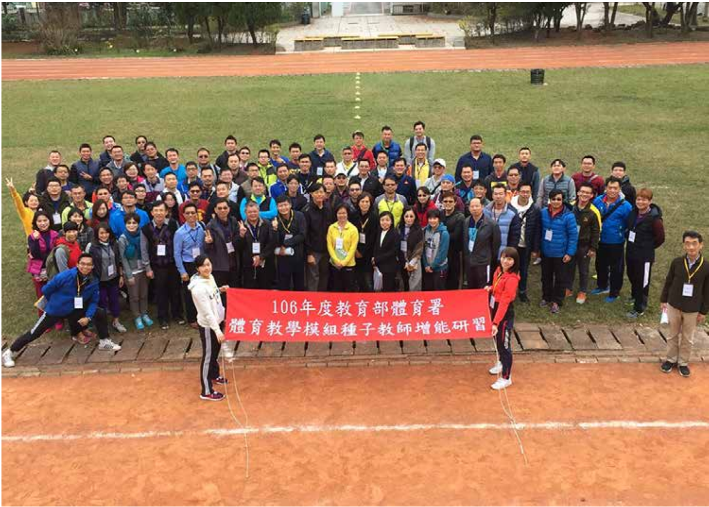
圖2 種子培訓One：體育教學模組種子教師增能研習

式，以期有效提升體育任課教師推動意願與學校行政之實際作為。為達成此目的，國小體育教學模組教師認證計畫將循序實施各縣市教學模組教師認證，逐步推動全國跨體育領域教師獲取體育教學模組能力認證之願景，落實精緻學校體育課程與教學，達成我國國小學童身心發展時期之學習效益。