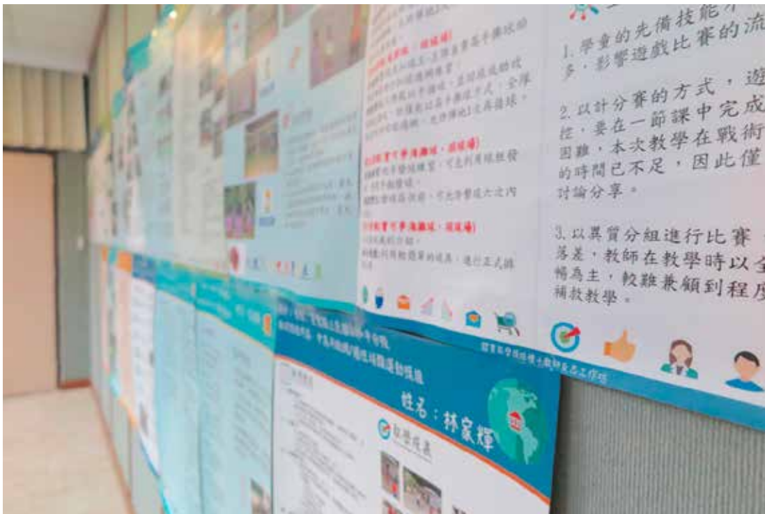
圖6 種子培訓Three：體育教學模組反思工作坊

106年度6月底開始啟動，由22縣市健體輔導團自辦研習，由各縣市獲得認證的種子教師擔任講師，縣市健體輔導團自行擇定教學模組內容，分別於暑假與開學期間辦理研習，跨體育領域教師參與一模組6小時的課程後，可取得研習時數，若再實際進行一節課的體育教學模組教學，並拍攝影片填寫回饋問卷，即可取得該教學模組的認證。預計認證1,000位模組教師，推動全