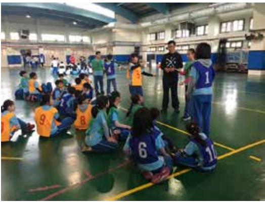
圖5 種子教師實際教學演練

種子教師從此過程中，皆認為此教學模組概念明確，其實際教學經驗共分成下列幾項：一、教學者容