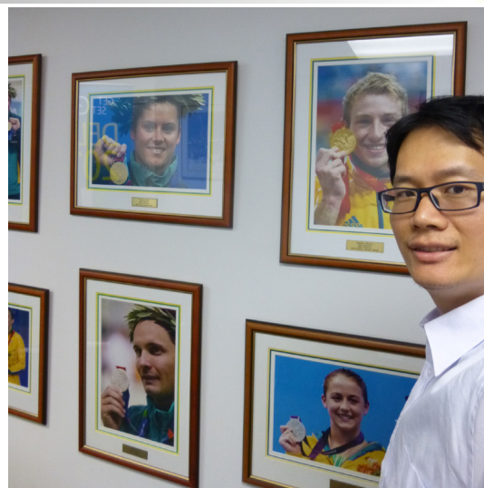
▲澳大利亞運動員培育績效卓著、如該國自 2000 年起連續五屆獲夏季奧運跳水獎牌共計 13 面 (2 金 3 銀 8 銅)、成效驚人（圖攝自於布里斯本國家水上運動訓練中心跳水運動名人牆 / 陶以哲提供）

優秀運動員輔導機制：1994 年起 AIS 創設運動員生涯規劃教育計畫 (Career and