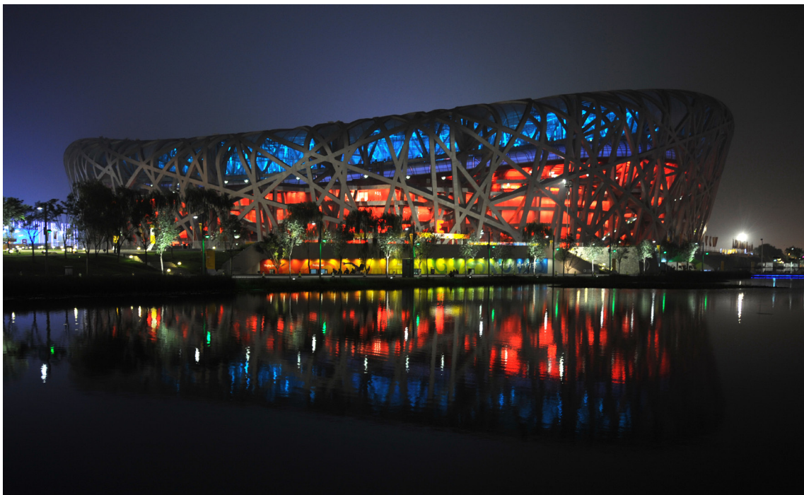
▲北京奧運以「綠色奧運」、「科技奧運」、「人文奧運」為目標，且藉由奧運做到人氣、財氣與和氣的聚集。