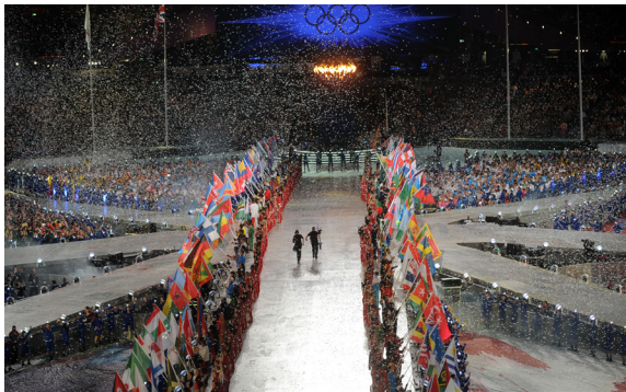
▲倫敦奧運主場館。

美國有線電視選出奧運會後的五大悲慘城市：雅典排名第一，其奧運成本約達 150 億美元超出預算。