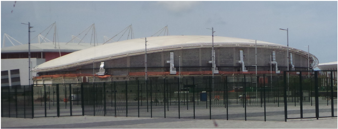
▲里約奧運自由車場館。

展區舉辦拳擊、桌球及羽球競賽，一個展區則供作選手暖身，以節省奧運場館興設之成本。