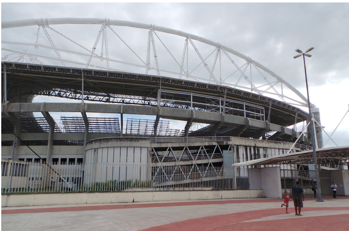
▲里約奧運田徑場。