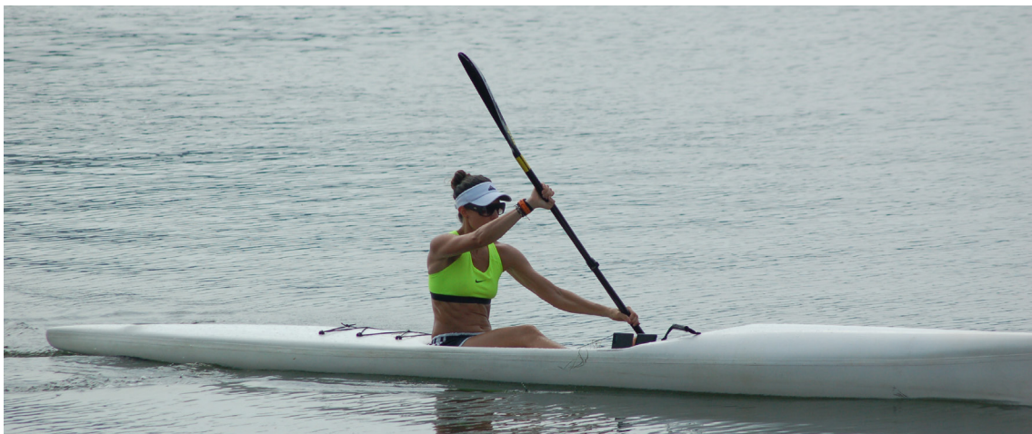
▲里約奧運划船場地。

亦可避免為賽會新設場館可能帶來的營運不善風險，與國際奧會近年來所提出之「2020奧運改革議題」之永續發展方向不謀而合。