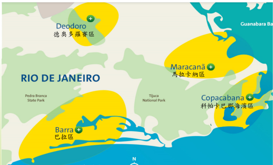
▲圖一 里約奧運主要競賽場館分佈圖

雖里約奧運足球競賽場館相距甚遠，將造成足球選手舟車勞頓，但在巴西經濟持續蕭條，貨幣貶值幅度持續飆升，年通貨膨脹率與失業率居高不下之情況下，利用鄰近區域之既有場館合作辦理賽事，不但可降低巴西政府財政負擔，還可整合區域資源，讓賽事受惠的對象由單一城市擴及至周邊地區，