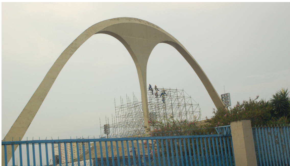
▲里約奧運射箭場大門以弓箭造型設計。

嚴重落後，曾讓國際奧會及世界各國膽顫心驚，但近來場館興整建進度突飛猛進，所有競賽場館應可在奧運會舉辦前如期完工，希望除了里約奧運的競賽場館準備能順利完成，成功辦完奧運會外，其場館在賽後營運方面，能真正永續營運，留下可傳承且影響深遠的遺產 (Legacy)。(本文作者為國立體育大學休閒產業經營學系助理教授)