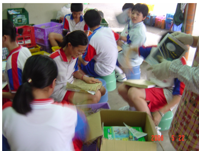
圖5學生合力進行資源整理