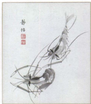
· 涂靜怡水墨小品〈蝦子〉