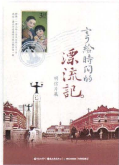
「寄給時間的漂流記」主題海報

由於明信片圖像主題多樣，如風景名勝、人物寫真、城鄉建築、重大災害、歷史事件紀念、動植物、藝術作品、風俗民情，展現近代社會庶民生活，具有高度價值。這些材料可以幫助我們瞭解過去，透過體驗時光之旅。因此，國家圖書館對於明信片的典藏甚為重視，現有館藏包括臺灣明信片 4,800 張，大陸明信片 8,800 張。其中臺灣之部分已刊載於「臺灣記憶」主題網站（ http://memory.ncl.edu.tw ），吸引不少讀者，深入研究。