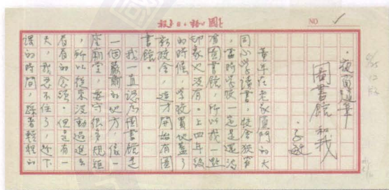
· 林良的手稿和插畫〈圖書館和我〉(圖片提供／國家圖書館)