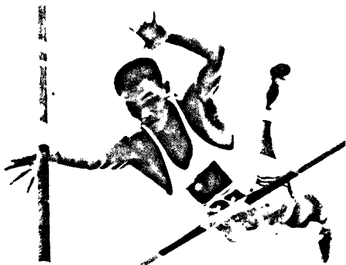
▲1960年亞洲鐵人楊傳廣在第17屆羅馬奧運會中，獲得奧運十項運動銀牌。

籃球、體操、射擊、舉重、拳擊、柔道、自由車。由於楊傳廣奪金有望，代表團達165人，是我國參加奧運人數最多紀錄。東京奧運聖火9月6日由日航專機運送至台北，中華全國體育協進會事前在台北綜合體育場前，特製仿古毛公鼎式之聖火台，並建一水泥台立碑撰文永誌紀念，奧運聖火由古奧林匹亞傳送至台北，由參加倫敦奧運中距離老將陳英郎，率領師大體育系學生組成接力隊，跑遍台北市各主要道路，最後由林竹茂點燃