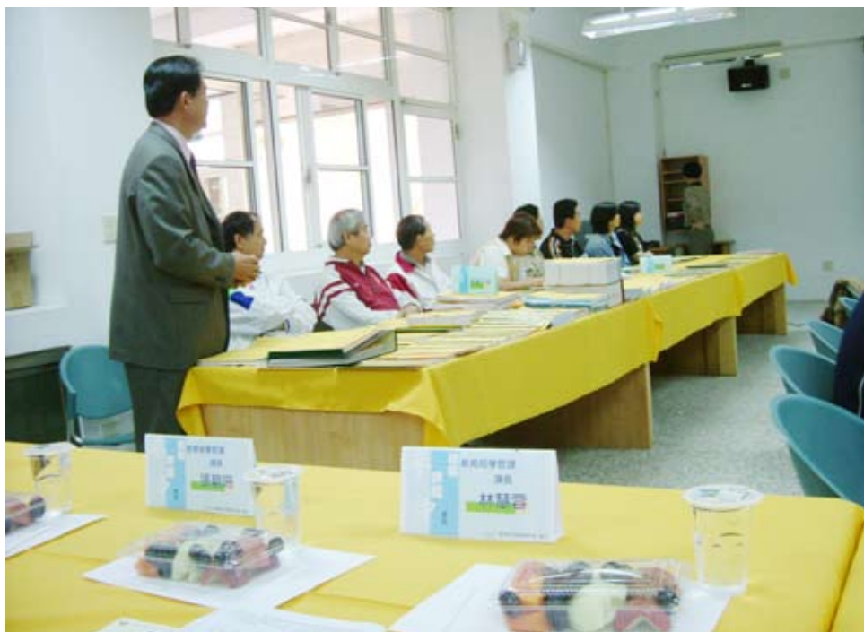
圖2 國民核心素養的評鑑之學校行政規劃