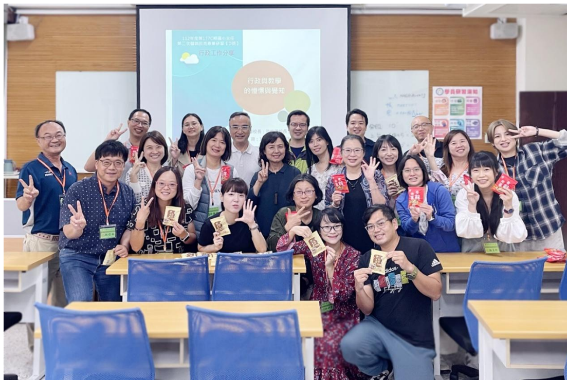
112 年度第 177C 期國小主任回流專業研習班學員合影