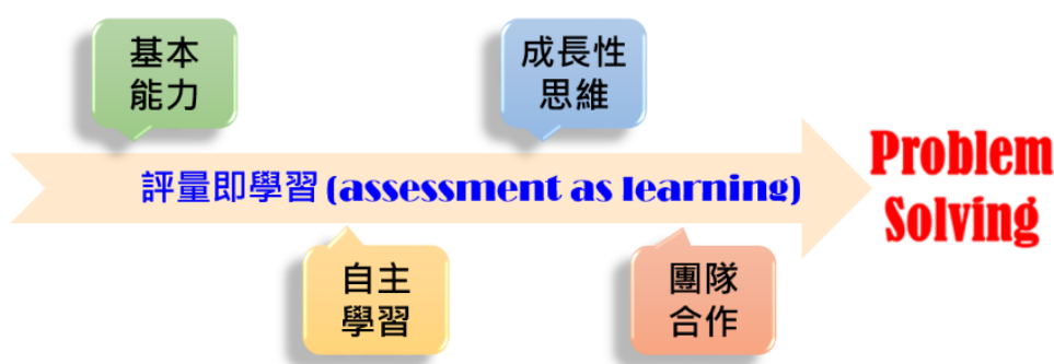
圖 1 本研究的問題解決課程內容規劃

解決為目標，評量即學習為工具，再輔以各式問題解決基本技能、自主學習能力、以及成長型思維與團隊合作等重要非認知能力組成，如圖 1 所示。在課程設計時，依課程內容進度適當的將這四項重要能力安排並結合到學生的學習之中，以提供學生重要的學習歷程與學習經驗，培養學生問題解決能力。