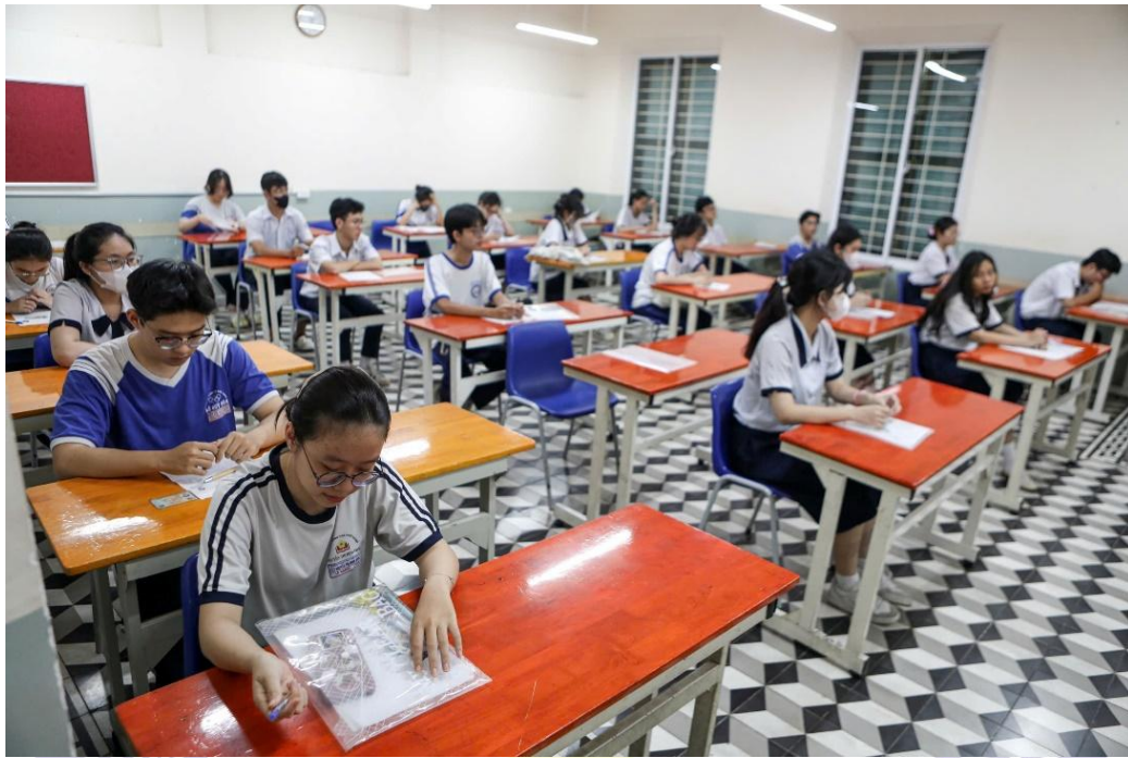
圖 5.參加 2025 年高中畢業考試的考生