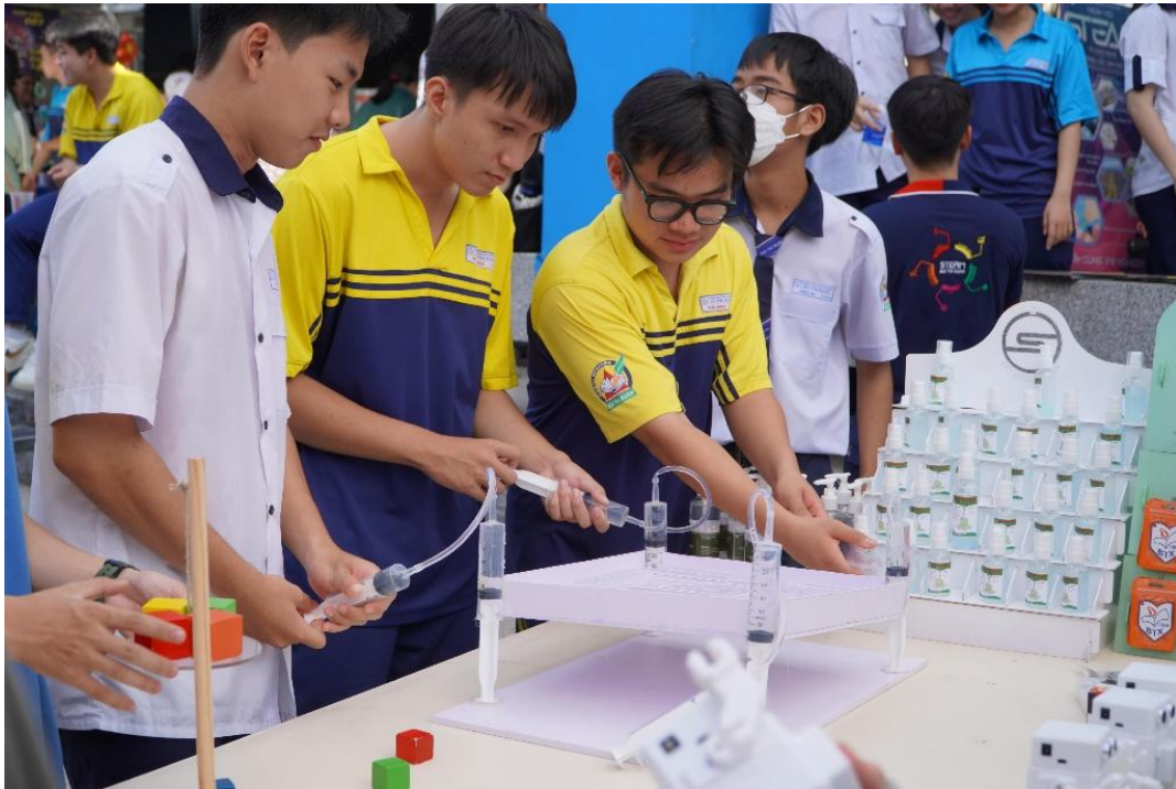
圖 4.胡志明市裴氏春高中的學生正在參加一場與 STEM 有關的實作體驗活動

若缺乏校方的投入與支持，教師的教學創新最終也將流於形式、淪為口號。一堂化學課只有黑板與粉筆，學生如何培養實驗思維？一節物理課若無測量儀器，學生又如何感受到科學的實踐性？