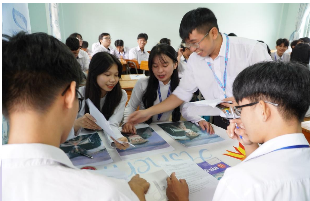
圖 3.胡志明市一所高中的教師，在語文課堂中依據 2018 年普通高中教育課程，引導學生進行創意學習與表達。

尤其在自然科學科，如考量實驗或實務操作題目，教師需創造可觀察、操作與模擬的學習情境，激發學生通過實務學習而非聽課筆記。