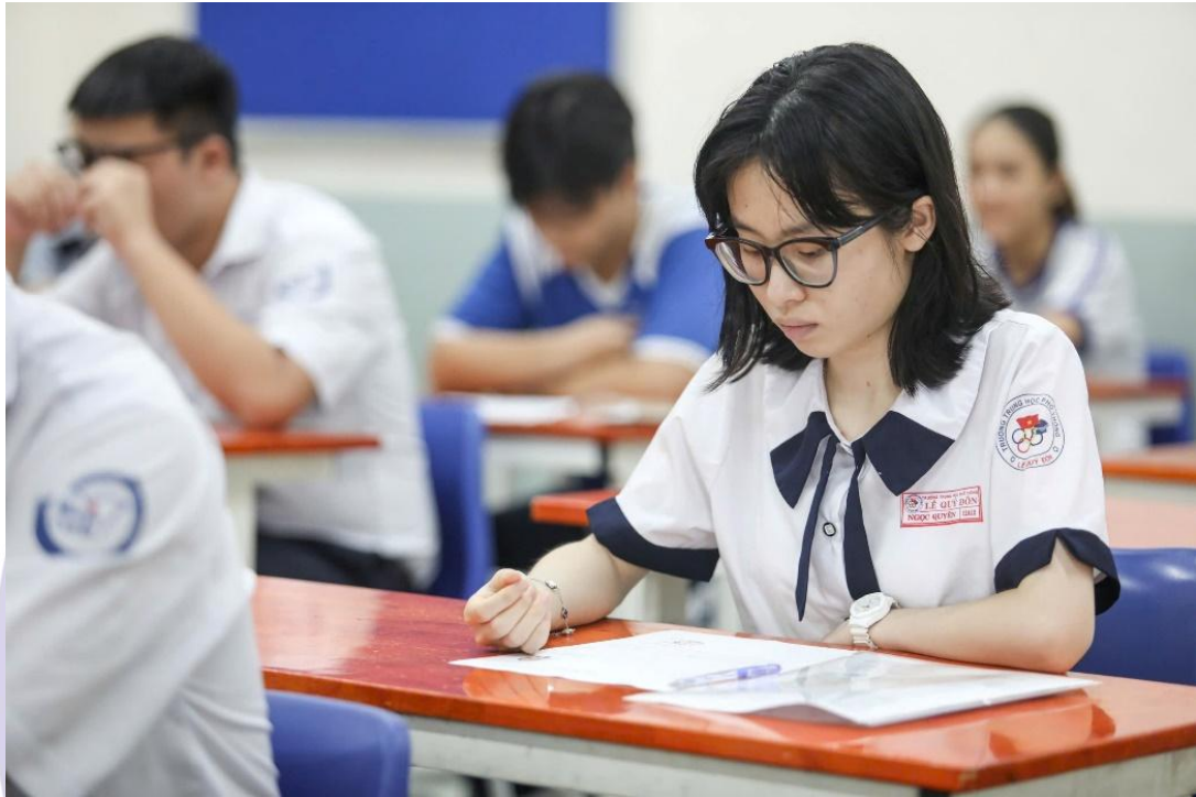
圖 2.高中畢業考試的命題，清楚體現出強烈的教育改革精神

成語常說：試題是一面反應教學與學習真實狀況的鏡子。若教法依舊、學習機制停滯，面對新式試題自然感到不適；唯有主動改變、自主學習、獨立思考，學生才能透過此試題展現自我能力。