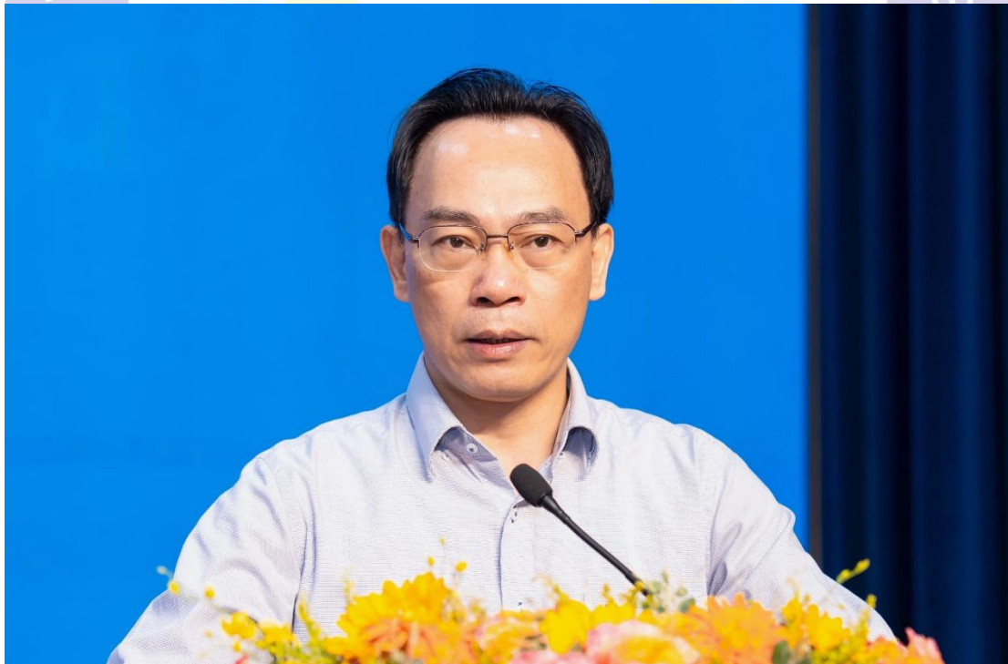
圖 1.教育與培訓部黃明山副部長於大學教育法修訂草案意見徵詢研討會。

胡志明市法律大學鄭國中研究生培訓處主任提問，過去已獲核准開設博士學位課程的學校，未來是否需要重新申請審核。該部黃明山副部長表示：「教育與培訓部的方針是將嚴格管理博士培訓。」