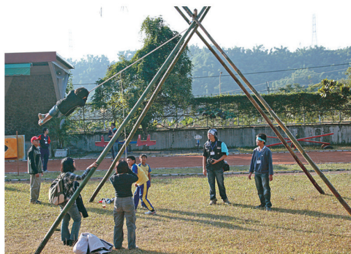
原住民盪鞦韆遊戲