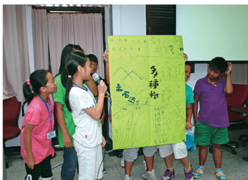
原住民小朋友了解大自然對環境的重要性

原住民族教育為國家教育重要內涵，我國「憲法」增修條文第 10 條第 11 項：「國家肯定多元文化，並積極維護發展原住民族語言及文化。」同條第 12 項：「國家應依民族意願，保障原住民族之地位及政治參與，並對其教育文化、交通水利、衛生醫療、經濟土地及社會福利事業，予以保障扶助並促其發展…。」「原住民族基本法」第 7 條：「政府應依原住民族意願，本多元、平等、尊重之精神，保障原住民族教育之權利；其相關事項，另以法律定之。」「原住民族教育法」第 1 條：「根據憲法增修條文第 10 條之規定，政府應依原住民之民族意願，保障原住民之民族教育權，以發展原住民之民族教育文化，特制定本法。」第 2 條：「原住民為原住民族教育之主體，政府應本於多元、平等、自主、尊重之精神，推展原住民族教育。原住民族教育應以維護民族尊嚴、延續民族命脈、增進民族福祉、促進族群共榮為目的。」原住民族教育事務，從教育政策、教育制度、施政計畫乃至配套規劃等均有法律保障與規範。