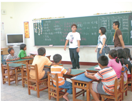
原住民族大專生至偏遠國小暑期輔導