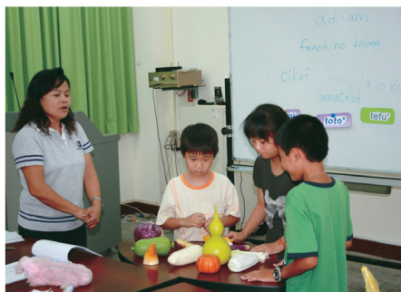
學習原住民族語