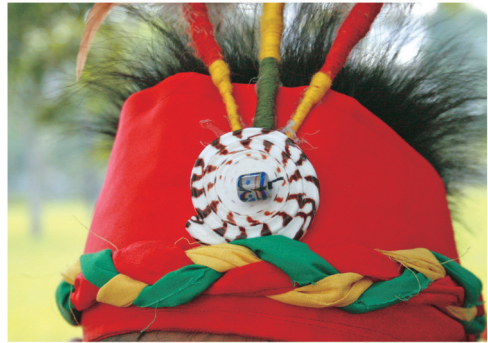
原住民族小朋友的頭飾

87 年政府頒布「原住民族教育法」，保障原住民族的教育權，各式專門為原住民族編寫的教材在短時間蓬勃發展。89 年教育部將本土語言（臺灣閩南語、客語、原住民族語）納入正式課程。92 年頒布「國民中小學九年一貫課程綱要」，其中選修課程類別提到「國小 1 年級至 6 年級學生，應就閩南語、客家語、原住民族語等 3 種本土語言任選 1 種修習，國中則依學生意願自由選擇修習。」自此本土語言已列入語文領域，並占「語文學習領域」之