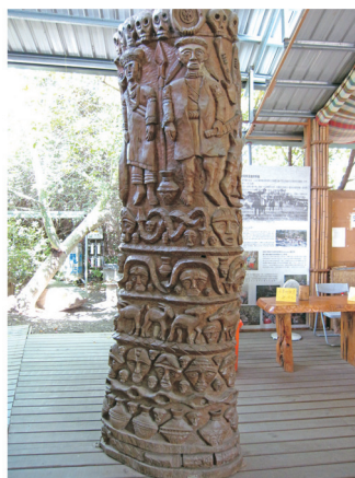
原住民族藝術雕刻

學校中的民族文化教育課程在開課時多以考慮能否聘請到講師、有無申請到補助計畫，或是學校發展的特色是什麼，所以，各年度所開之課程常有不連貫之情形，例如今今年學習舞蹈、明年學習編織，很難提供給學生完整且深入的民族文化。又各縣市原住民族部落大學各年度開設連貫性的課程也不多，例如開設文化課程中的美食課程或編織課程，最多只開設一學期，少數會開到二學期的課程。每一種知識或能力的習得，若欲達到精熟程度，勢必需經長時間的訓練，但細察學校或部落大學的民族教育課程之開設均缺少系統性的規劃，對民族文化的復振就不易落實。