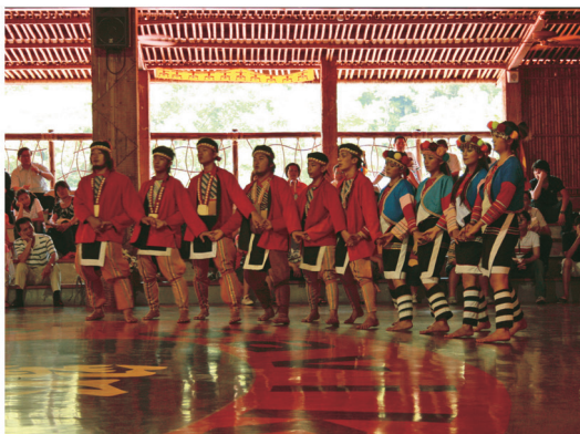
鄒族的歌