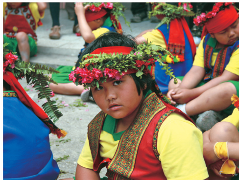
魯凱族小朋友