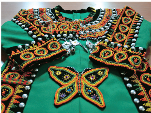
排灣族傳統服飾

展望未來，原住民族教育努力之方向，應繼續強化各族群的自我認同感，增進自我策劃與增能，促進族群實質公平機會，並平等對待族群之差異。促進多元族群間之互信與互助，尊重不同文化之內容。展現不同民族文化形態，並接納其他族群之特質，以實現共同合作創造美好國家形象，及增進族群競爭力之理想與願景。