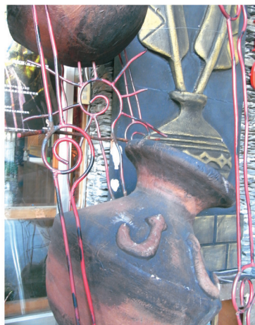
原味裝飾 (國立屏東教育大學原教中心提供)

100 學年度第 2 學期原住民族大專校院學生休學人數 1,970 人 ( 男生 966 人、女生 1,004 人 )，休學率為 8.87%；一般生休學人數 88,602 人 ( 男生 52,240 人、女生 36,362 人 )，休學率為 6.66%，原住民族學生休學率高於一般學生 2.21 個百分點 ( 表 14)。