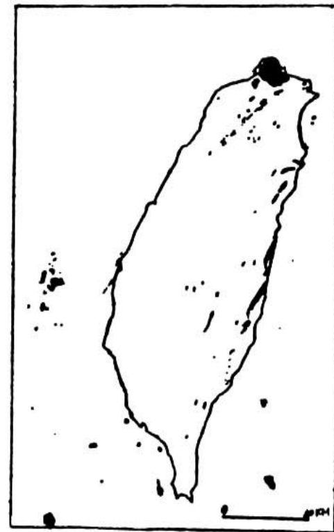
圖一：台灣省火成岩分佈圖

的小島嶼，除小硫球外都是由火成岩構成。其中只有澎湖列島為玄武岩，花嶼為斑岩外，其他的島嶼都是由安山岩組成。