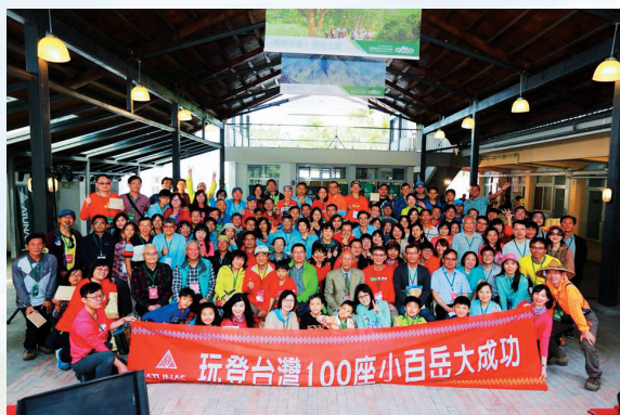
▲ 歐都納玩登台灣100座小百岳合影。

臺灣小百岳的由來是以「日本百低山」的郊山型百岳為概念，以親子同遊、親近山林和享受登山樂趣，促進身心健康等概念。由當時管理全國運動項目最高單位的公部門：前行政院體育委員會於民國92年廣邀全國岳界菁英代表，共同制定全國各縣市最具代表特色的一百座郊山（張賀融，2016）。前行政院體育委員會全民運動處處長謝季燕（2003）則指出入選「臺灣小百岳」的基本條件為：一、屬於郊山一日內可往返者；二、具有特殊景觀及地方特色；三、可及性高；四、山容量佳。