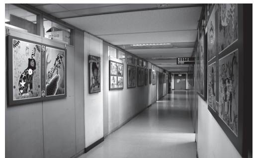
畢業美展市府布展