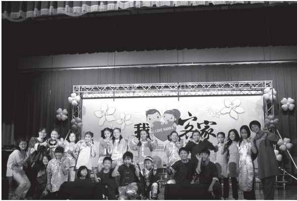
客家戲劇表演特優