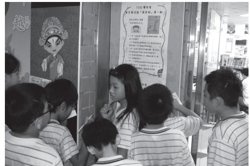
智多星信箱閱讀活動