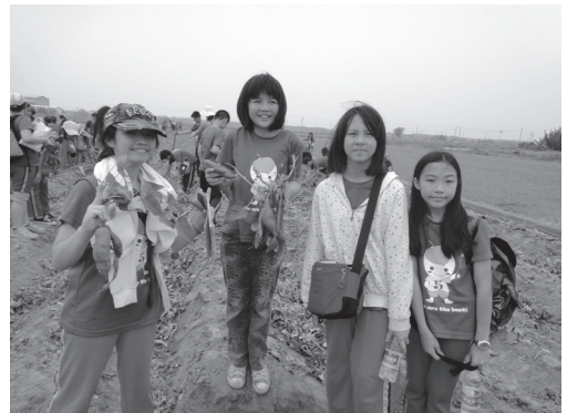
100 校際交流農村體驗

九年一貫課程實施前本校即爭取試辦學校，自行編撰適合學校本位課程之綜合活動課程，教師針對各項議題融入課程設計，皆能使學生學習得到全面照護，是屬學校本位課程特色。