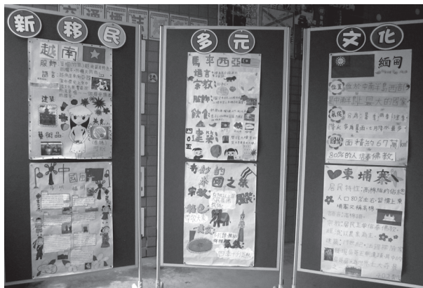
學生多元文化海報展