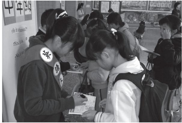
英語日學生認證情況