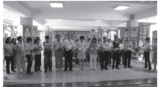
畢業美展作品校內展覽剪綵活動