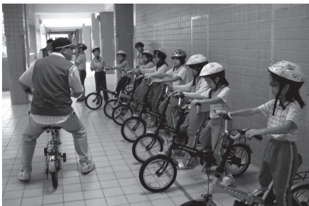
自行車騎乘體驗活動