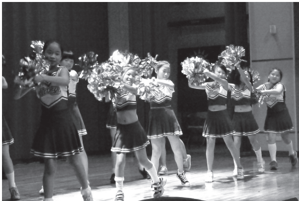
兒童舞蹈班參加社區秋節晚會表演

學校逐年建置畢業美術作品藝術牆的校園活化空間。除了融入生命教育的元素之外，也讓畢業生能與在地之環境得到認同與文化傳承，同時具有美化校園的優質精神，是屬修德獨特之人文本位課程特色。