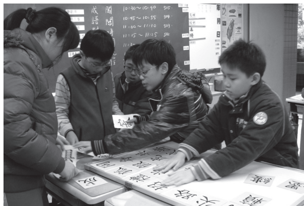
五年級語文闖關活動