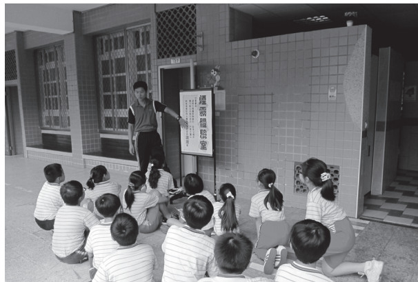
消防演練煙霧室體驗活動