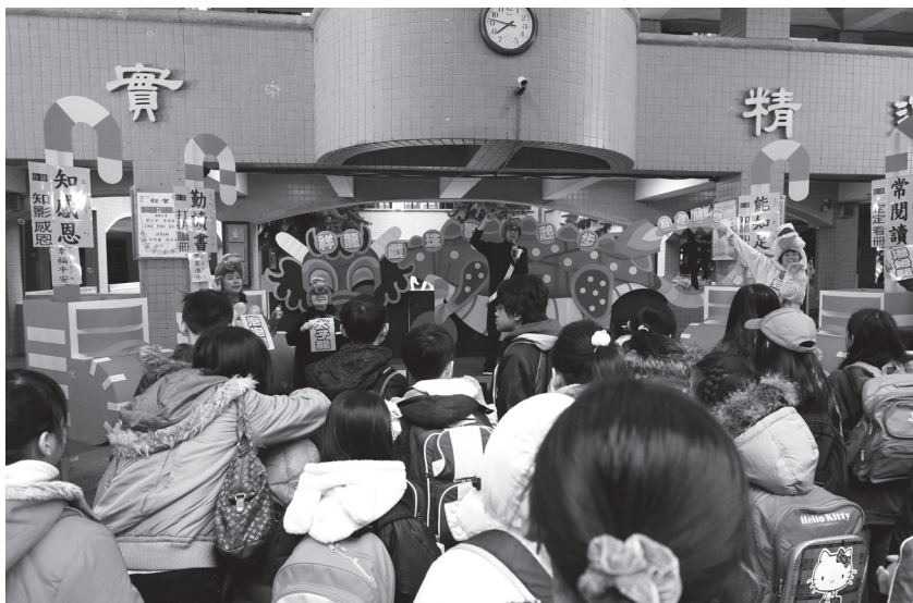
創意開學日主題活動