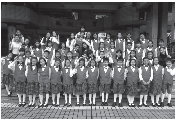
合唱團客語歌謠比賽東區第二名