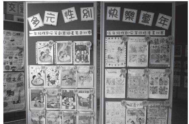
學生性別平等作品展