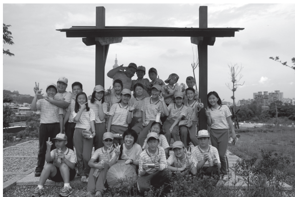
自然課程到後山埤公園教學活動