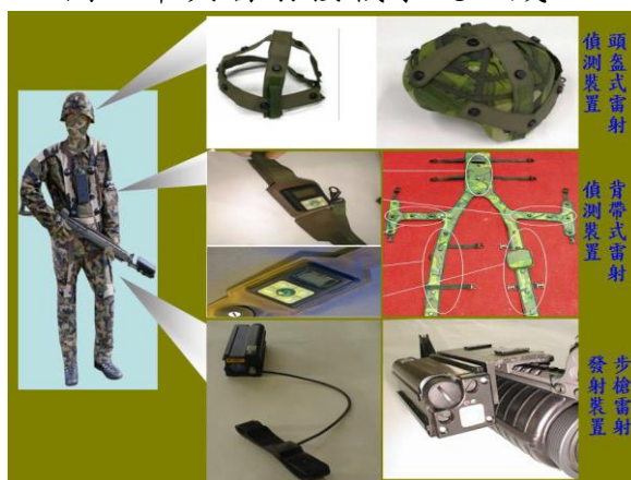
圖5 單兵雷射接戰系統組成。