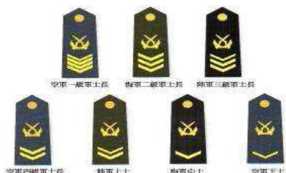
圖六：共軍09 式士官軍銜肩章

2009 年，中央軍委頒發「深化士官制度改革方案」，將士官軍銜由現行六個銜級調整為七個銜級，初級士官軍銜稱謂為下士、中士，中級為上士、四級軍士長，高級士官為三級軍士長、二級軍士長、一級軍士長（如圖六）。唯武警士官仍列六級：一至四級士官、上士、中士、下士等；至此，共軍所有軍銜制度拍版定案。