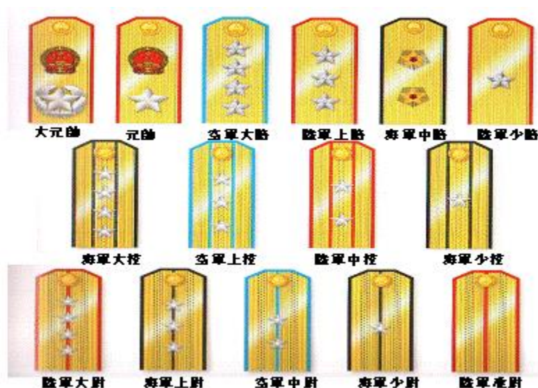
圖一：共軍55式軍官軍銜肩章