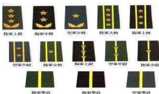
圖五：共軍07 式軍官軍銜肩章