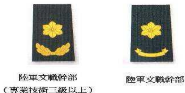
圖七：07 式文職幹部軍銜肩章