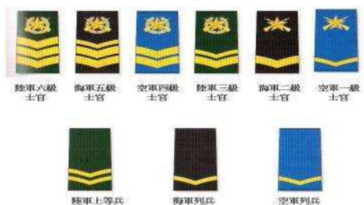
圖四：共軍1999年士兵軍銜肩章

根據兵役法，自1999年後，士兵軍銜等級和專業軍士、軍士長的稱謂自行取消。士官軍銜實行三等六級，即：士官軍銜分為高級士官(六級、五級士官)、中級士官(四級、三級士官)、初級士官(二級、一級士官)，如圖四。