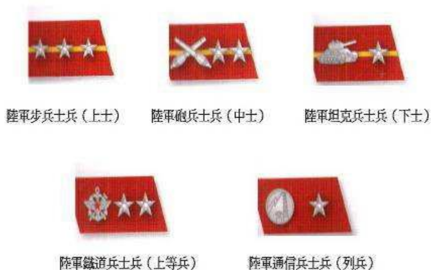
圖二：共軍55 式士兵軍銜領章