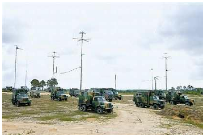
圖二 共軍電磁藍軍-複雜電磁環境設置

展現複雜電磁環境下雙方的激烈對抗，此次蘭州軍區某摩步師配發了機動衛星通信系統、北斗定位導航系統和其他電子干擾系統等新型指揮通信器材，並運用這些器材與瀋陽軍區某合同戰術訓練基地所組織的「藍軍」（如圖二）在戰場上展開電磁電抗，探索在複雜電磁環境下的電子對抗新戰法。