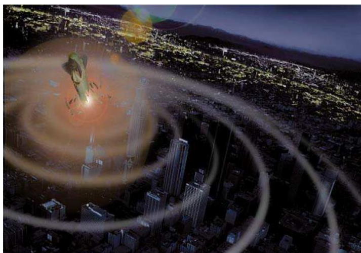
圖一 電磁脈衝炸彈E-Bomb