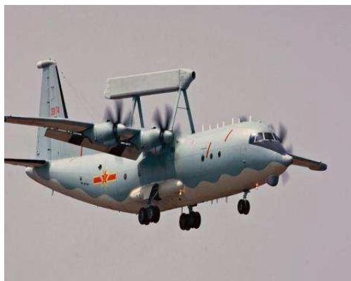
圖二 共軍運八遠干機