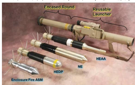
雷神公司商情簡報