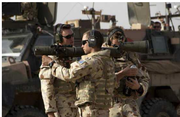
圖四:M3 火箭筒具備操作簡單之特性

龍騰網: http://www.wwgcc.com/luntan/viewthread.php?tid=64226