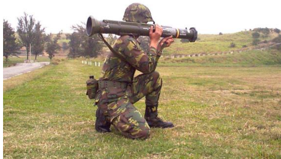
研究小組教學資料

傳統火箭彈為求能達無後座力效果，射擊時運用「作用反作用力」戴維斯原理，將相對的能量導引至後方。射擊時除會產生高音爆外，特徵顯著的筒後噴火極易暴露射擊位置與危害友軍。射擊陣地更無法選定狹小空間，