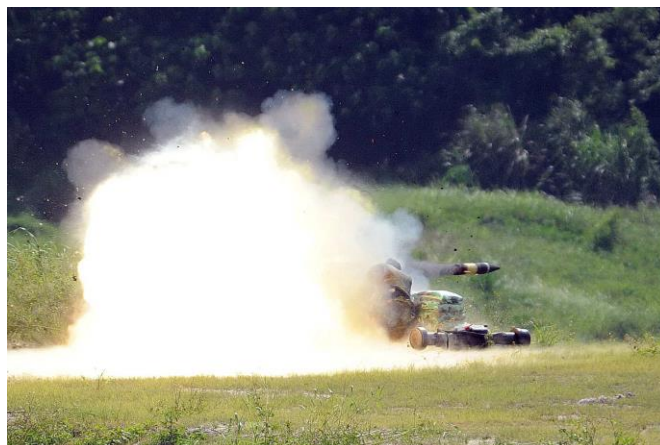
圖三: APILAS 火箭彈射擊產生之筒後噴火