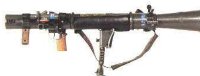
圖一：M2 卡爾古斯塔夫火箭筒

惟在筒面設計上加裝護板、肩托、握把及兩腳架等有效強化射擊穩定度。同時為確保操作人員安全，保險裝置設計除保險卡筭和壓板外，並增加擊發阻鐵保險。此一設計特性幾乎成為卡爾古斯塔夫的特色，即便延伸產品—AT-4 火箭彈，亦強調雙重保險的重要性。