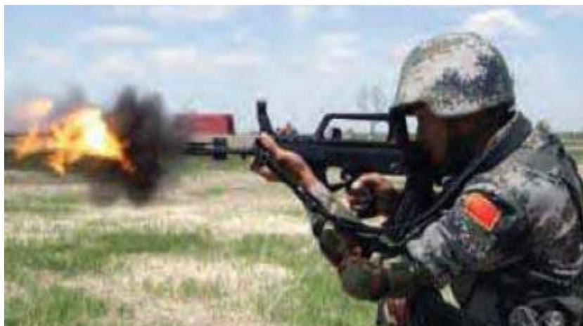
圖14：中共95 式自動步槍

( http://bbs.tiexue.net/post_4149343_1.html )