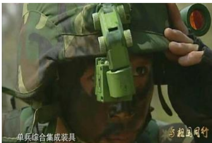
圖12：共軍複合式頭盔

( http://bbs.tiexue.net/post_3982682_1.html )