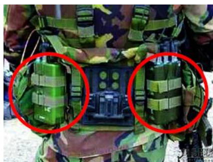
圖 3：設計於背部電池組件

( http://big5.xinhuanet.com/gate/big5/news.xinhuanet.com/mil/2004-03/03/content_1342982.html )