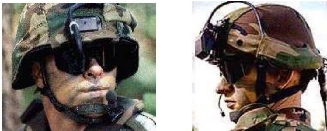
圖2：美陸軍整合式頭盔系統

( http://big5.xinhuanet.com/gate/big5/news.xinhuanet.com/mil/2007-06/21/6272436.html )