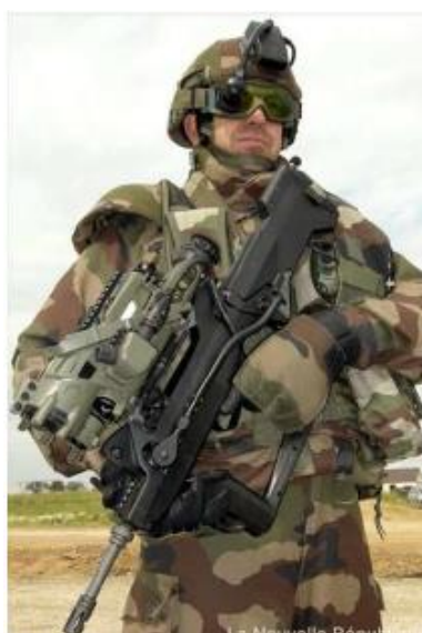
圖 8：法國未來步兵系統

( http://bbs.news.163.com/bbs/mi13/85429496.html )