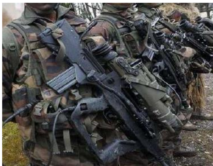
圖 10：法軍FAMAS 步槍

( http://bbs.news.163.com/bbs/mi13/85429496.html )