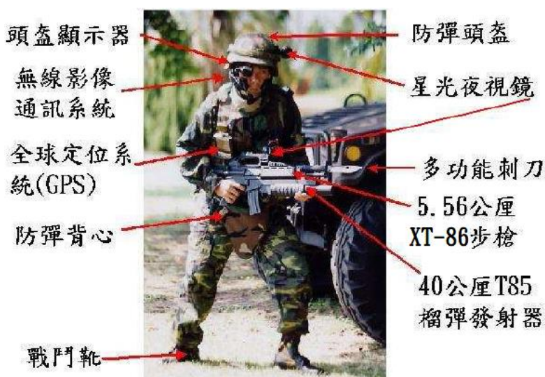
圖 15：本軍91 年公佈之未來戰士雛型

( http://mychannel.pchome.com.tw/channel/class_paper_open.html )