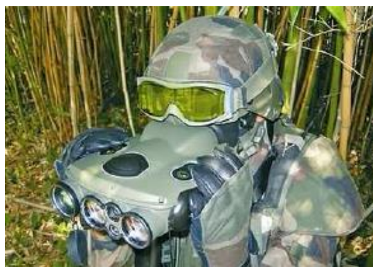
圖9：Sagem 中距離多功能雙眼望遠鏡

( http://chn.chinamil.com.cn/xwpdxw/wqzbxw/2011-04/04/content_4415984.htm )