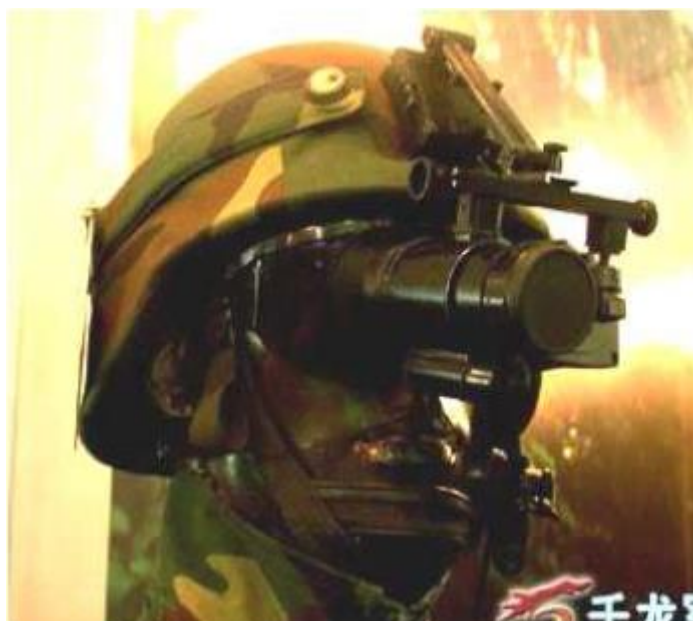
圖 13：LE 800 堅固型頭盔式顯示器

( http://zh.wikipedia.org/zh-tw/%E5%A4%PC%E8%A7%86%A7%E4% )