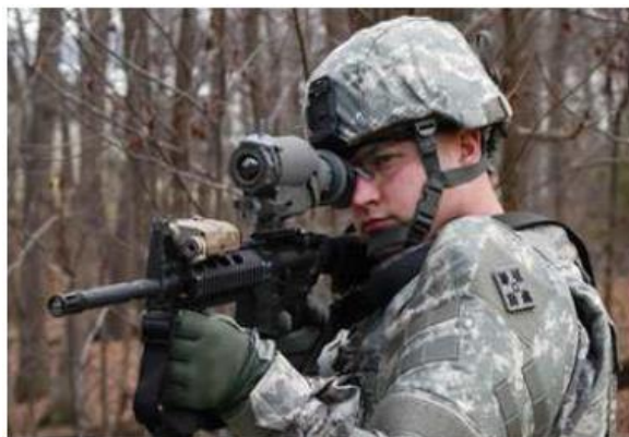
圖5：「陸上戰士」XM8 戰鬥步槍

( http://big5.xinhuanet.com/gate/big5/news.xinhuanet.com/mil/2007-06/21/6272436.html )