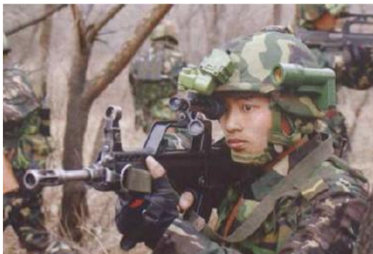
圖11：共軍數字化士兵

( http://bbs.news.163.com/bbs/mi13/85523696.html )