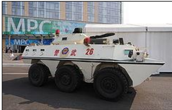
圖十 武警WJ03式裝甲防暴車