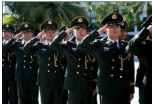
圖一 中共武警部隊官兵