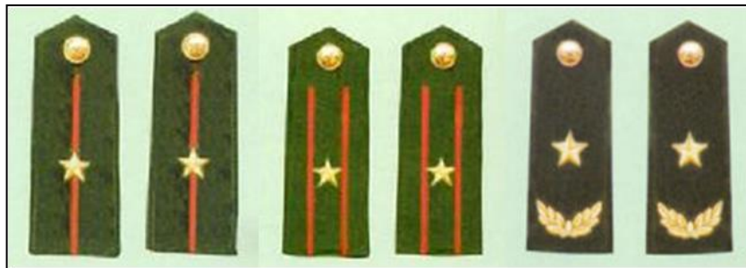
圖八 武警少尉、少校及少將階級(範例)