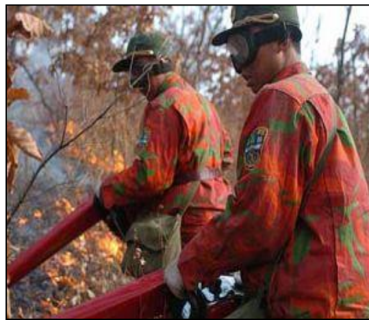
圖三 森林武警部隊