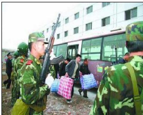
圖二 押解犯人中的內衛武警