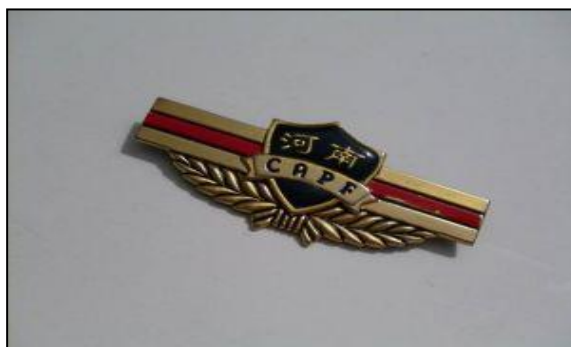
圖七 河南武警總隊胸章(範例)