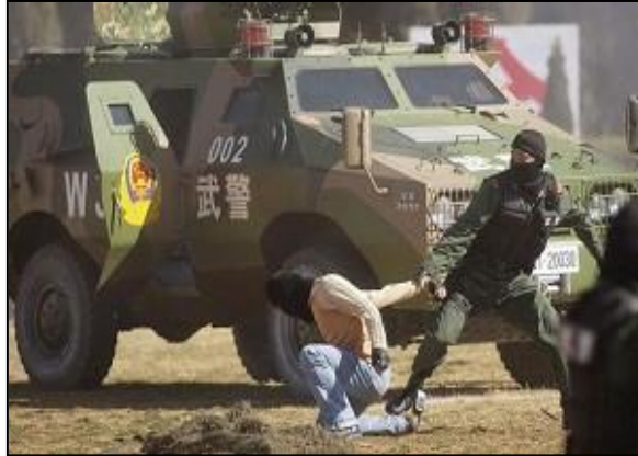
圖九 武警WJ式裝甲防暴車