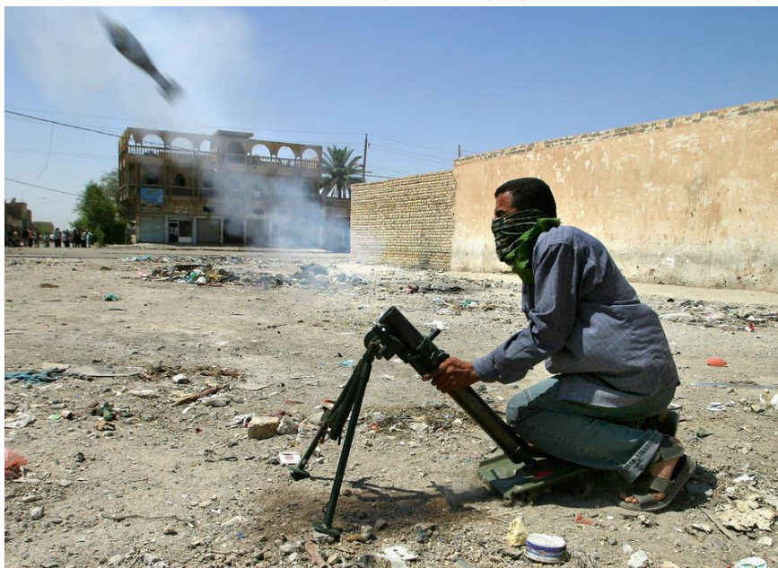
圖七：伊拉克游擊民兵發射迫擊砲襲擊美軍軍事基地，讓美軍防不勝防