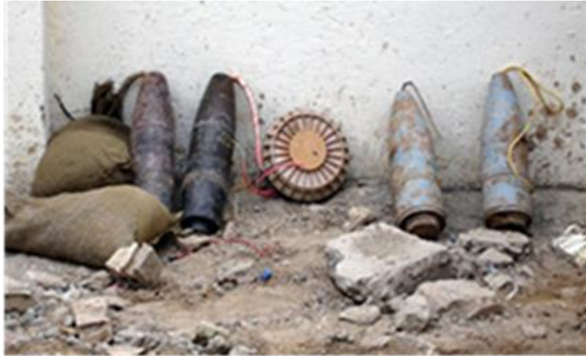
圖二：利用軍用砲彈與地雷組成的應急爆炸裝置