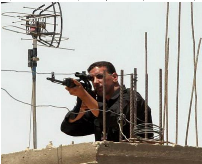
圖六：伊拉克游擊民兵的狙擊手有效發揮狙殺破壞效果，造成美軍很大的威脅