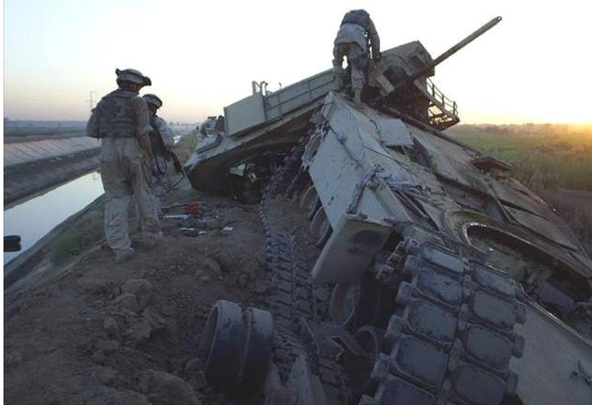
圖三：遭一枚 550 公斤炸彈製作之應急爆炸裝置（IED）所摧毀的 M1 艾布蘭主戰車