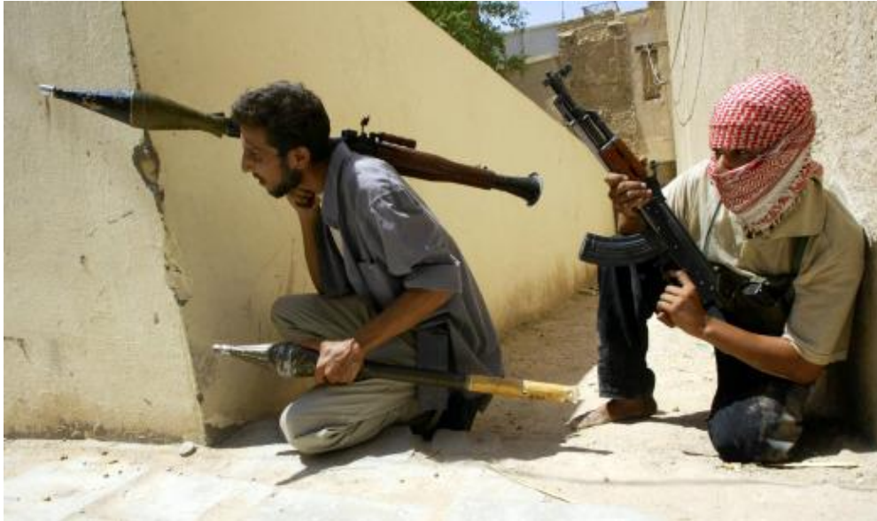
圖八：伊拉克游擊民兵在巴格達東部薩德爾城使用 RPG 火箭筒準備伏擊美軍。