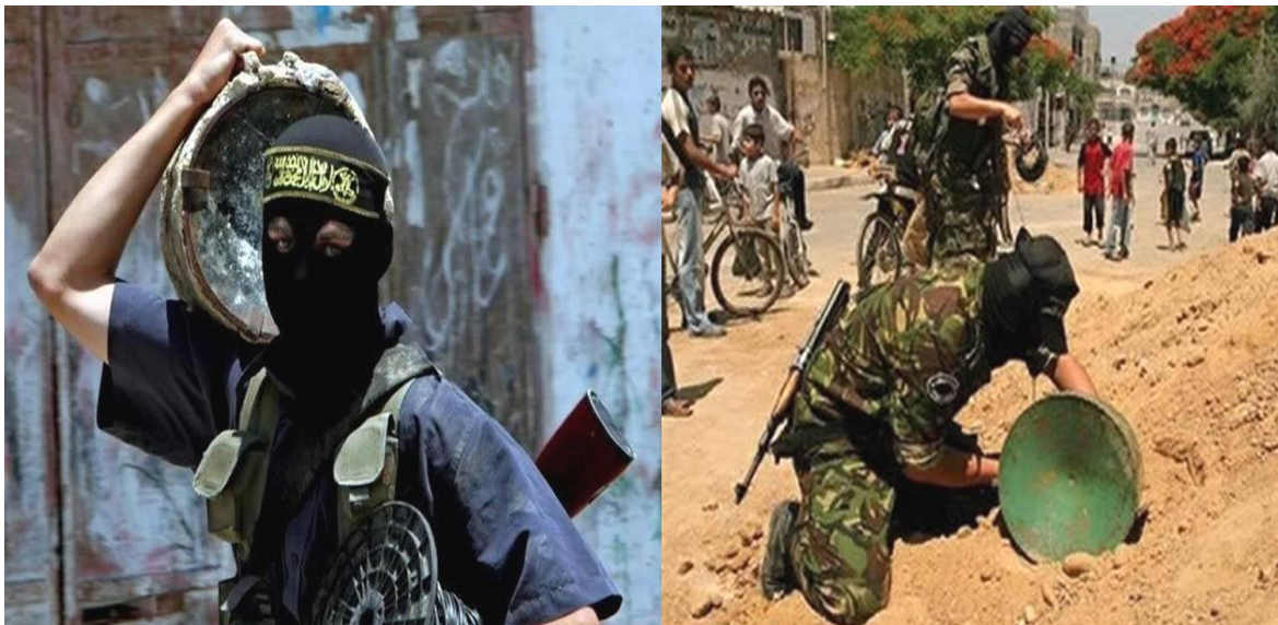
圖四：伊拉克民兵或游擊隊利用爆炸成形彈(EFP)作為攻擊手段