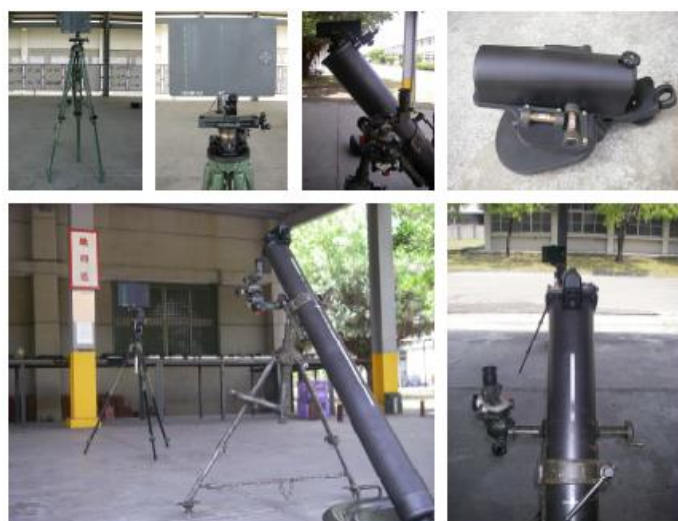
圖三. 火砲雷射校正靶硬體設備圖

七、未來「火砲雷射校正靶」及「迫擊砲射擊資訊化系統」完成建案，配發迫擊砲部隊前，各單位須先遴選具迫擊砲師資班合格證書人員，擇優至步兵學校接受操作及保養要領訓練，以利配合檢驗射擊任務操作及裝備妥善維護。