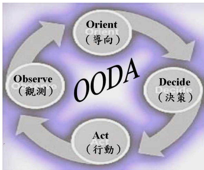
圖 1：OODA Loop (循環理論)