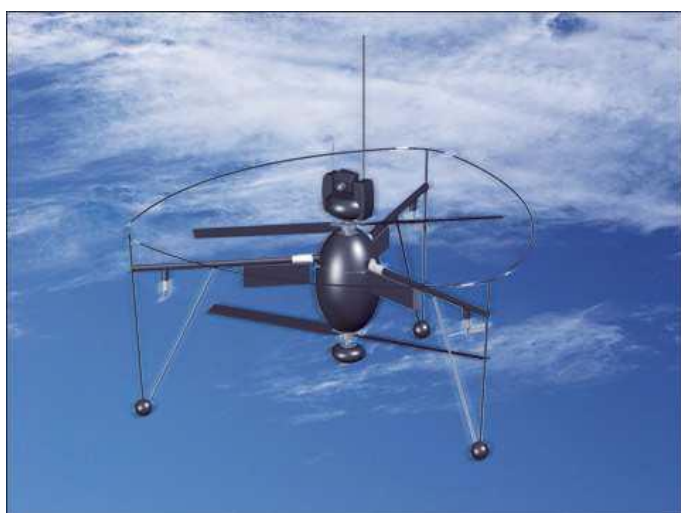
圖 5：FanCopter 微形無人飛行載具