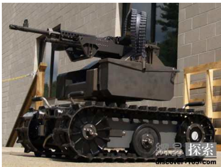
圖 6：具有識別敵我能力的MAARS 機器人

其基本設備除有監視攝影機、距離感測器及攝影鏡頭外，還能根據需求加裝操作臂、抓舉裝置及射擊裝置等設備，除可應用於傳統拆彈技術外，更能於戰場中執行搜索、偵察甚至攻擊等任務。（圖 6：具有識別敵我能力的MAARS 機器人）