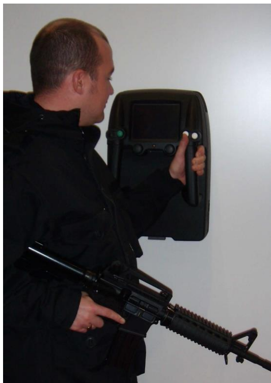
圖 2：3D穿牆人體偵測設備