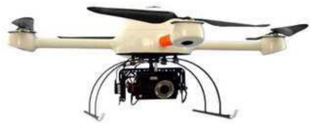
圖 4：SensooCopter 微形無人飛行載具