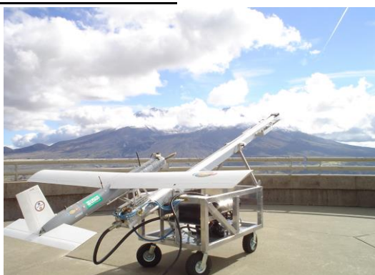
圖四 「銀狐」無人機彈射起飛中