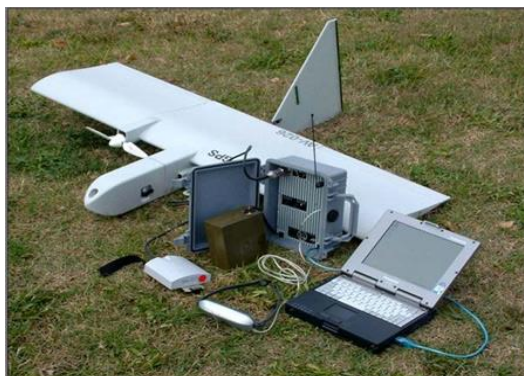
附圖十五：以「龍眼」為例之主要系統