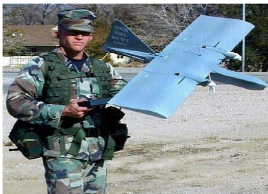
圖三 美軍「龍眼」無人機