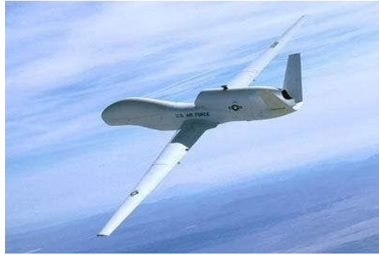
圖一 美軍全球之鷹無人載具