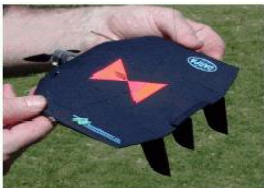
圖五 「黑寡婦」微型無人飛行器