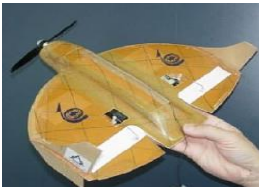
圖六 以色列「蚊子」微型無人飛行器