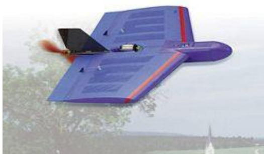
圖七 試飛中的德國「Do-MAV」微型飛行器