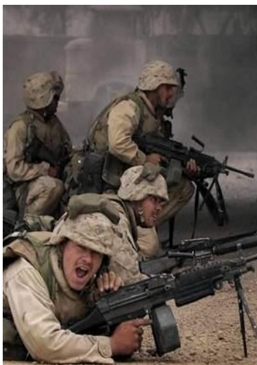
圖四 通信不通易造成友軍部隊相互開火

無法暢通，無法及時互相聯繫，例如，在第一次波灣戰爭中的某次夜間戰鬥中，美軍戰車與伊軍戰車混在一起，為識別己方戰車，美軍指揮官機智的命令己方戰車全部打開大燈，但是，有一輛美軍戰車沒有收聽到命令，沒有打開大燈，結果，這輛戰車被數發美軍砲彈擊中，成了通信不通的犧牲品。又如，2003年4月11日伊拉克戰爭中，底格里斯河兩岸之美陸軍和海軍陸戰隊之間通信不通，彼此小規模衝突持續了將近整個晚上（如圖四）。