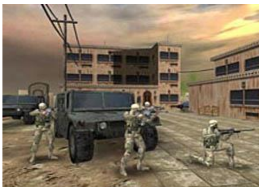
圖十六 模擬訓練系統可虛擬作戰環境，使官兵熟悉戰場景況

擬與軍事虛擬訓練，創造出迄今最大的聯合虛擬作戰環境。演習以部隊實戰與電腦模擬作業相結合，80%的戰鬥都是模擬的，並使用 50 種作戰模式和模擬系統，虛擬攻擊 15,000 個目標（如防空設施、車輛等），分散在全美各地的指揮中心和訓練基地的各軍兵種指揮人員，在同一戰爭背景、同一戰場狀態、同一作戰想定下，同步進行大規模的聯合模擬演練。部隊人員也加強了沙漠戰、巷戰和夜戰的模擬演練，士兵在聲響、氣味、火光俱全的模擬戰場環境下，增強承受精神與心理壓力的能力，使自己明白在未來的實戰中該如何做出正確反應。根據美軍統計，經過最大限度貼近實戰的模擬訓練後，士兵在激烈戰鬥中的生存機率可提高到 70%-90% 68 。戰爭開始後，由於作戰人員熟悉戰場、彼此有戰術默契及對武器操作之熟練，對戰場誤傷防制有相當大功效。