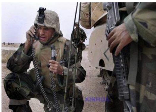
圖十二 第二次波灣戰爭美軍使用移動用戶設備系統 (MSE) 情形

通信系統 (TRI-TAC)、移動用戶設備系統 (MSE)、加強定位及回報系統 (EPLRS)、單頻道地面和機載無線電系統 (SINCGARS)、衛星通信終端設備、高頻電臺、特高頻電臺等 (如圖十二)，使通信可暢通不受阻，避免因通信障礙造成戰場誤傷。