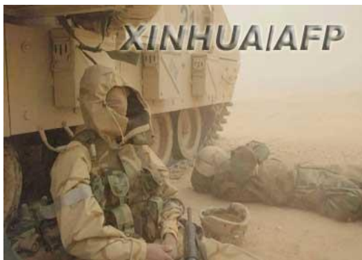
圖十一 遇沙塵暴美軍會適時停戰，減少戰場誤傷

第二次波灣戰爭期間，美軍遇沙塵暴時，會依當時天候狀況，適時停戰，避免視線或武器效能受影響，造成戰場誤傷。