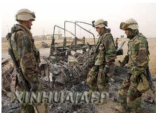
圖二 2003 年 3 月 27 日，在伊拉克南部城市納西裏耶附近，美國海軍陸戰隊士兵站在被友軍誤傷的美軍吉普旁。此次誤傷估計造成 37 人傷亡。