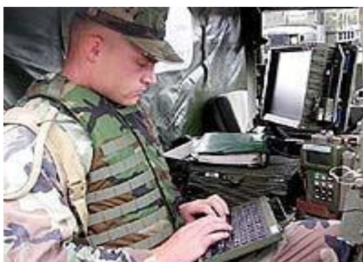
圖九 美軍作戰人員於武器載台內操作 FBCB2