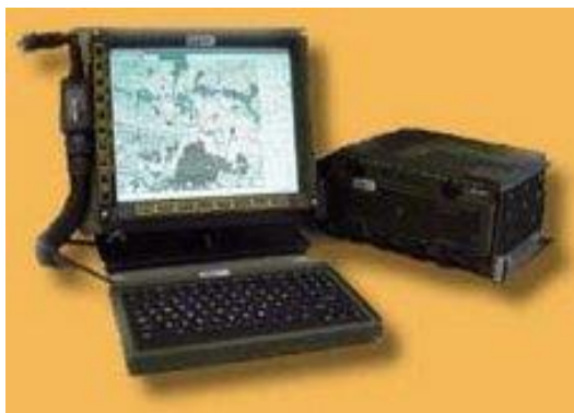
圖七 美軍 21 世紀旅級暨以下部隊戰鬥指揮系統 (FBCB2)