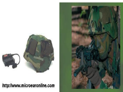
圖六 美軍為單兵整備敵我識別系統

第一次波灣戰爭後，美軍除致力研製車輛和武器平臺之「戰場作戰識別系統」外，亦加強單兵敵我識別系統發展。經近 10 年的努力，美陸軍將在近幾年內裝備單兵敵我識別系統。該系統能向各種武器系統(包括單兵武器系統)提供敵我識別的能力。美軍將敵我識別納入 C 4 I 系統內，其作用不僅可減少誤傷，同時還能增強士兵態勢感知能力及摧毀敵方目標的能力，從而有效提高士兵的生存能力和戰鬥力。在未來的數位化戰場上，敵我界限模糊，雙方部隊交錯活動，這使即時的敵我識別顯得尤為重要。為適應未來數位化戰場的作戰需求，具有敵我識別能力的單兵系統，已成為 21 世紀戰場數位化系統的基本功能單元之一。目前美軍正研製一般單兵間識別用的「徒步式單兵作戰識別系統」(CIDDS)、數位化單兵作戰用的「陸地勇士作戰識別系統」(LW-CIDS)及攻擊直升機對單兵作戰識別的系統(HDSIDS) 64 。