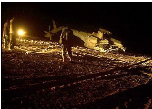
圖三 2003年3月28日，美軍2架「阿帕契」攻擊直升機在伊拉克中部起降時相撞墜毀，飛行員未受傷，圖為墜毀直升機的殘骸