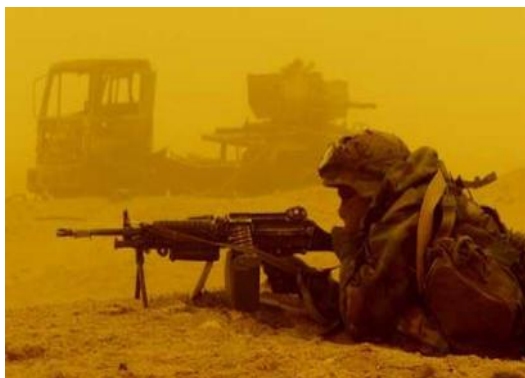
圖五 天候狀況不佳易造成誤傷事件

年2月17日凌晨，美軍第101機械化步兵師在「阿帕契」攻擊直升機配合下，以戰車和裝甲運兵車在陣地前沿執行巡邏任務，突然刮起一陣沙塵暴，直升機上雖有夜視裝置，但在沙塵暴狀況下仍無法有效分辨敵我。正在此時，美軍巡邏隊與伊拉克軍隊遭遇，雙方交火，「阿帕契」直升機向伊軍發射飛彈，然而，由於天氣的影響，使飛彈偏離了目標，射向了自己的部隊。其中有2枚擊中自己人，一枚擊中一輛M-113裝甲運兵車，另一枚擊中一輛布雷德利戰車，美軍士兵2名死亡，6名受傷。據統計說明，在第一次波灣戰爭中，約有39%的誤傷是由於目標識別錯誤造成的。而其中最主要的原因是氣象條件和戰場環境，這種誤傷數在28起事故中佔11起 57 （如圖五）。