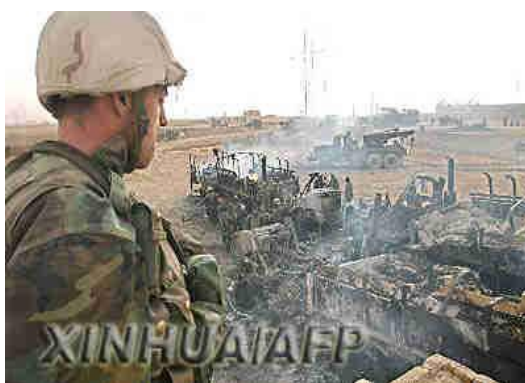
圖一 2003 年 3 月 27 日，在伊拉克納西裏耶附近，一名美軍士兵看著夜間被友軍火力摧毀的軍用車輛

鄰 3 月 27 日美英聯軍地面火力誤擊納西利亞美海軍陸戰隊，造成 37 名人員傷亡。(如圖一、二)