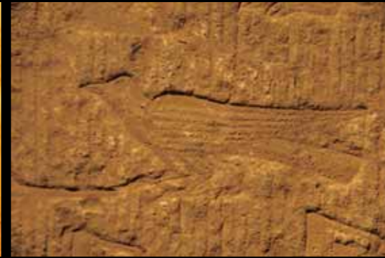
山東晉陽縣後漢時期石刻三足鳥