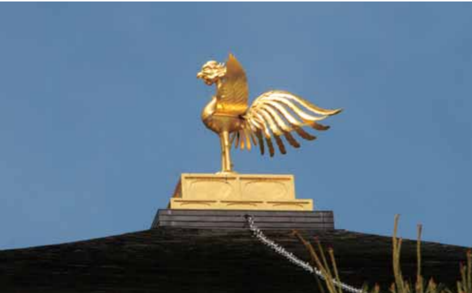
京都金閣寺的鳳凰

物的產區而影響到其色相。這方面的變化，可以從目前尚留於各地的石窟繪畫或文物得到印證。除了繪畫的使用外，道教裡也經常可以看到許多的儀式中使用朱砂，象徵了功力、象徵神明的存在。當然朱砂的色相也長期困惑了中國人，朱砂是道教術士煉丹的題材，更是長生不老藥的代言。