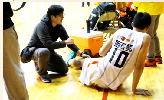
▲擔任隨隊運動防護員最主要是與球員取得良好的信任感，適時地給予鼓勵與協助。