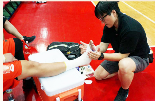
▲協助選手腳踝貼紮防護。