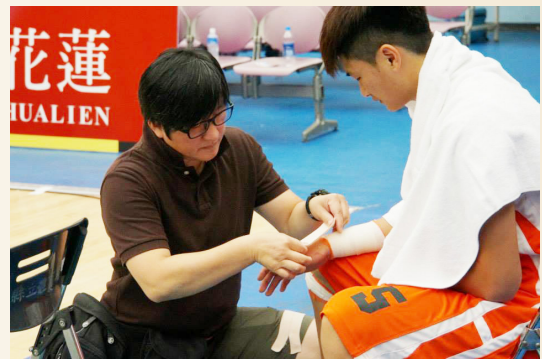
▲運動防護員為球員貼紮。

生有實習機會。隨隊運動防護員的介入多年，球員的受傷就醫、治療及患側肌力復原等等工作都由防護員執行，教練與防護員間得以產生良好的溝通，並能充分執行醫囑，以對球員提供最好照顧。