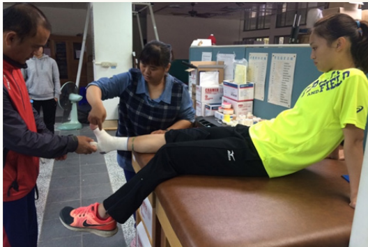
▲運動防護員協助田徑教練及選手練習比賽時的腳踝貼紮。

日益增加，各單位皆已朝向多元發展的經營方向前進。因此部分醫療診所選擇與運動防護專業結合，除醫療診治外另加上運動功能重建規劃服務（如表 2）。