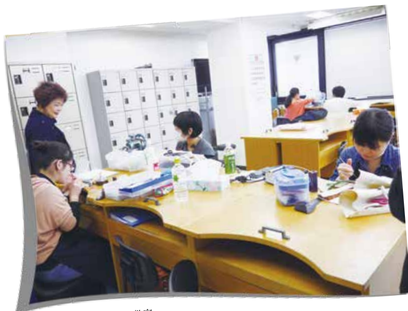
日本寶飾工藝學院 - 金工教室

為期 14 天的日本學習之旅，除了讓大夥真正對於珠寶設計有更進一步的領悟，也加強了團員們對於珠寶設計的概念，相信大家離自己的珠寶設計夢想也將越來越近。