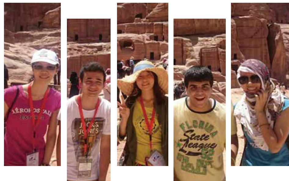
with Jordanian participants at Petra

一下飛機，迎接我們的不是網路上所寫令人心驚膽跳的四十度高溫，而是和煦暖陽及溫柔清風。背負著國家的期盼，三個剛踏出高中校園的女孩，懷著科學的熱忱及探索的渴望，來到了甚是神祕的國家—約旦，參加亞洲國際科學博覽會。前往會場的漫漫長路上，我奮力撐起被睡魔拉扯著的眼皮，只為收攬窗外逝去的異國風景，一望無際的沙漠綴著幾棵椰樹、幾幢樓房、還有種植著甜入心坎的水果溫室。那時的我必定沒料到，短短五天旅程，就讓我愛上這個在荒漠中閃耀的國度。