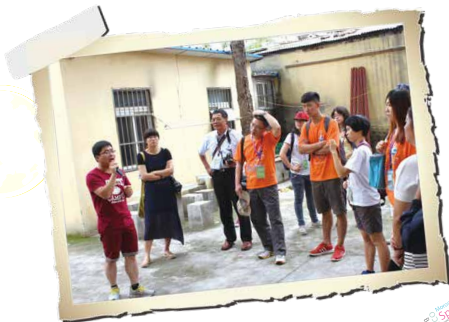
參訪愛之光工藝發展中心

從中學習到甚麼，知道自己可以為團隊付出什麼，進而在活動中學習到更多，得到更多，也使我們團隊更進步，最後一起完成另一段旅程。