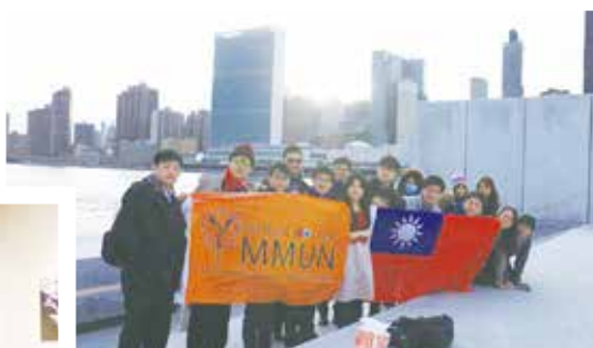
在羅斯福四大自由公園合影留念，遠眺對岸的聯合國總部。

整個會議期間，不斷的與同儕激盪出不同的火花，當一位稱職的剛果共和國大使，須對剛果的狀況全盤了解，而團隊也很幸運的能至駐美國剛果大使館進行訪問，不僅對議題有更深一步的認知，更掌握了已存在的法條、解決方式及需要努力的空間，加強了論述的精準度。