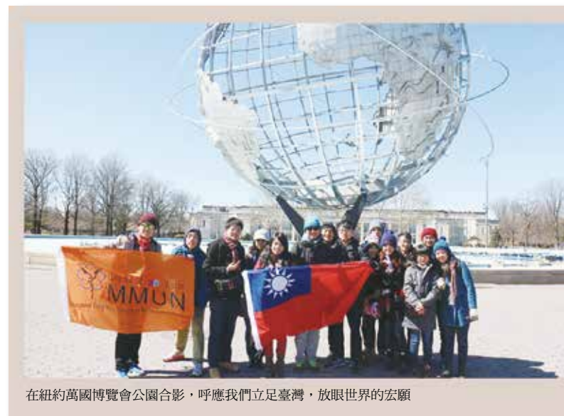
在紐約萬國博覽會公園合影，呼應我們立足臺灣，放眼世界的宏願

即使身為學生，也可以透過自己小小的貢獻，讓整個世界轉變，今年的紐約模擬聯合國會議讓陽明大學團隊每一位成員獲得成長的養分，相信在不久的將來，將會有非常優秀的青年，熱情地為臺灣付出。