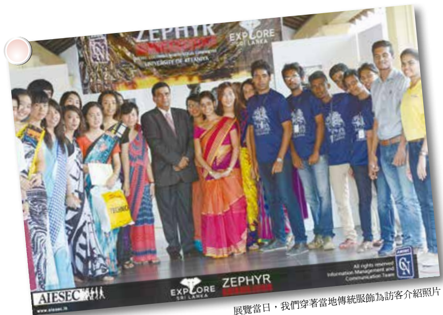
展覽當日，我們穿著當地傳統服飾為訪客介紹照片

自己也可以跟別人捕捉一樣的畫面，或許因為最初的能力太不足，所以進步的幅度特別大，好像有股正向的能量在心裡支撐著自己，想要進步更快、變得更好，每天睜開眼都在期待今天過後自己的不同。