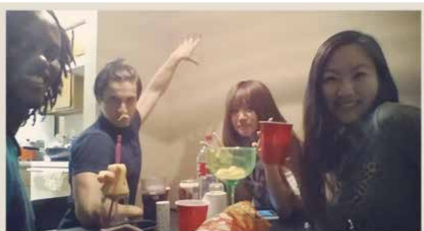
下班後與朋友小酌聊天成為美國生活的一部分

我的國際觀、做人處事及生活態度有了變化，未來不論身處在何處，我也會努力在生活中學習，讓自己成為兼容並蓄的人。感謝在我身旁鼓勵、支持我的人，讓我有機會用不同的方式看世界向世界學習，我也不會因此感到滿足而停下腳步，所以感動的故事未完待續…。