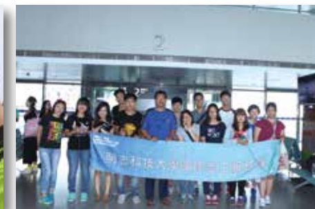
明志科技大學國際志工服務隊合影