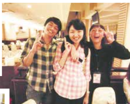
泰國代表及臺灣代表與我