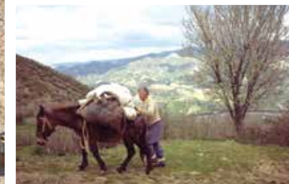
我們都在學習與這個世界相處