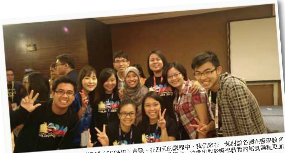
亞太區域醫學生會議醫學教育部門 (SCOME) 合照。在四天的議程中，我們聚在一起討論各國在醫學教育的差異，了解健保制度的不同，比較優缺點分析，在這樣的過程中，彷彿也對於醫學教育的培養過程更加了解。

對於一個總是嚮往親手觸及世界之廣的不安靈魂，大概也只有每當靠近世界一步，才會感受到心靈深處的平靜吧！