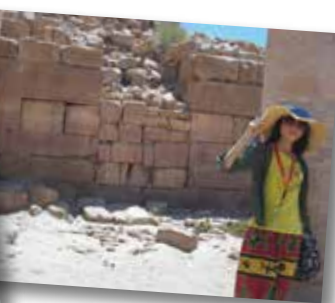
左：安曼街景 右：Petra 與我