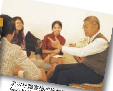
黑客松競賽後的檢討時間，學員和老師都很希望能真正執行我們的計畫