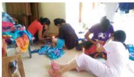
「紗麗」是斯里蘭卡女生傳統服飾，買回來的紗麗只是一塊布料，需要額外剪裁和燒邊線