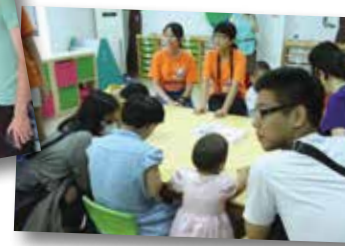
到蘇州市兒童福利中心陪伴身障兒童