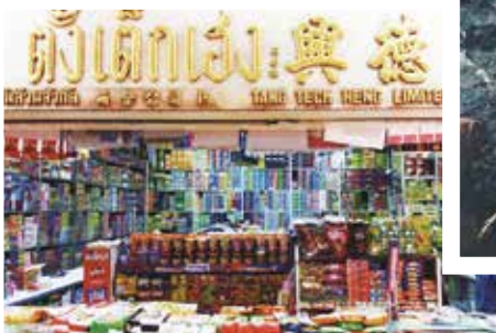
有著各式華人商號的 Yaowarat (註：曼谷中國城所在地) 是許多泰國大企業的發跡地