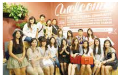
在 Impact Hub 的合影