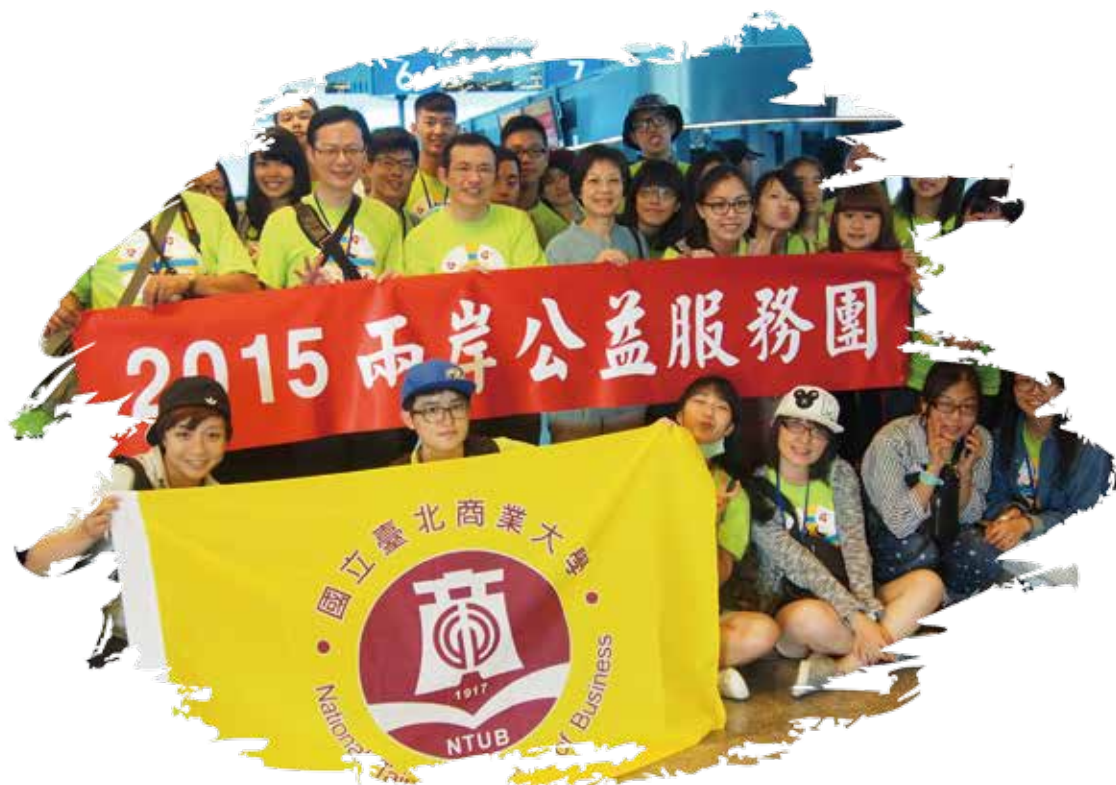
出發前學務長特地至機場送機