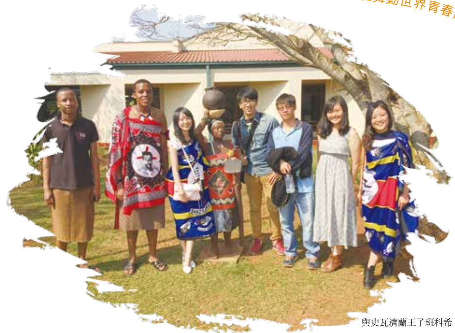
與史瓦濟蘭王子班科希