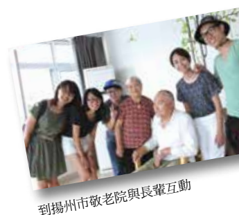
到揚州市敬老院與長輩互動