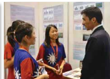
約旦親王親切地聆聽我們解說作品