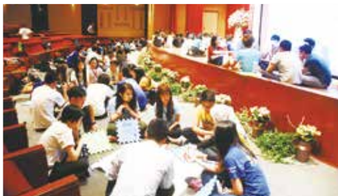
世界咖啡館的進行