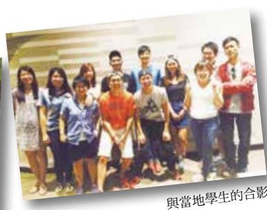
與當地學生的合影