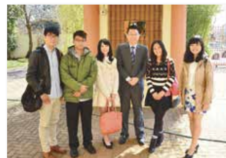
與代表處駱秘書合影

種族隔離的結束，成功帶領南非從舊規則進入理想的美麗新時代，她將以民主、自由與平等作為國家精神，成為人民的信仰。而這 20 年來，南非的民主令人尊敬，但那不代表她不存在爭議，翻轉社會是一個過程，