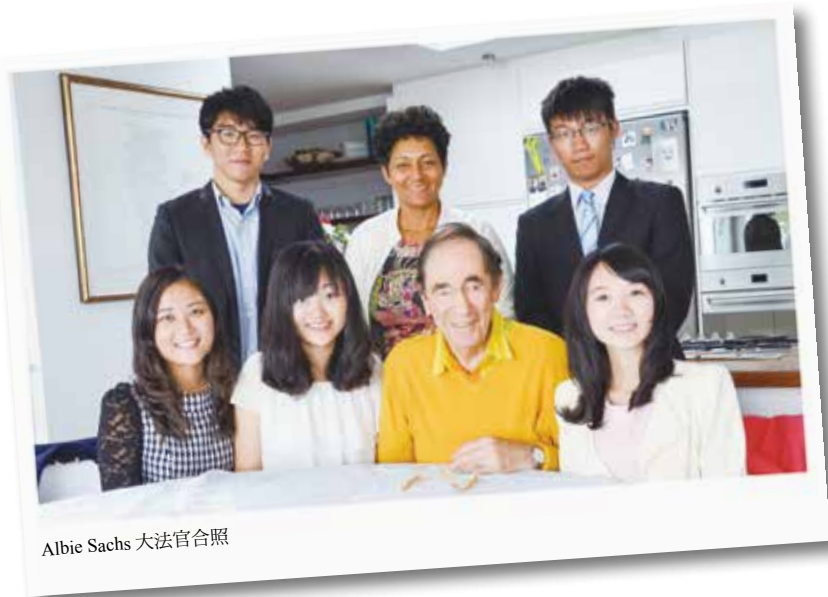
Albie Sachs 大法官合照

在國家地理雜誌中，非洲特輯是「空白封面」，只因為非洲是我們最不了解的大陸，也是最複雜難懂的區域，因為它瀰漫著迷幻色彩，也因為擁有豐富的天然資源，全球都關注著非洲的崛起。而在非洲佔有一席之地的南非在國際上有兩個重要且恆久的貢獻：一是無法消除的羞恥，另一是永垂不朽的榮譽。所謂無法消除的羞恥是指種族隔離（Apartheid）；永垂不朽的榮譽，則是真相還原與和解委員會（Truth and Reconciliation Commission, TRC）的設置與實踐，這兩種制度對於就讀法律系的團隊而言是非常值得探討的案例。