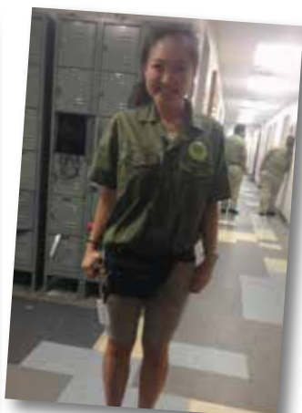
每天打扮像叢林導覽員帶客人進入熱帶雨林世界