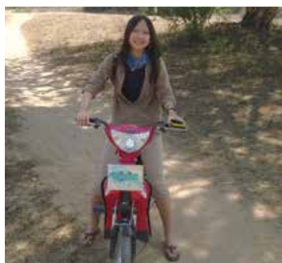
嘗試當地的交通車