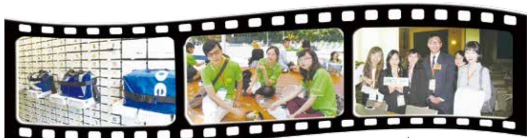
左：FRIETAG 中：在瑞士街頭上用餐 右：在世界貿易組織的合照

但能夠從非正式的途徑提升我國在國際社會的地位，這也是讓其他人認識中華民國的方式。」