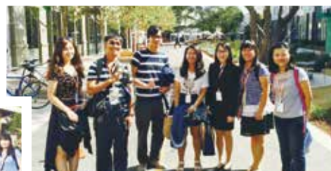
與 FB 工程師