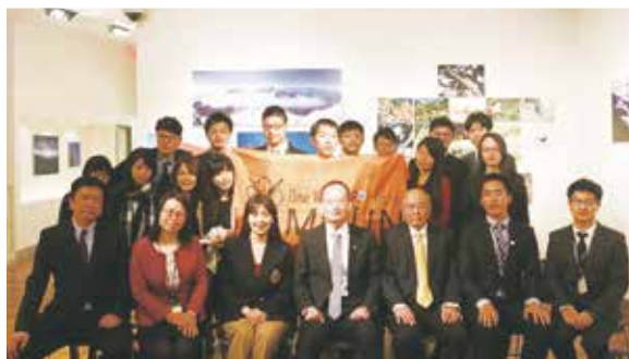
陽明模聯全體團員和中華民國駐美經貿辦事處官員合影留念