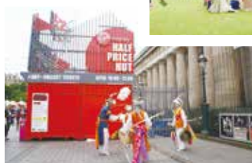
愛丁堡國際藝術節