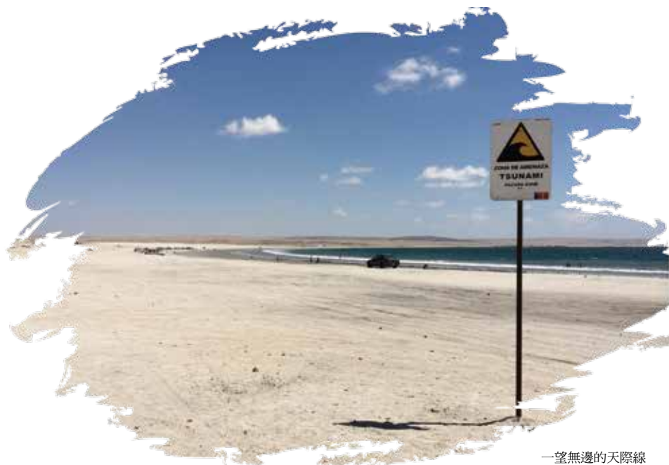
一望無邊的天際線