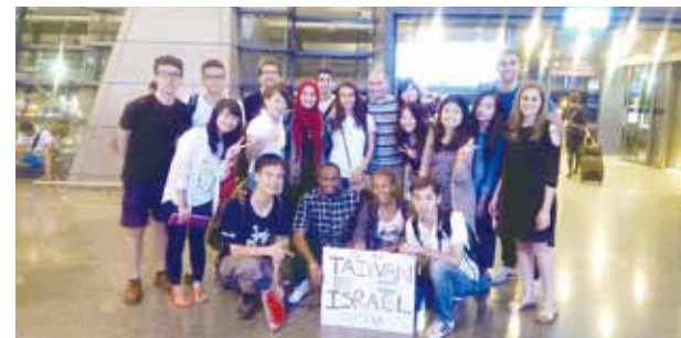
在機場的首張大合照

而最讓惟如不捨的是與以國青年的情誼，雖然只是短短8天的相處，卻與他們建立起深厚的情誼，相信在不久的將來，他們總會在世界的某處再相見！