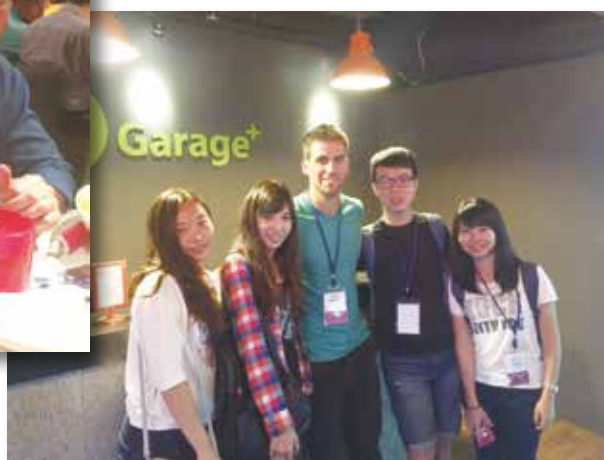
我們在 Garage+ 育成中心