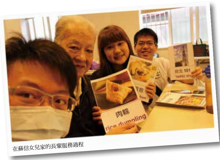
在蘇信女兒家的長輩服務過程

教授的分享，也是讓我感觸非常深的一段話，讓我思考我們做公益最初的目的地到底是為了什麼？是為了自己？還是為了別人？還是為了讓整個社會更美好。