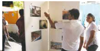
專案的工作之一是辦展覽，展出旅程中大家的作品