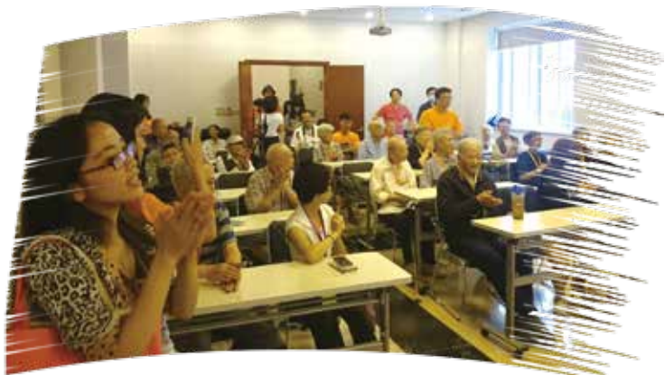
在蘇信女兒家與長輩互動