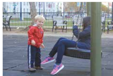
舊金山市政廳前公園與小孩玩耍