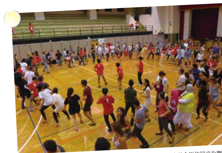
2014 世界醫學生大會會前會原住民文化舞蹈