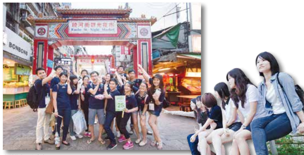
臺灣著名觀光夜市

開幕晚宴上，臺灣夥伴以及表演團隊帶來了旗舞、國樂、扯鈴等傳統表演吸引大家目光，與會的各國同學也拋開羞澀開始聊天，一個具神奇力量又凝聚彼此的大會活動，就此正式展開。接著一場場精彩的學術演講讓與會者聽得津津有味，活潑有趣的內容也博得大家一致的好評！與廠商合作舉辦的牙材展也是一大特點，除了展示最新穎牙材科技外，也讓與會者動手操作，寓教於樂的感覺真是棒極了！