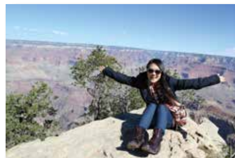
震撼人心的大峽谷

同的美麗風景，在德州當帥氣牛仔女孩，在奧蘭多像個孩子般跑跳，在紐約僑裝成冷漠紐約客，在拉斯維加斯化身為賭徒，在加州變成陽光海灘少女，到不同的地方轉換不同的心境，觀察當地人的生活是我的樂趣，我喜歡尋找差異中的美好。