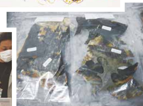
日本寶飾工藝學院—龜殼