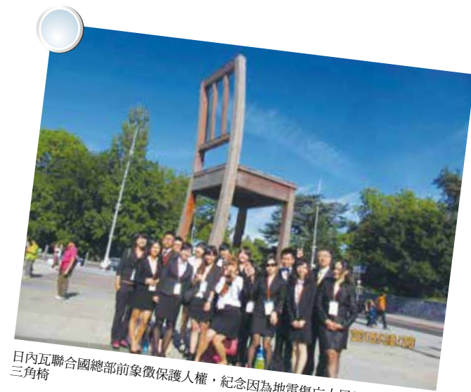
日內瓦聯合國總部前象徵保護人權，紀念因為地雷傷亡人民的著名地標—三角椅

IUCN 國際自然保護聯盟，致力於自然環境的保護，並透過教育的方式讓民眾了解生物多樣性、氣候變遷、可再生能源、綠色經濟等議題。陳