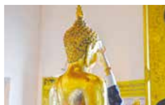
寺廟裡，往佛像「臉上貼金」的信眾絡繹不絕。西元 2000 年，泰國佛教人口已達總數的 94.6%，遠高於第二名伊斯蘭教的 4.6%。