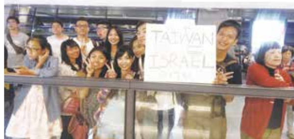
接機，等待以色列朋友