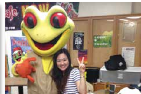
公司吉祥物 Cha!Cha! 總是把客人逗得哈哈大笑