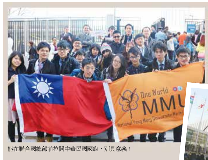
能在聯合國總部前拉開中華民國國旗，別具意義！