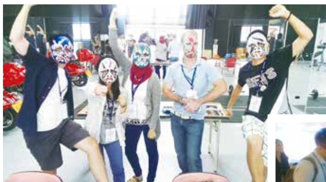
我和我可愛的以色列朋友

臺灣小吃聞名世界，而這也是以國青年到達臺灣最想嘗試的，他們列出 CNN 所報導之臺灣 45 項必吃小吃，要求臺灣青年帶領著他們一一嘗試，在這探索臺灣文化之旅中，除了美食外，另一吸引他們的是「寺廟文化」，在造訪孔廟與保安宮時，壯觀巍峨的中西傳統建築著實震懾了以方青年！在參觀孔廟時，巧遇國中小生們正在準備教師節的八佾舞表演，而在保安宮內，以國青年好奇的詢問道教與佛教的差異，也詢問信徒們拿香與擲茭求籤的步驟並親身體驗，這些文化對於以國青年而言是神聖且獨特的，他們也抱持著敬畏的心態來認識這流傳千年的中華文化。