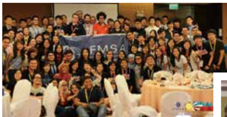
亞太區域醫學生會議大合照

這一次我穿上西裝走進世界會議室裡，打開手中的公事包，學習分享，也學習獲得，或許公事包的重量沒變，但我確信，裡面的故事更加精彩了。