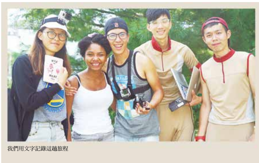
我們用文字記錄這趟旅程

一個小小行動，可能改變自己，也可能影響他人。我們從小備受呵護，而今成長茁壯，承接長輩的奮鬥精神，勇敢跨出自己精彩的一頁。我們想，為生活、為夢想努力打拼的每個人，都有 Match Generation 火柴青年的特質，它不侷限在一個年齡範圍內。當我們一同為這塊土地付出，點燃自身，我們更能夠發現與珍惜臺灣的美好。