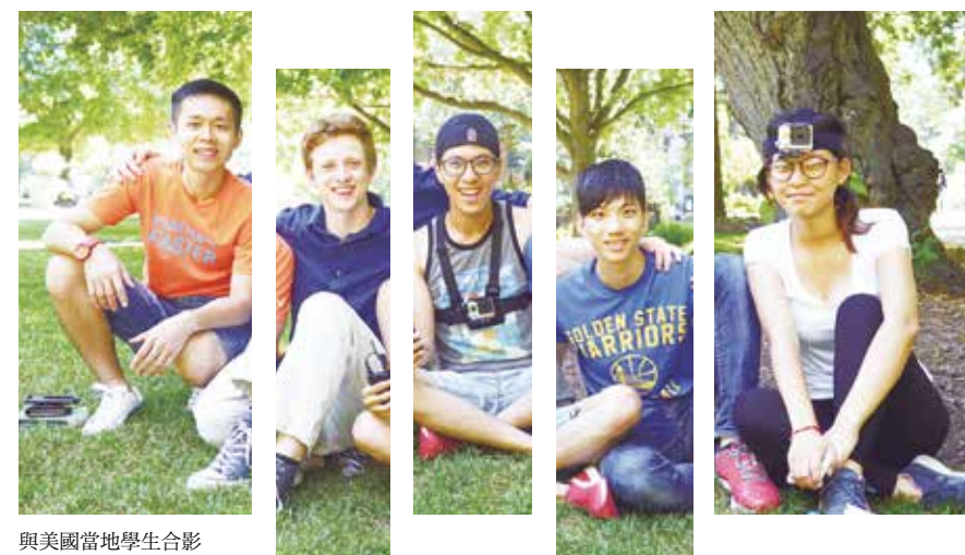
與美國當地學生合影