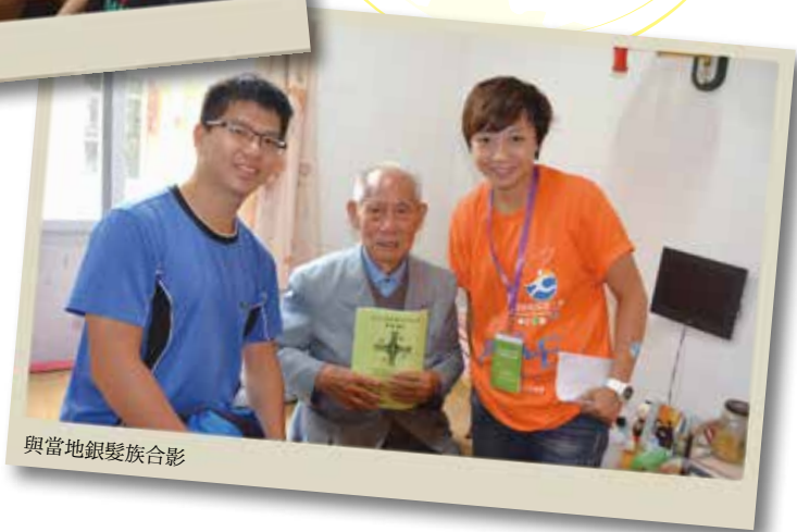
與當地銀髮族合影