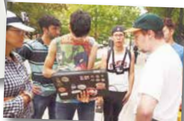
與美國當地學生的互動