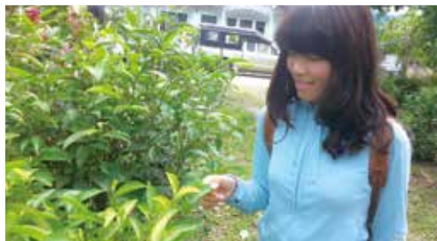
享受這一趟旅程的我