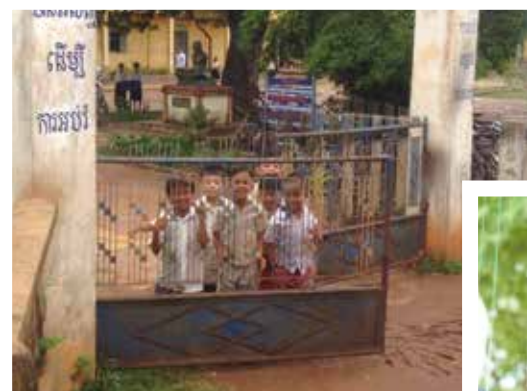
烏棟小學的孩子們

積雨雲後，又是整片陽光乍現的藍天。帶著一點自以為是的瀟灑來到這片土地，留下的是更飽滿而純粹的真實。