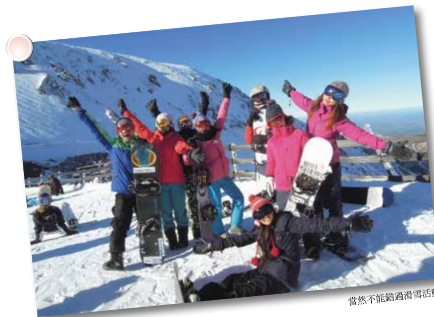
當然不能錯過滑雪活動

在臺灣很多時候都無法安於現況，有工作嫌工作太累；想休息安排假期出去玩，卻苦於賺不到錢或沒有長假可以安排旅行。沒工作時又害怕沒有收入，不能花太多錢在吃喝玩樂，要省吃儉用。為什麼我們總是無法盡情地享受當下呢？那麼當初到底為的是什麼？學習感受現況所有的一切，感謝所有經歷的一切，減少抱怨、減少想要的慾望、減少以後還可以的想法，只好好地享受現有的片刻，這是經歷了兩段度假打工著實的體悟。生