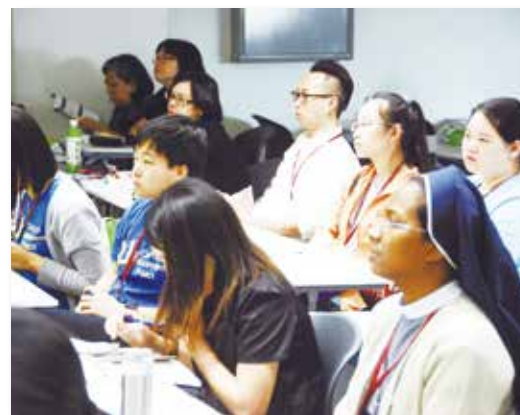
認真聆聽專題發表