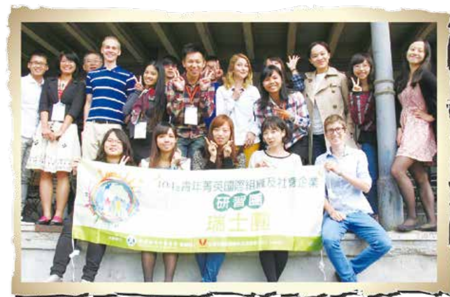
Impact Hub 參訪