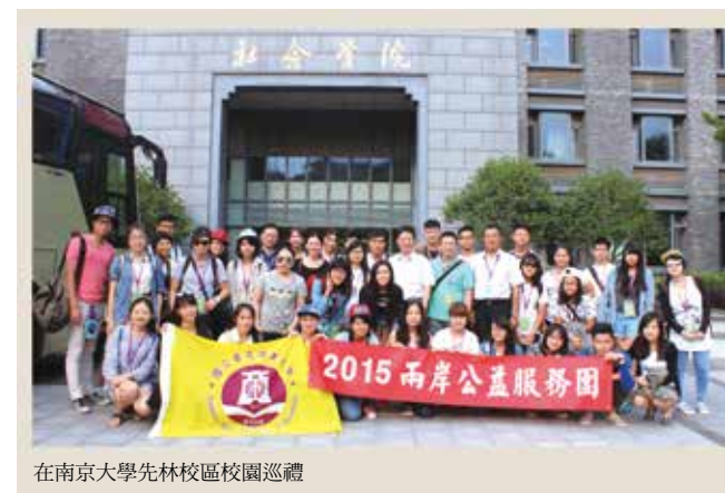
在南京大學先林校區校園巡禮

我開始尋找「公益」在我心中的意義，發現公益可以是種生活的方式，只要你願意，在日常生活中做的每一件事，都可以跟公益扯上關係，只要是對社會有正向影響的，可以創造公民共同利益的行為；而服務是種自願性的行為，願意花時間去幫助其他人，帶給其他人快樂，進而讓自己也快樂，可以帶來雙贏的局面；所以公益服務是做對社會有益的服務，而且是自發性的，是為整個社會設想，最終，帶給自己與整個社會雙贏的行為。