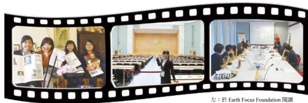
左：於 Earth Focus Foundation 閱讀 該機構發行之報章雜誌 中：UN 萬國宮 右：參訪 GEN