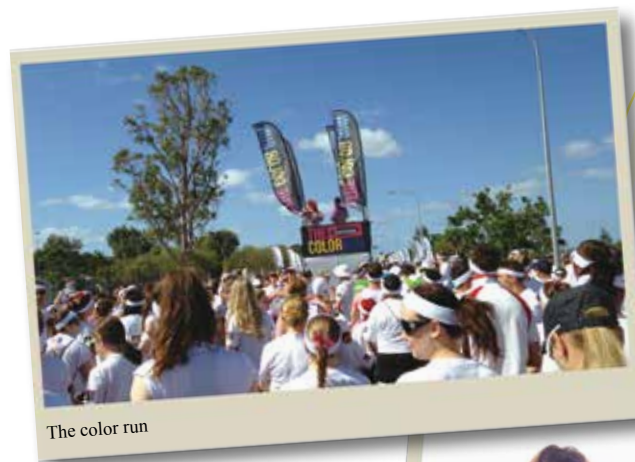
The color run

因為媽媽搭的飛機延誤，接機的我實在很緊張，一見到媽媽內心真的很澎湃，當晚我們根本沒有睡覺，只是一直聊天，這 21 天的行程很充實、很快樂也很難忘，將會是我也會是媽媽最美的回憶。對我來說，最大的收穫是那平時說不出口的愛；對我來說，最大的收穫是那起起落落的 2 年；對我來說，最大的收穫是媽媽從澳洲玩回臺灣時滿足的表情。