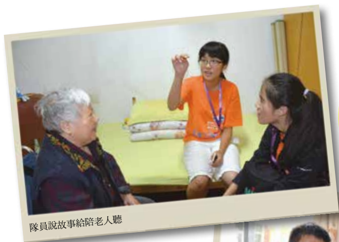
隊員說故事給陪老人聽

探索世界的方法有很多種，就我而言不必登高望遠，其實投入服務是發揮自己所長，就能為這世界帶來一些改變。身為隊長的我，在服務的過程中學習到了如何組織團隊及善用各方資源，共同面對突如其來的挑戰，並嘗試克服，解決問題。很感謝我的夥伴們的諒解與配合，一起記錄這段難忘的回憶。「有能力的人，才能走得更遠、給社會更多回饋。」一直是我勉勵自己的一句話，只要還有能力，我想要為自己締造不一樣的歲月時光，然而投入國際志工就是改變世界、改變自己的不二法門。