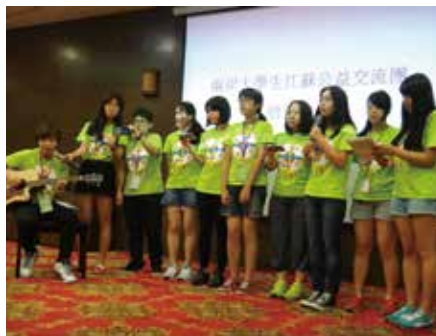
兩岸大學的惜別會

益組織。第一次和當地的年輕人一同交流對公益的看法，其中有一位同學分享說：他們曾在南京最熱鬧的新街口做了街頭採訪，訪問當地年輕人對於「公益」的看法，問十個人有十個人對於公益都不認識，覺得是大人物才會做的事，讓他覺得很灰心，所以他們才想要發揮自己的力量，讓更多人開始接觸公益。其實聽到後讓我非常錯愕又感動，雖然大陸很大，有龐大的人口，有很多需要進步的空間，但卻有著一群為了公益努力奮鬥的年輕人！他們的精神，正是我們需要學習的態度，發揮自己的正面能量去影響他人，創造更大的能量！