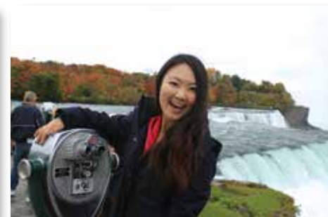
終於親眼看見名聞遐邇的尼加拉瓜大瀑布，真的覺得此生無憾