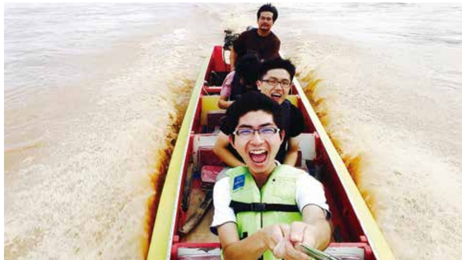
乘一葉扁舟，馳騁於金三角流域，感謝彼此給予勇氣，百年修得同船渡

迎向全球化時代，青年必須具備 Global Mobility，3 個大男孩透過國際壯遊，融入當地體驗在地文化，同時也跨出舒適圈，結識不同國家的青年，建立跨越國界的學習網絡與人脈。這趟的泰國行順著湄公河而下，由清邁、清萊、素可泰、大城、曼谷直到北壁，由北而南一路觀察泰國社會百態。