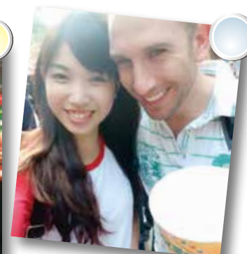
我和我的以色列朋友