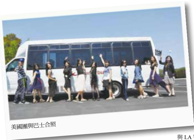
美國團與巴士合照