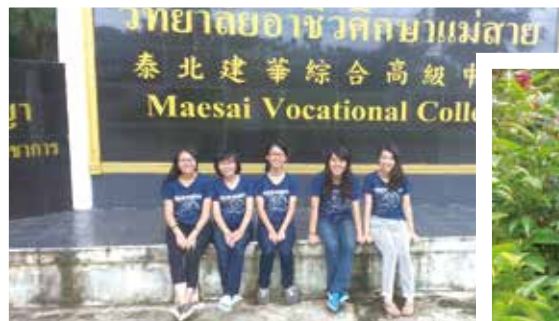
與朋友來建華中學服務，在校門口合照留念

這趟旅程中，讓驕傲的我，學會在命運面前秉持謙卑的態度外，在建華真的使我不斷體會的另件感動就是：珍惜你所擁有的，來到泰北，在愜意的生活中，使我看見有些人連最基本的生理需求都無法滿足，我也不忘提醒自己要當個凡事感恩、凡事包容的人，除此之外，真的很感謝系上安排海外實習的機會，讓我來到建華奉獻自己，若未來有機會再回到我的二個歸屬—泰北，我會再幫助更多需要幫助的人，隨時提醒自己要當那個先去付出、貢獻，而不求回報的人，如同德雷莎修女所言：「要永遠面帶愉快的微笑，不要只是付出你的情懷，還要付出你的真心。」