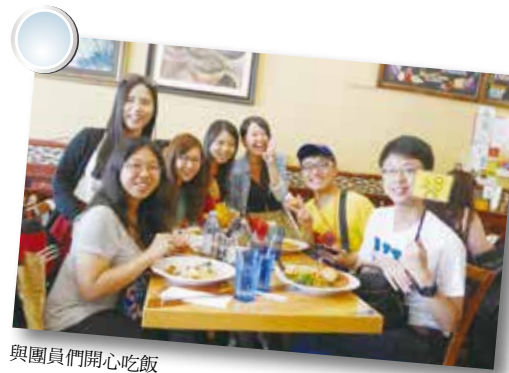
與團員們開心吃飯

而這就是 Change.org 的主要訴求，無論是人民聲音可以被政府聽見，或是政府的決策可以被人民接納，Change.org 創造的是一個雙向且良性的溝通橋樑，而這橋樑也讓這社會多一點公平，少一點紛爭。