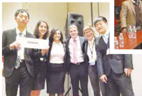
團員與委員會內的與會者合影留念