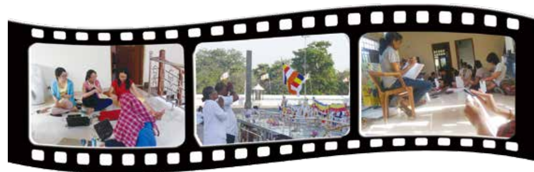
左：工作日時，大家會整理旅程中所蒐集的素材，並分成小組完成工作，包含寫文章、剪輯影片、編輯照片。 中：很多佛教殿堂都可見到虔誠的人們和飄揚、鮮豔的佛教旗子。 右：將保麗龍板的邊緣磨到平滑。