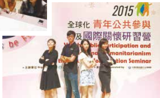
我們是最強的團隊！