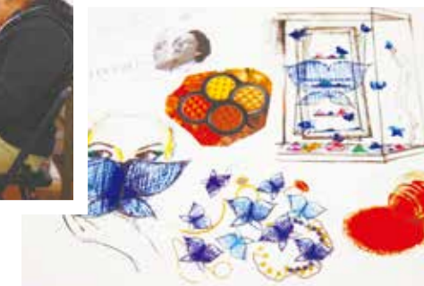
水野學園—設計圖樣