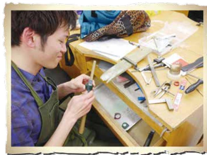
日本寶飾工藝學院一學生工作的樣子