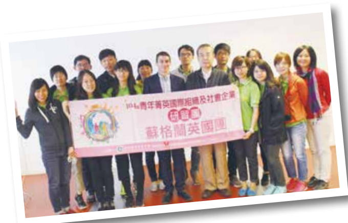
於 Impact Hub 合影

整個參訪行程從蘇格蘭橫跨至英格蘭，參訪了 Edinburgh、Glasgow、Dumfries 以及 London 等四個城市，從過程中不斷成長、學習，並與團員在每次的探訪與研習中，激盪出更多的火花。