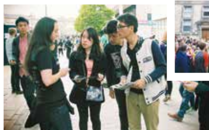
與文創藝術工作者的街頭採訪