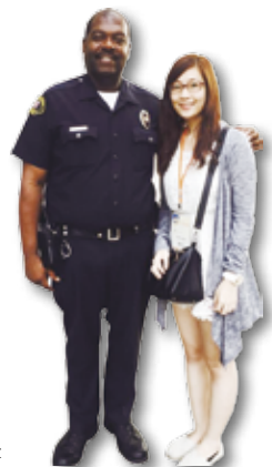
與 LA 警察

揮一揮手，向來送機的家長們道別，一群平均 20 歲的青年，臉上散發著青春洋溢，對於即將展開的旅程，有著無限的期待，心一是滾燙的，熱情一是澎湃的。貌似大鯨魚的飛機在不斷的加速下，咻的一聲躍上好幾萬英尺的高空，帶著他們前往另一個國度—美國。