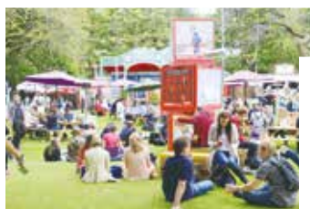
愛丁堡國際藝術節熱鬧情況