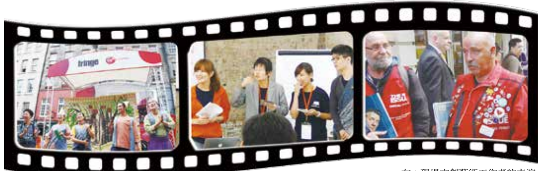
左：現場文創藝術工作者的表演 中：黑客松競賽情況 右：TBI 街頭的 vendor

在經過英國之行的洗禮後，以真對於企業的社會使命有更深層的理解與體會，更希望臺灣能以英國為標竿，效法英國政府，充分運用法令以及教育體制，提升對社會企業的重視。以真也呼籲一般企業將企業社會責任視為企業核心宗旨之一，讓解決社會問題融入企業內部價值。以真也期待政府能投入更多資源扶植社會企業，讓社會企業成為未來企業發展的主流，使臺灣社會品質隨著經濟發展一同提升。