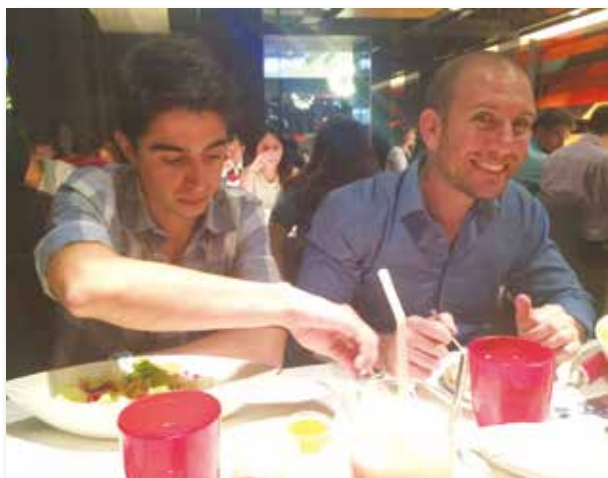
可愛的以色列青年