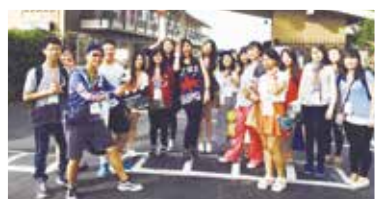
美國團 於奧克蘭旅館前