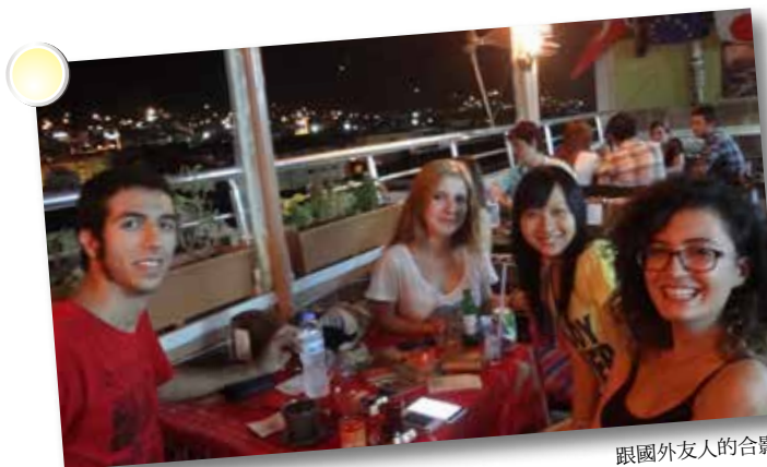
跟國外友人的合影

19歲那年的夏天，我獨自飛到了土耳其旅行。在那40天裡我逆時針環了土耳其西部一圈，去了大大小小超過20個城市，而那是我第一次的一個人旅行。在那一個多月裡，我嘗試了各種人生第一次：抽各種口味的水煙、搭便車兩百公里來回黑海邊的小鎮、看旋轉舞、搭熱氣球升空500公尺俯瞰安納托利亞高原、洗道地的土耳其浴、住青年旅館與各國的背包客相處...這些對我來說都是新鮮的體驗。在土耳其的日子至今令我懷念，甚至可以說是我人生中最難忘的夏天。今年，在冬天快要結束之際，在我21歲生日之前，我又再次背起背包，飛到緬甸旅行半個月。在這半個月裡我搭了臥鋪火車、在佛塔上看日出日落、在孟加拉灣裡游泳，當然也在青年旅館認識了不少有趣的背包客。