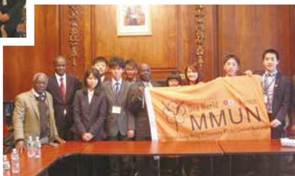
有幸拜會剛果共和國駐紐約大使館，為我們這次在會議中扮演的國家角色有更明確清楚的方向。