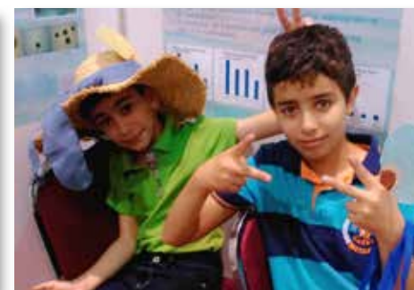
一直跑來我們攤位玩耍的約旦小孩