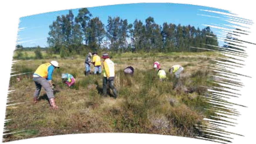
在澳洲工作的樣子