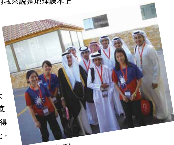
with Kuwaiti participants

幅員廣袤的地區，是歷史課本中刀光血影註解的一章；阿拉伯人在電視機扭曲的映像中放送出的，是恐怖份子、宗教狂熱、落後迂腐的皮囊，再怎麼高喊族群平等、世界大同，我們無可避免地在心底仍有一些刻板印象，會覺得犯罪意圖與膚色深淺成正比，會認為某些宗教背後散發著邪