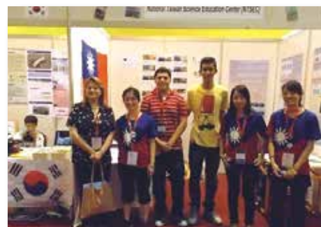
with Jordanian participants