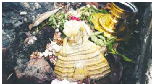
佛說：緣起緣滅，緣聚緣散。