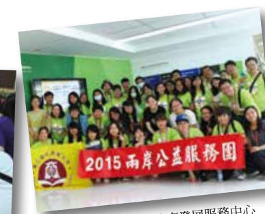
參訪栖霞區社會組織培育發展服務中心