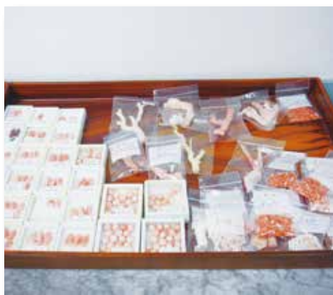
日本寶飾工藝學院 - 珊瑚