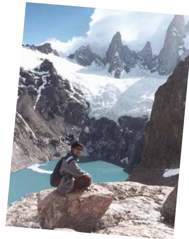
Fitz Roy 讓人不敢置信的山景

面對地圖，你甚至沒有詩頭，更沒有規訓或指定的閱讀方向。更別提那在地圖上看似遺漏、你卻永遠知道「一定存在著什麼」的空白之處。