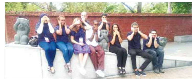
非禮勿視、勿聽、勿言

這趟非凡的臺以交流經驗，不僅見識到以色列基本國情、感受以色列人的特質、進行臺以兩國文化交流之外，宜航更從交流中獲得自我成長與體悟。