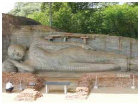
位於東北的 Polonnaruwa，是斯里蘭卡的古城之一，有許多著名古蹟，此為臥佛

但過了幾天，我逐漸適應，口音聽著聽著就懂了，從單詞到句子，每天理解的內容都在逐漸增加；別人的照片看著看著就有了感覺，然後驚喜