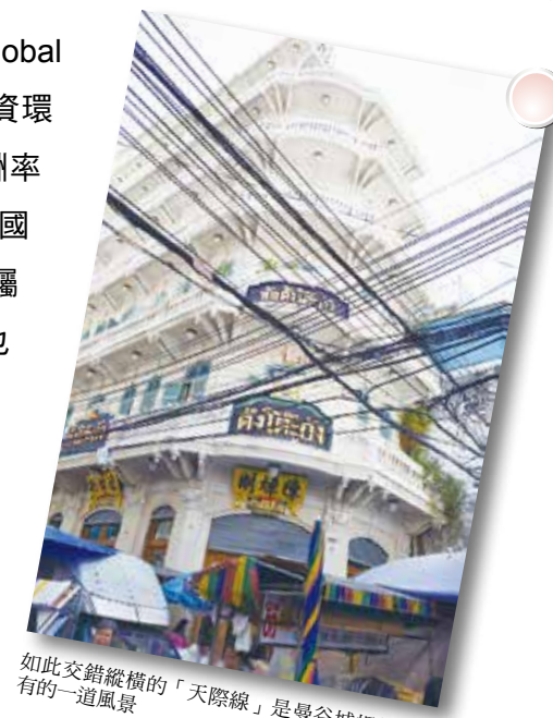
如此交錯縱橫的「天際線」是曼谷城裡特有的一道風景

根據 2015 全球地產指南 (Global Property Guide) 的研究，泰國投資環境被評選為 4 顆星，平均投資報酬率為 5.13%，也因為身為東協的會員國之一，泰國未來發展的潛力受到矚目。但在快速崛起的背後，其實也隱藏著貧富差距的問題，在他們搭乘捷運的過途中，看盡高樓大廈的酒店住宅，也目睹一區又一區的貧民窟，確實的為持續的經濟發展埋下一大隱憂。