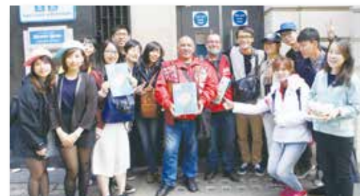
與 TBI 熱情的街頭 vendor 合照

誠摯的邀請您透過這本書籍，與我們一起遨遊歐美社企之旅，並為臺灣埋下社會企業成長茁壯的種子。