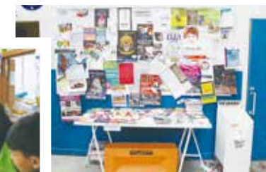
愛丁堡國際藝術節的攤位