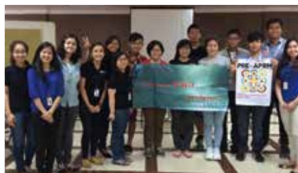
亞太區域醫學生會議會前會模擬 WHO 工作坊