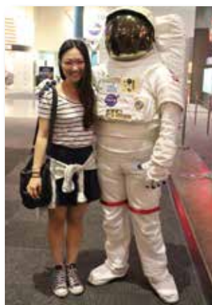
到 NASA 發掘太空的奧秘，幸運地遇見太空人