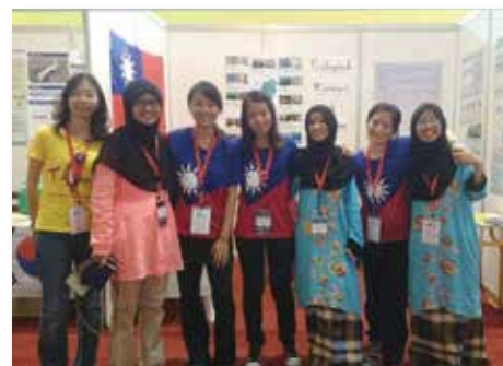
with Malaysian participants