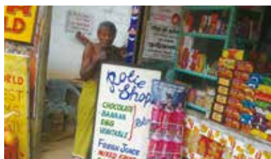
路邊店面，很像雜貨店，門面總是擺滿各種餅乾和飲料