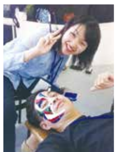
繪製泰國官員臉譜