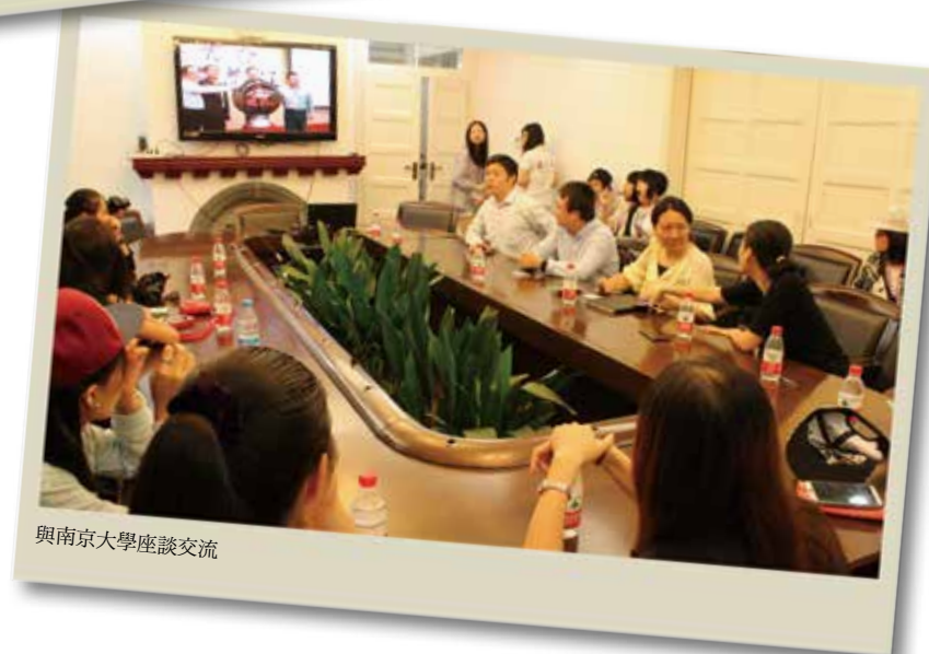
與南京大學座談交流

在活動結束後，一直覺得在過程中，還有很多應該完成的沒有做，還有很多事情可以做到更好，還有很多地方等著我去發掘，還有很多話想對團員訴說，但是活動卻已經結束，沒有足夠的時間，可以一一去完成。不過這次的結束，給大家有時間反思、檢討，給大家有更充裕的準備，給大家有再次相聚的機會。期待第二屆兩岸七校服務學習公益團再次舉行，希望下次見面時，大家會更明確知道自己參加這活動的動機，知道自己想要