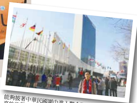
能夠披著中華民國圍巾進入聯合國總部，真的倍覺感動