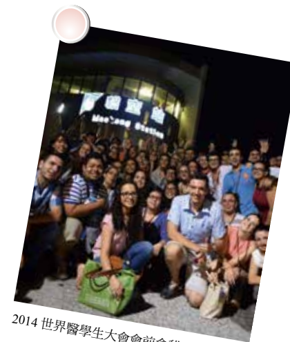
2014 世界醫學生大會會前會貓空文化之旅