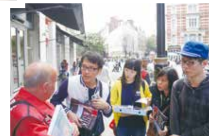
與 TBI 熱情的街頭 vendor 採訪中