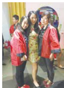
和日本朋友的合影