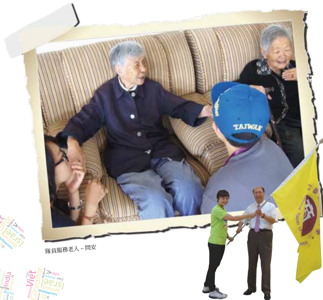
隊員服務老人~問安

影響生命吧！從這個服務機構，正本溯源棄嬰問題，之前大陸的一胎化政策，導致有些父母發現自己生下的不是健康小孩，就把他們遺棄，我相信每個政策都一體兩面有好有壞，只是對於捨棄自己小孩的父母還是叫人心寒。然而，這些機構的一些工作人員年齡都大概在 25 歲左右，正是踏出社會的新鮮人，他們不為揚名，正默默為老人及小孩編織簡單的生活，一則簡單的生活需要這些人無怨無悔的投入，才能發揮巨大的影響力。