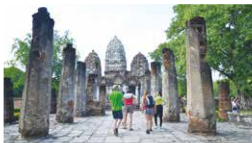
在泰國的第一個首都－Sukhothai 的遺跡裡，平均每 5 個遊客有 3 個是來自法國。

傳統市場也是一個體驗當地文化與生活縮影的好地方，在這裡他們也遇到了這趟旅程中值得一提的肉粽阿嬤，一個偶然他們在一家小餐車前停下，對著一個用竹葉包成三角錐的物體而有熟悉的感覺，阿嬤以泰文介紹著：「bozhong」，也因為這樣展開半小時的對話，肉粽阿嬤是由廣東潮州移民至曼谷的華人，由於潮州話與福建話擁有相同文法及發音，只是語調不同，因此他們就用著福建話及潮州話進行半小時的對話，肉粽阿嬤也非常開心有機會可以使用家鄉話來個人交流，而藉由對話也發現到，泰國華人在 1933 年的軍政府要求華人改泰國姓氏後急速在地化，而許多年輕一代的華人也已經不會說福建話和普通話。