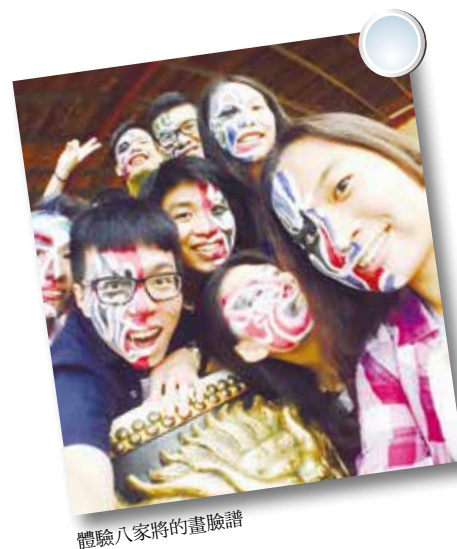
體驗八家將的畫臉譜