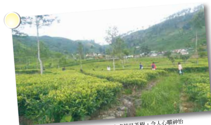
我們在茶園中穿梭、拍照、唱歌，四目之處皆是茶樹，令人心曠神怡

第一次自己出國，無論拎著行李的步伐邁得多堅定，依舊掩飾不了自己對未知的恐懼，40天的日子，我在斯里蘭卡做國際志工。我們的志工內容是拍照、攝影、寫文章，屬於跨文化了解和促進觀光的類型，總共有20個夥伴，出發前我猜想收穫不外乎就是看盡斯里蘭卡的景點、認識不同國家的朋友、英文能力和攝影技巧的提升吧。