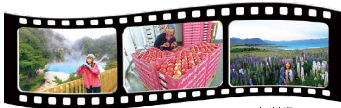
右：地熱公園。 中：我的工作場所。 左：紐西蘭的自然美景。