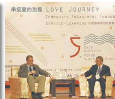
與國外學者的對談