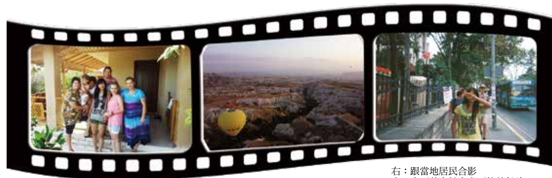
右：跟當地居民合影 中：土耳其卡帕多奇亞的熱氣球 左：與青旅認識的背包客進行城市觀光