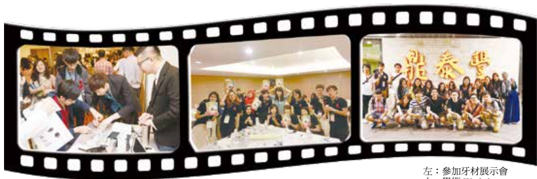
左：參加牙材展示會 中：學術 Workshop 右：臺灣著名小籠包

「See what you can become, become what you can see」這是來自新加坡的 Peter.Tay（鄭星輝）教授在 2014 年於柬埔寨舉辦的 APDSA 中勉勵在場所有與會成員的一句話，期待每個人都能朝著自己的夢想前進，也期待能從每個人的眼神中，看到對於未來有所盼望的熠熠神采，更加期待下一次 APDSA 大會的再度相逢，看見彼此的成長與改變。