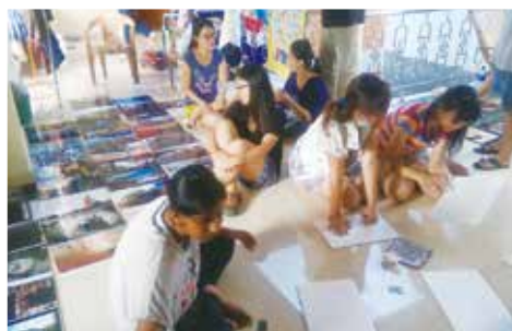
將一張張照片小心地黏上裁切好的保麗龍板

謝謝很多人的幫助，更謝謝當初願意嘗試的自己，我想，在決定踏出舒適圈的剎那，就是我最大的成長吧。