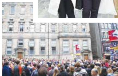
愛丁堡國際藝術節的盛況