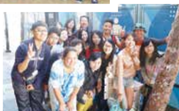
在 Lava Mae 行動沐浴車與志工們合照傾聽他們的服務理念

Café 及 Isidore Electronics Recycling 對於更生人與失學青少年所提供的支援與歸屬感；Downtown Women's Center (DWC) 致力於解決無家可歸婦女的安置問題，進而提供這些婦女就業機會；以及專注於幫助未開發國家的 Samasource 以及大家耳熟能詳的 Toms Shoes 等。