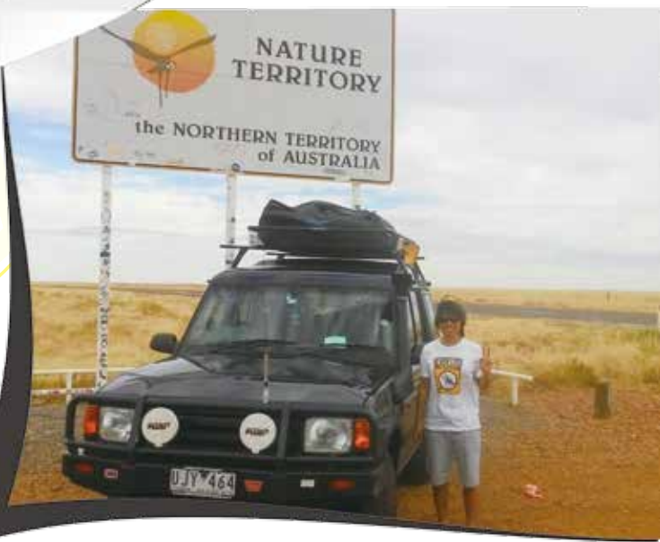
road trip in Darwin

深夜加油站的客群以晚班工人人居多，身穿黃色反光工作服來買能量飲料，大部份是倉促的，有些則會和我閒聊幾句。他們深以自己的工作為榮，比一般人高的薪水，也需要更多的體力與專業。行行出狀元可能是我對這