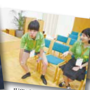
IUCN 透過活潑的互動式簡報讓我們對生物多樣性有更多的瞭解和重視