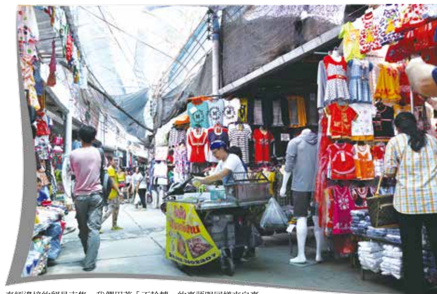
泰緬邊境的貿易市集，我們用著「不輪轉」的臺語跟同樣來自臺灣的阿婆阿姨們，互相問候彼此

1 趟旅行，6 座城市，23 天泰國行腳，40 場深談，給了 3 個大男孩不一樣的成長軌跡，改變你成長軌跡的那場旅行在哪裡呢？