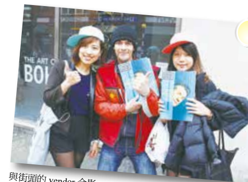
與街頭的 vendor 合影

以真：「第一次踏上英國這迷人國家，切身感受到英國這個文化藝術融入日常生活的國度，無論是城市景觀、商店擺設或是來往的行人都因蘊藏豐富的文化氣息，而讓人深深著迷。」