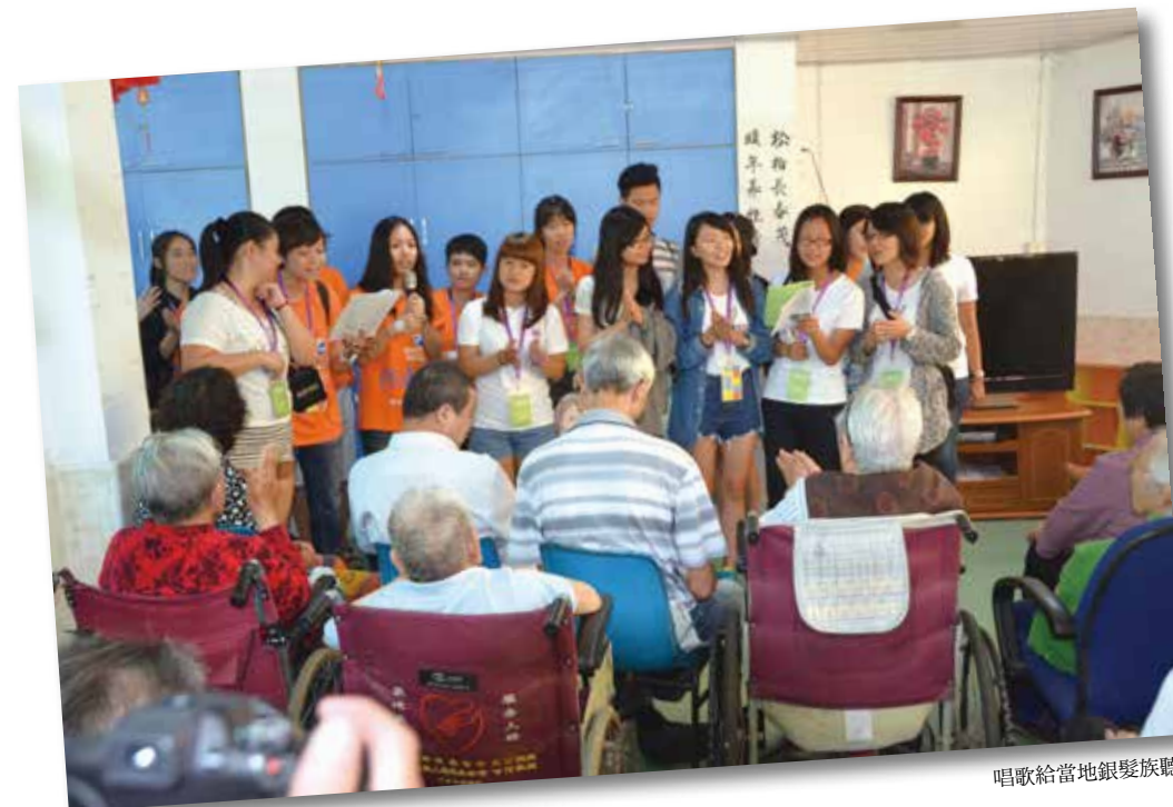
唱歌給當地銀髮族聽