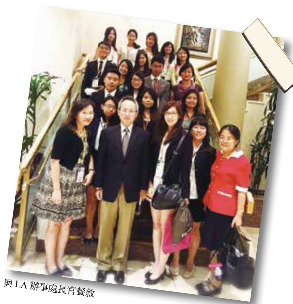
與 LA 辦事處長官餐敘

在美國的街道上充斥著許多的街友，而人們對於街友普遍存在敬而遠之的態度，認為街友是造成環境髒亂、諸多治安問題的