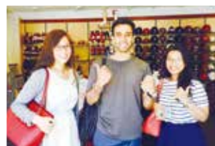
在史丹佛遇見小時代 film maker