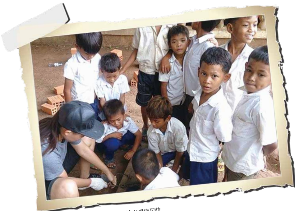
蓋廁所的過程中，學童在下課時間總來圍繞探訪

朋友問：為什麼要當自以為很厲害的國際志工？理由單純：朋友介紹、時間配合、想參與可看到實體效果的志工服務。對，我沒有成熟的國際視野或遠大的夢想，這一切僅僅算是機緣。透過 HOPE worldwide，來到距離金邊四十公里遠的貧村烏棟。金邊到烏棟，紅土取代柏油路、高腳屋取代水泥房、赤裸的孩子兀自坐在路邊泥砂丘上，烈陽下認真玩耍。然後，駛入烏棟，密林與窄泥路迎接我們。在烏棟小學，八百位學童使用四間廁所，其中兩間不堪使用。而我們的任務則是在短時間內建築牢固的新廁所。