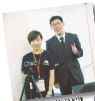
為我們的重要時刻留下紀錄

20天的旅程讓以真體驗到英格蘭與蘇格蘭的點點滴滴，「我永遠無法忘懷在愛丁堡聆聽的經典劇曲，在格拉斯哥感受到的生活與美學結合，以及親眼見證倫敦濃厚的商業氣息。」以真滿載而歸，並希望與大家分享臺灣未來對社會企業及 NGO 發展的關鍵指標，更期許自己未來的生涯能與社會產生連結，讓盈餘回饋社會，為社會服務，讓臺灣變得更美好！