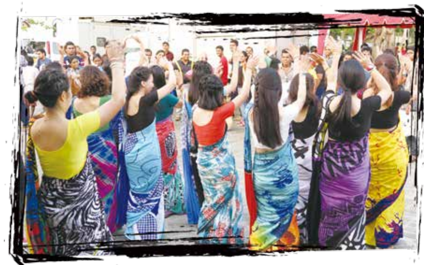
展覽當天，我們在會場前跳舞，吸引目光

因為不想當走馬看花的觀光客，我每天觀察斯里蘭卡和臺灣生活大小事的不同，也讓自己融入當地，斯里蘭卡不如臺灣安逸的環境，所以我學會了隨遇而安，沒有熱水，那就每晚吸口氣洗冷水澡，凹凸不平的路面和橫衝直撞的交通工具，晃久了也習慣了，找不到路就問路人，身在他鄉除了信任還是信任，面對未知或許會恐懼，但想想自己這輩子也許只有這次機會，就有不顧一切嘗試的勇氣。