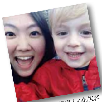
小男孩天真無邪溫暖人心的笑容