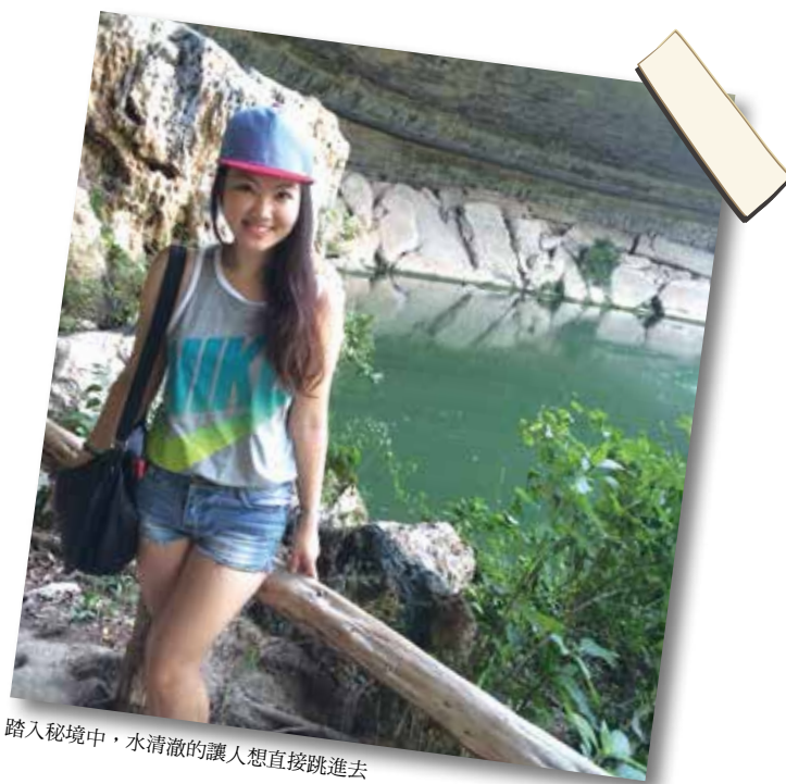
踏入秘境中，水清澈的讓人想直接跳進去

式家常菜和大家 分享，一起 吃飯小酌談天， 笑著因文化差 異產生的趣事， 彼此分享自己 國家的風情民 俗及景色，這種 平淡輕鬆的交流 是至今最令我 想念的感動。 工作之餘，我也 把握時間到各 個城市發現不