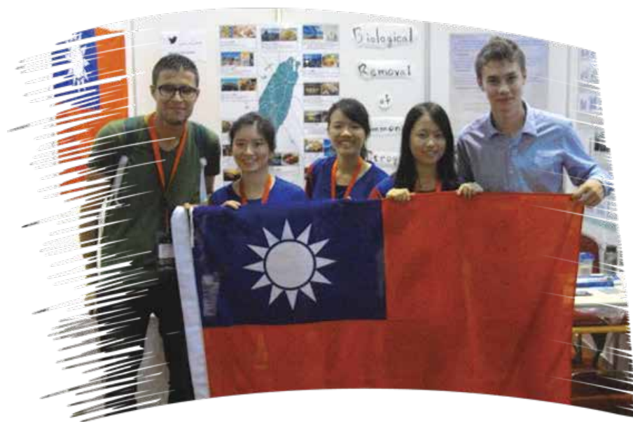
with Belgian participants

盛夏在枝頭喧嚷，豔陽灑了我滿臉紅暈，天氣微悶。我眯眼望著遠方山脈，一陣風輕柔拂過，吹開回憶之門，也吹揚起嘴角。一年前的此時，在異國的漫天風沙中，我們相遇，執手寫下燦爛曾經，然後別離。