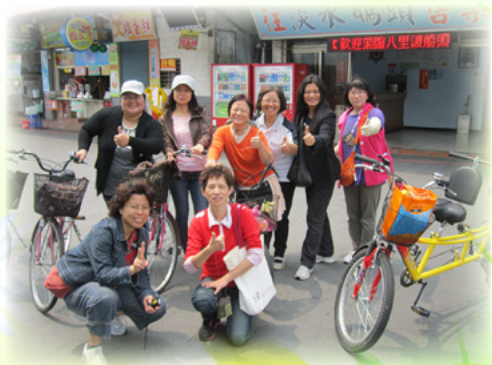
張女士帶領志工團員踏青旅遊

「服務領導」與「終身學習」是張女士擔任志工團團長的信念。進入雙蓮志工團後，除了導護工作，張女士參與多項志工活動，包括擔任圖書志工，協助小朋友借還書；擔任故事志工，晨光時間帶領低年級孩子閱讀；參與園藝工作，栽種多樣葉菜，提供自然領域教師教學使用……，張女士的無私奉獻有目共睹，因此民國98年時，順利當選雙蓮志工團團長。秉持著「服務領