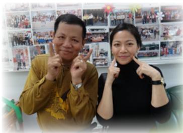
張張相片都是校史的串連