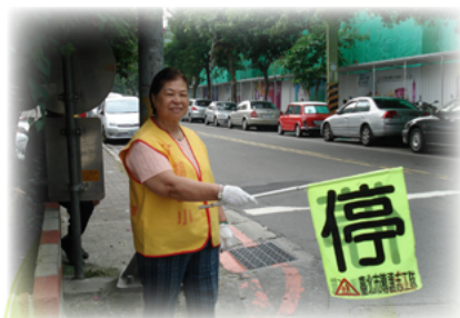
開心守護孩子的平安