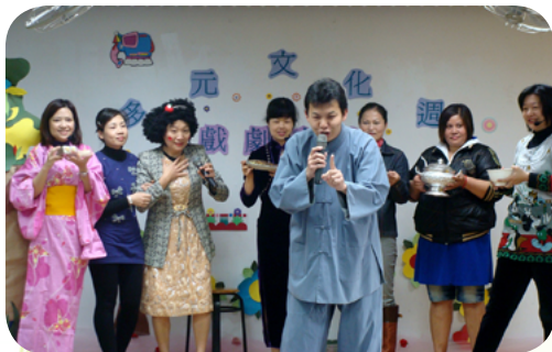
多元文化週戲劇展粉墨登場

與外界訊息溝通之橋梁，但透過會長及多方努力，家長仍無法釋懷，揚言若得不到報紙記者的道歉，甚者將有非常之舉措，諸如要讓小孩消失、成為小天使…等言談，