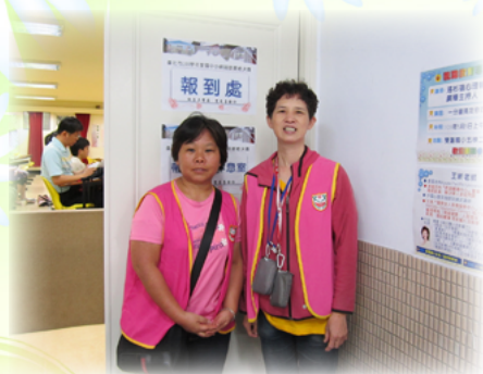
張女士擔任親職講座服務人員