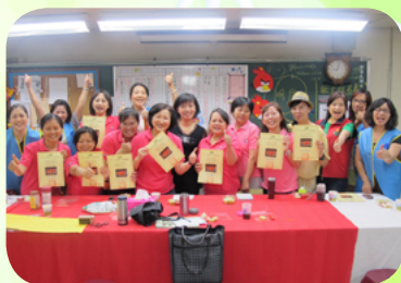
頒證研華故事志工團感謝狀