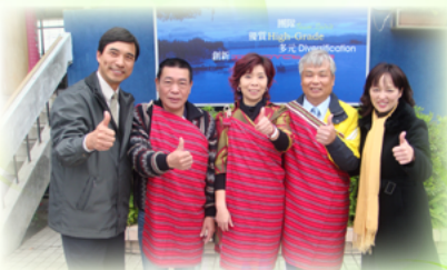
校際交流親善大使團