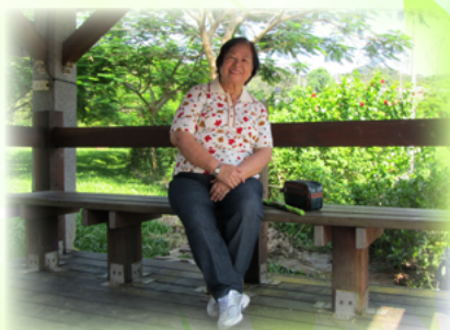
早晨散步後在公園休息