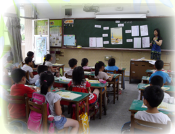
指導學生如何繪製蛛網圖