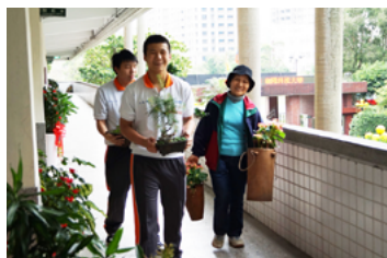
(圖說：帶領學生一起愛校服務。)