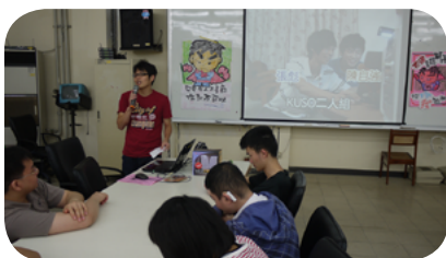
進行性別平等宣導活動

啟明學校的學生來自全省各地，這些離家北上就學的孩子們平日都在學校住宿，假日才返家，有些住高雄、臺東、花蓮遠道而來的學生，更是連續假日才有機會回家一趟，沒有家人