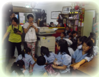
帶學生拜訪忠順里里長