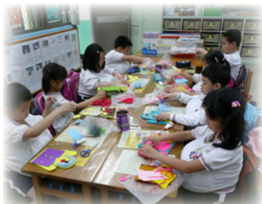
挺著大肚子做手偶真辛苦哇！