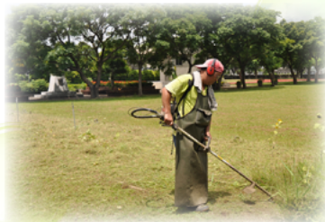
每月定期除草工作