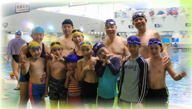
與特教班學生及志工合影

對翁會長而言，他始終認為家長會應該是盡量扮演協助學校的角色，而不是一直扮演監督學校的角色，更不是一個反對學校的角色。雖然現今許多家長的態度與孩子的行為，讓老師在親、師、生溝通時深感困擾，但他認為很多時候，家長會只要能適時扮演協助溝通的橋樑，相信可以成為改變親、師、生溝通時最可貴的力量。