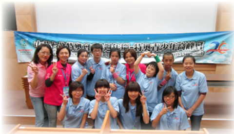
積極帶學生參與活動的靜攻組長

大型輪椅巴士、八部中型輪椅巴士服務學生，如何安排路線將所有學生平安的接送上下學，是每個學期最頭痛的問題，除了要考量站點設置及路線的順暢度，更要設身處地的為行走不便、乘坐輪椅的學生考量便利性的問題，繁複的內容牽一髮動全身。靜攻組長總是面帶微笑，溫和有禮的面對家長的詢問，熱誠的處理各項交通問題。