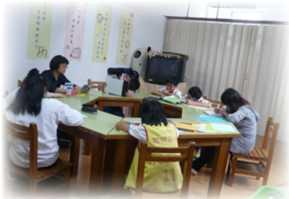
小團體活動：寫給自己未來的一封信

單親小團體成員來自不同的原生家庭，當家庭功能不彰時，每位孩子都有很多的「稜稜角角」；我看你不順眼，你看我更「普普」，拗的拗、衝的衝、發飆是在所難免的，想讓彼此陌生的成員變成友好的合作關係，實在不是一件容易的事。孩子的心裏或多或少都有一些擔心、害怕與緊張不安，尤其面對陌生的環境，對彼此更是一種考驗與挑戰。