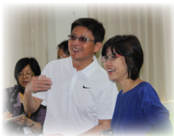
與新加坡教師暢談兩國教育差異