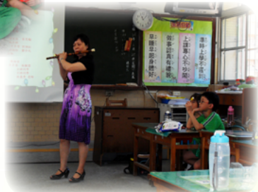
惜別會時演奏中國笛和學生同歡樂