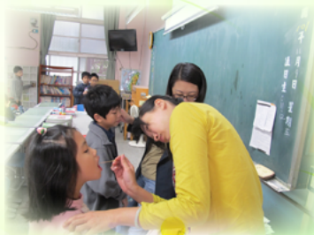
潔牙志工們認真的在班上 檢查牙菌斑