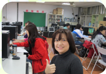
舉辦家長成長電腦研習班