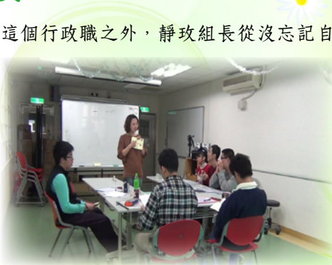
教導學生重要技能「如何記帳」

除了身兼生教組長這個行政職之外，靜攻組長從沒忘記自己是個特教老師，喜歡與學生互動，更沒忘記自己所鍾愛的教學。舉凡班聯會、交通服務隊、宣導活動都可看到靜攻組長帶領學生融入生教組的宣導議題。文山特教多是智能障礙伴隨多種障礙的學生，基於安全考量學生以往大多被安排在固定的模式下生活，小至吃什麼、用什麼，大至學什麼、未來到哪個機構、從事哪個工作，幾乎都已被師長決定好、規畫好，鮮少有機會自行出主意、自己決定怎麼過生活，有鑑於學生自我覺察的重要性，希望能開發學生未來的潛能，誘發學生對自我學習的責任感進而提高生活品質，靜攻組長和幾位同事向臺北市教師研習中心申請了102年度教育專題研究案-「自我決策教學方案對特教學校高職部學生參與個別化教育計劃之成效研究」，靜攻組長身兼研究案的