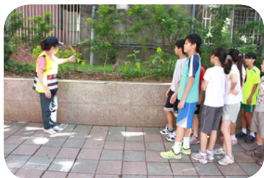
天使心守護情愛福星

萬華區聚集相當數量的流浪漢，學校四周自然無法完全倖免，加以福星國小臨中華路一採「都市櫥窗」的設計理念，校園和廣大紅磚道間