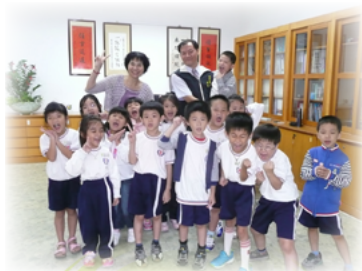
認識您真好！我們和校長一起合影

翻閱妳的青春 是西門成長的歷程 從大單元到九年一貫 妳用三十年的歲月傳承 桃李三千 有的綠樹成蔭 有的剛剛啟蒙 勺勺口口學拼 橫豎撇捺導引 滑過指尖的粉筆 灰飛成丘 批過本子的墨水 匯聚成流