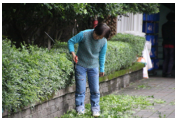
（圖說：把整理校園花木當成運動，一做就超過十年。）