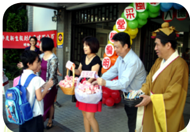
開學日發給學生智慧糖活動

俗話說「巧婦難為無米之炊」，家長會運作除了需要熱心的家長、志工之投入，更需資金以支應整個家長會會務之推動，雖然牛會長個人總是身先士卒、慷慨解囊，但因小班小校，募集家長會會務資金，總是捉襟見肘，因此會長發揮巧思號召愛心家長們展開各項義賣活動，例如 99 學年度明倫 47 週年校慶