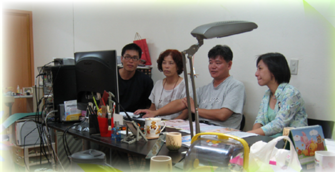
凌晨三點還在為民俗團公演的手冊校稿

椿樺會長也主動提供教育界及社區最新活動與訊息，並視學校需要積極引介資源，為學習弱勢學生引介課輔志工資源，協助學生提高學習興趣，提升學業成績。