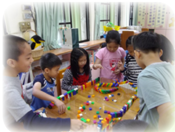
為孩子營造快樂的學習環境