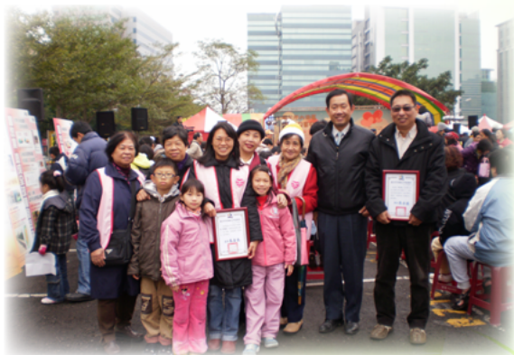
參與內湖區安全守護活動