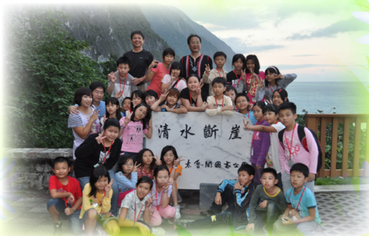
熱心參與學生各項活動（校際交流）