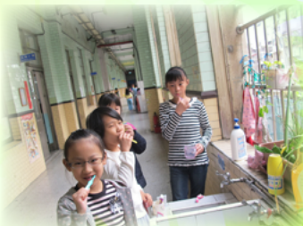
孩子們都開心的潔牙喔！