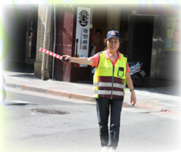
爭取設時相 四方八達通