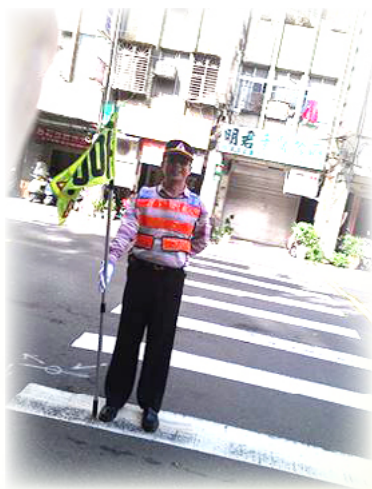
每天辛勤的擔任導護志工