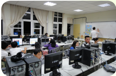
家齊主任於成教班電腦上課情形

家齊主任總是這樣告訴成人基本教育研習班的同學們：「只要你們有心學習，我就會繼續教下去，這是我和你們之間的終生約定，所以，你們也要堅持下去，這會是一場終身學習的終生約定。」