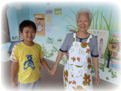
小朋友散步後不再哭泣露出笑容