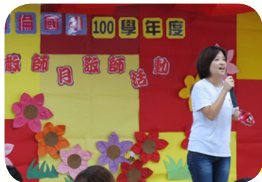
辦理教師節敬師活動