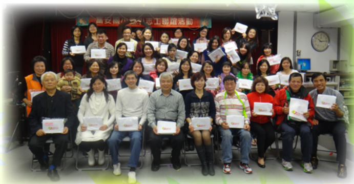
奉獻心志 工情故鄉愛

「美麗社子島 勝利在富安」是美勝大哥的心語，他說：「故鄉社子島是很美的地方，它有國際級的景觀。而島上的富安國小更是讓我驕傲，校長優秀、主任用心、老師努力，團隊非常的合作，這是少有的組合。此時此刻在這裡奉獻及受教育，都是有福氣的人！」