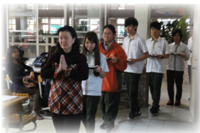
學校日 - 奉茶活動

本學年度學校日時，春芳老師思考著如何進行學校日？難道家長們在工作繁忙之餘到校參加學校日，只是聽一大堆政令宣導、班級規定、老師抱怨嗎？春芳老師想讓班上的家長到校有不一樣的收穫，於是構思舉行學生「奉茶活動」：當天參加的家長由孩子跪在父母親面