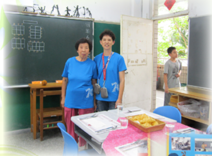
張女士帶領學生進行 西餐禮儀