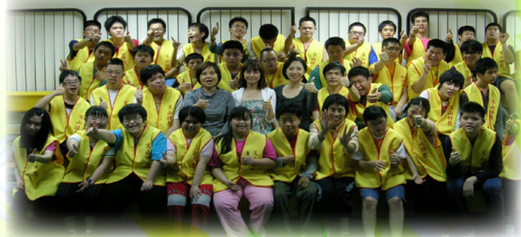
靜攻組長訓練的校內第一批交通服務隊

等。對身心障礙學生來說，上下學的交通方式、學校交通車能否到家附近接送，常是轉換教育階段時家長最後抉擇就讀哪所學校的關鍵因素，靜攻組長清楚家長們的擔憂，每年新生參訪、新生報到的場合，都親自站到第一線向家長說明，講解路線安排及交通車服務內容、交通費申請方式，希望家長能放心讓學生上學，親切詳細的說明，好幾回都因此啞了好幾天的聲音。由於學生來自四面八方，交通車接送範圍包含臺北市南區六大行政區，截至目前共有五部