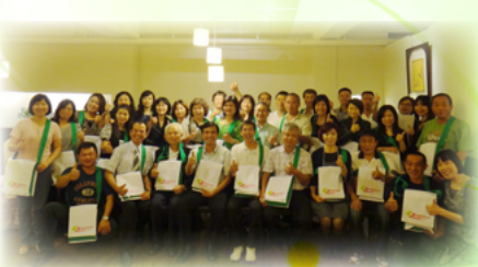
協助募集資源成就辦學的理想