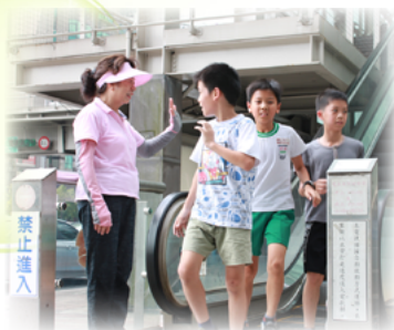
有了護童天橋小福星平安有保障