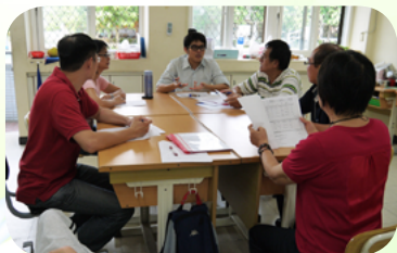
與老師家長共同討論學生特教服務內容

腳踏實地，待人親切溫馨，兼具主動助人的高度服務熱忱，樂觀且積極的在工作上付出，為了孩子所做的一件件看似平凡的事，都在孩子的心中種下溫暖與愛，更在許多關鍵時刻適時的拉學生及老師一把。這些事情既不光鮮亮麗，也許微不足道，但卻是如此的真實，實在的堆砌出教育工作者的價值。