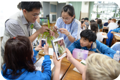
以蝴蝶為主題，與英國學生進行交流