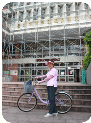
巡視學校周邊安全