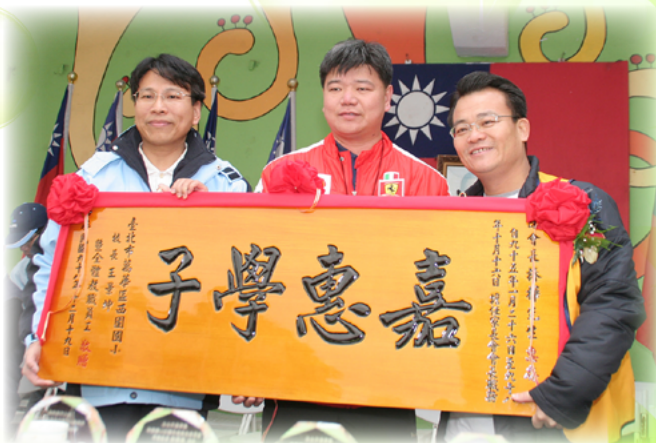
陳會長，謝謝您嘉惠萬華學子

行秘書。現任臺北市國小學生家長會聯合會第 11 屆資訊顧問、臺北市國中學生家長會聯合會第 11 屆理事、臺北市高中學生家長會聯合會第 11 屆副秘書長，一路走來始終如一，無怨無悔地服務學生及家長，每一次會議、活動都可以看到他的身影，並以相機記錄每一個珍貴畫面，還上傳網路分享，讓更多人知道家長聯合會為教育所付出的點點滴滴，他的付出，令人感動！