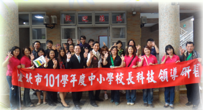
臺北市國中小校長科技領導研習

美勝顧問不但請專人製作兩倍全開大小的相片及畫框，送給學校佈置及留念，還加洗相片送給全校師生及當日蒞校的家長和貴賓。每個收到禮物的人，除了感動還是感動。除此之外，當老師帶領學生寫卡片表達感謝之意時，美勝顧問謙和接受後，還特別準備禮物鼓勵學生，讓感恩教育在富安有最美的演繹。美勝顧問「甘願做 歡喜受」的喜捨情懷，真是教育志工的優質典範。