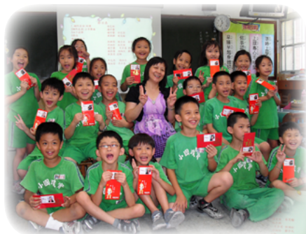
惜別會送給每位小朋友祝福卡 和紅包

林老師以「能作育英才、能成為孩子的貴人」為最高目標，每當接任新班級時，她總會打電話給新接觸的家長，提前了解每一位學生的需求以及每一位家長的期望；也常運用「比馬龍