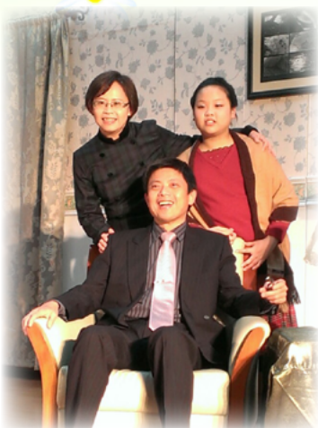
會長及夫人與參與學生戲劇演出 的小女兒合影

因為我們從翁會長身上看的典範與榜樣，這些年來他猶如一位校長兼志工般的在學校默默奉獻付出，從一早的導護時間開始協助導護工作，接著一連串的開會與會務工作，中午不得閒還協助本校訓練籃球球隊，每週四下午更以