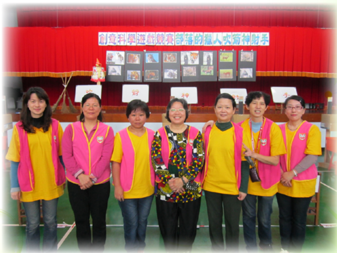
張女士與志工團姐妹合影