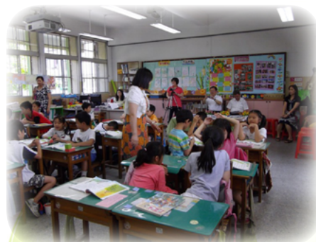
上課時巡視小組討論情形