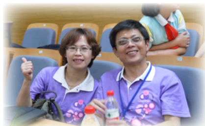
會長及夫人於杭州校際交流勝利國小中 合影