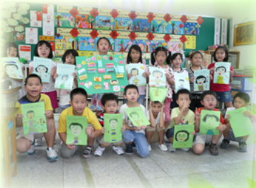
這是要送給老師的畫像和卡片