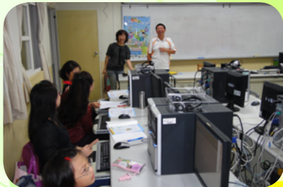
梁校長主持成教班電腦課開學典禮