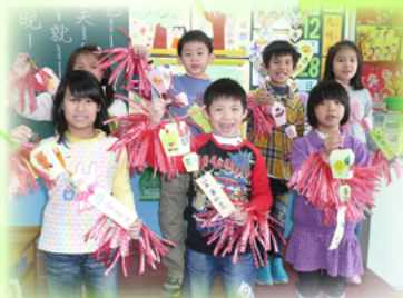
祝福家人平安健康的祈福天燈