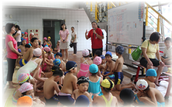
辦理水上趣味活動