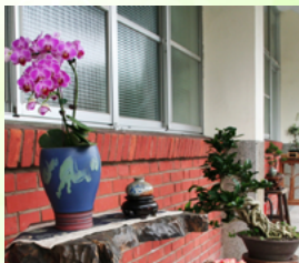
(圖說：典雅的會場佈置，讓貴賓留下好印象。)