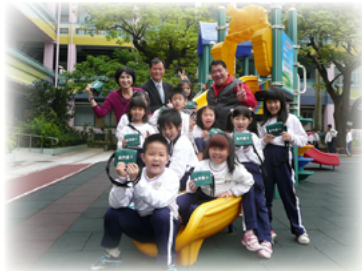
即使是男生也能體驗當媽媽的辛勞