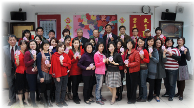
陪同家長志工接受康局長宗虎的勉勵

故鄉情、顧鄉愛，美勝顧問無私的奉獻及教育的大愛，增添富安人無比的幸福與光彩。僅以這首詩表達我們深深的敬意。感謝您～美勝顧問！