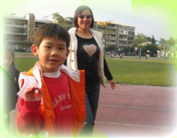
早上和小朋友一起晨跑