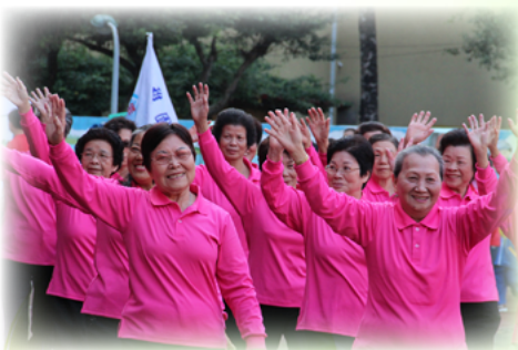
阿嬤們運動會繞場時展現自信風采

新和國小從民國91年開始辦理成人教育，提供失學民眾就學的機會。當原先擔任成人教育班的老師因故無法再繼續擔任教學工作時，教學組長馬上想起了在新和服務期間就認真教學、總是為孩子的學習