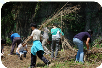
帶領學生辛勤整理生態園區

區的原始風貌，為的是留住蝴蝶幼蟲的食草與成蟲吸食的蜜源植物；也因為擔心工友整理校園時，不小心將植物砍伐掉，所以他常自許為編制外的校工，在課餘的時間換上工作服，拿著各式工具自己動手整理這塊園地；他也跑遍各大花市、農場、甚至到野外採集，為的是豐富校園的植栽；更讓師生感動的是，除了自己去上課取得台灣蝴蝶保育學會解說員資格，充實自己的專業知識外，前後花了兩、三年的時間，持續進行三民校園裡蝴蝶種類調查，更自掏腰包印製賞蝶手冊，讓三民的美更具體地呈現在眾人面前。