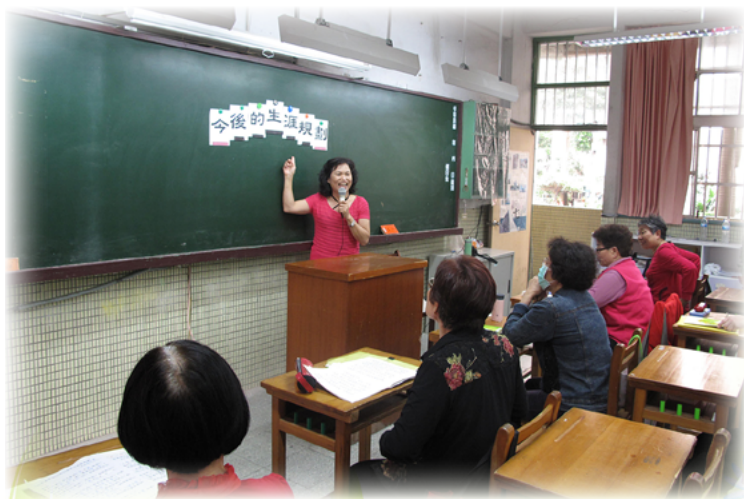
多元的活動建立阿嬤們的信心