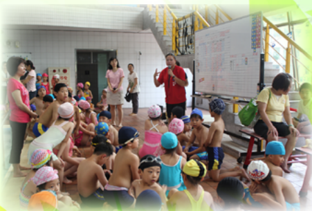
辦理水上趣味活動