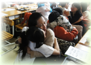
學校日 - 奉茶活動

前奉上一杯茶，同時也旁白：希望父母親喝三口好茶：第一口好茶「心想好事—多祝福孩子」；第二口好茶「口說好話—多讚美孩子」；第三口好茶「身行好事—做孩子的好榜樣」。接下來孩子們餵父母親三口茶食：第一口茶食「小番茄—番茄充滿維他命 C—希望父母每天笑嘻嘻」；第二口茶食「棉花糖—希望父母每天甜蜜蜜」；第三口茶食「小蛋糕—希望父母年壽高增」。最後春芳老師要求親子擁抱對方、感受對方的愛，此時看到許多父母熱淚盈眶、緊抱著孩子。孩子高中了，有多久沒有抱過孩子了？有幾位父母親分享心中的感動，這才是春芳老師想要的學校日！