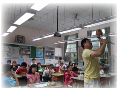
張團長認真的在班上指導貝氏刷牙法