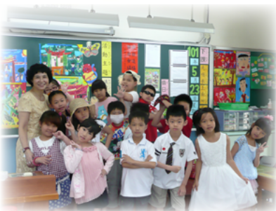
流行最前線 - 我的造型最酷

原來『老大』的爸爸並不是黑道，黑道是孩子用來武裝自己的說詞，接下來的日子，『老大』的行為也沒有因為秀津老師這一位『大老』而表現出循規蹈矩，我們常常看見秀津老師約『老大』的媽媽在她上班之前到教室晤談，即使『老大』的爸媽在晚上十一點多來電，秀津老師仍不改教育熱忱用專業和愛與家長在電話中溝通晤談，解決家長教育上的困難。為了矯正孩子偷竊的行為，她找了行政相關人員、安親班老師，和大家集思廣益，提出輔導的策略，只要是對孩子有一點點幫助都不會放棄。