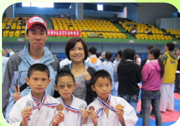
隨隊鼓勵空手道參賽選手