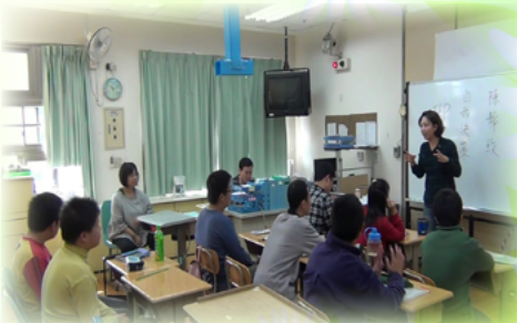
靜攻組長為學生上課專注的神情