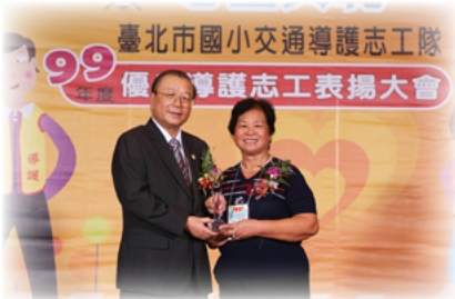
接受臺北市優良導護志工表揚

天候的挑戰，所以招募比較困難。即便當上導護志工，仍可能因為有了工作，而不得不中斷執勤，或是因為孩子畢業、轉學等因素而離開，還有些志工則因為轉換跑道擔任別種志工而告別導護的行列，所以導護志工時有短缺。因