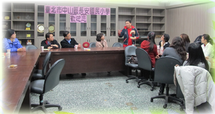
張團長在潔牙志工大會講解指導潔牙的技巧