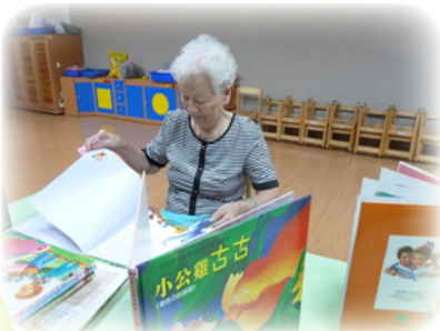
把書擦得乾乾淨淨才不會有細菌