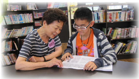
賴老師熱心促成讀報小天使活動

當新和國小體表會邀請成人班一起參加開幕式的繞場活動，賴老師鼓勵阿嬤們：「學校會邀請我們成人班，就是因為感動於我們大家活到老、學到老的精神，我們要當小學部孫子們的榜樣，讓他們知道要好好珍惜學習的機會，更要像我們一樣、一輩子都要不斷學習！」在賴老師的鼓勵下，成人班的老人囡仔學生還特地做了亮麗的班服，在體育表演會當天陽光燦爛的操場上，阿嬤精神抖擻的完成繞場，獲得全校最熱烈的掌聲，我也看到了他們眼中閃耀的熠熠光采。