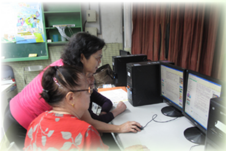
賴老師耐心的教導如何使用電腦

子很少跟老人家相處、互動的機會也不多，藉由閱讀報紙這個媒介拉近祖孫之間的距離，所以她非常支持這個活動，也促成一樁美事。