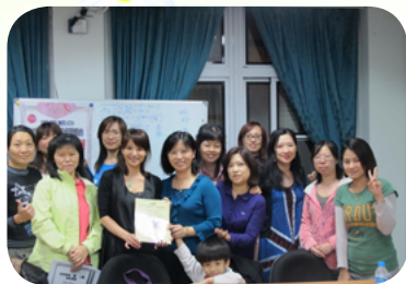
舉辦家長成長班專題講座

工作行列，每週一次利用晨光時間到各班級說故事給小朋友聽，並結合品德、環保、反毒、反霸凌、性別平等教育……等議題，以寓教於樂的方式協助學校推動多元教育宣導，培養學生帶著走的能力；於擔任會長期間並引進研華文教 ACT100 故事志工訓練，除了以身作則參加培訓，更鼓勵明倫的家長踴躍加入專業訓練課程，除了提升自我給自己孩子說故事的能力，更能造福眾多學生，每每從本校說故事志工團結合節慶所推出的年度大戲展演中，呈現給全體親、師、生的歡樂與驚喜，體會出所謂「幼吾幼以及人之幼」的高度情操之展現。