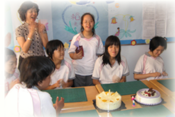
班上的慶生活動凝聚感情