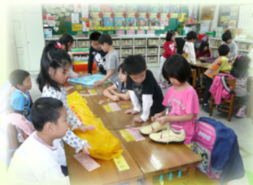
做家事我最行 - 生活闖關必勝