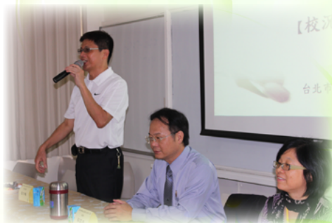
在學校公開場合中更是辯才無礙