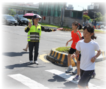
亮黃燈了快步通過中華路喔

寧南路口設置「時相」，方便使用此路口的學生和家長，無須兩段式轉進，通學時段，四方位直接交叉穿越即可。有了里長奶奶的體貼，用路人路權和安全保障更為提升了！