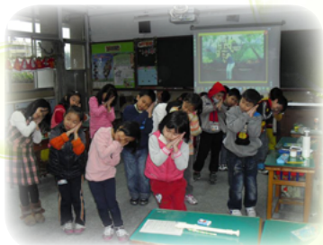
常舉辦才藝表演會培養孩子的 自信心