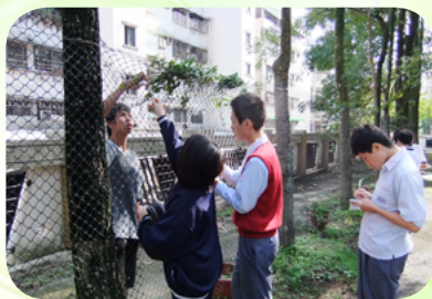
收集各類相關蝴蝶食草植物種子

在學校後庭緊鄰公館山邊的一塊園地，宗憲老師一步步將它規劃為蝴蝶生態專區，在會議上他力排眾議，懇請校方保留園