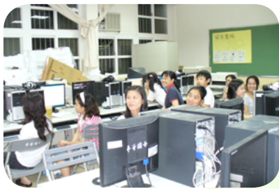
成教班學員上起電腦課來興趣盎然

的生活與孩子們的成長記錄分享給在遠方家鄉的親朋好友，也會使用製作簡單的文書，現在更是在學習如何使用影像處理軟體美化自己拍攝的生活照片，為自己的生活增添許多色彩。