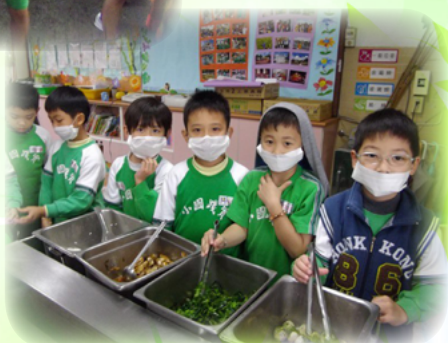
讓孩子輪流當餐車長學習為人服務 的精神