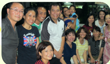
舉辦親師聯誼烤肉活動