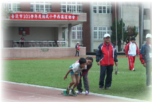
賽前指導與協助選手調整步伐