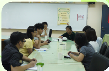
邀集醫師共同討論情緒困擾學生之處遇