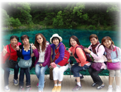
和好友一起旅遊是最宜人的充電！

『老大』就在不斷闖禍和秀津老師不斷的行為改變、晤談、輔導中過了一年，但就在即將升上二年級前，『老大』在操場推了另一個孩子，造成對方臉頰嚴重擦傷還植上了人工皮，秀津老師面對學生的不斷闖禍，沒有氣餒，仍用全心輔導，甚至多次冒著被家長不諒解的辛苦，秉著愛心和專業，苦口婆心的和『老大』的家長溝通，建議專業醫生的介入協助。終於，家長接受了，求助專業醫生找出因幼時的創傷而導致一些偏差行為的原因，以及矯治的專業建議，秀津老師興奮的說：努力了