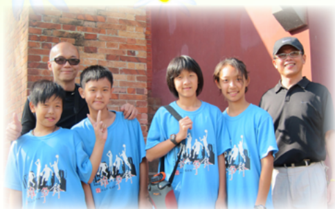
翁會長喜歡陪伴孩子一起成長

回顧翁會長十幾年來的奉獻教育，雖非教育職場人員，但卻以恢宏的氣度，熱忱的心量，創造了最美麗動人的教育故事，引領開創松山國小家長會的新格局。值此杏壇芬芳錄推薦之際，我們希望藉由分享這些教育有愛的小故事，期勉在教育現場的老師與家長，傾注更多的熱情與活力，用心改變教育，讓每位孩子都能找到屬於自己的一片新天地。