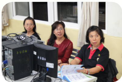
成教班學員全神貫注聽老師上課

現今平等國小的成人基本教育研習班已成為新移民女性、學校家長與社區人士彼此分享生活點滴的平台，每每到了期末最後一堂課，同學們總是使出絕活，帶著自己的拿手好菜來與大家一起分享，此時，新移民女性們的家鄉菜便成為席間最搶手的食物，大家對於異國美食讚不絕口，大大地增加新移民女性的自信心。