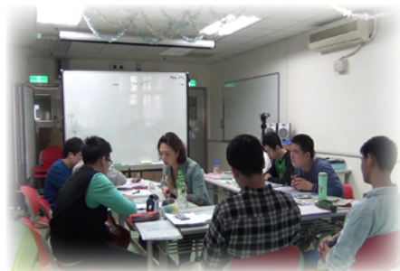
靜攻組長指導學生進行自我決策課程

教師助理們說，我們是比服務業更服務業的超級服務業，在站點設置時要秉持「將心比心」的精神，設身處地考量身障學生上下車的方便性及家長接送時的困難度，讓學校交通車業務順利運轉。靜攻組長說，對身障學生來說每天能