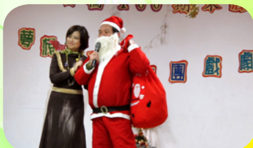
辦理故事志工團年度戲劇活動