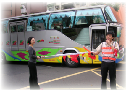
正在執勤的靜玫組長