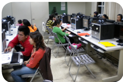
成教班學員相互討論學習電腦操作