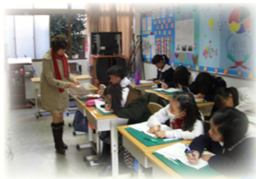
因材施教，個別教導學生