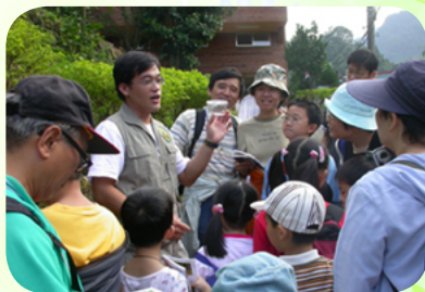
協助台灣蝴蝶保育學會帶隊解說