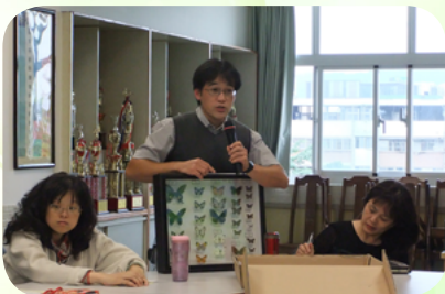
擔任校內生態教育種子教師講座