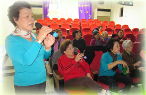
最受歡迎的歌唱課

● 教室裡阿嬤連聲驚呼：「這個書的圖好漂亮ㄟ！」「老師…我們沒有看過有這麼多漂亮圖畫的書ㄟ！」賴老師認為用在孩子身上的繪本閱