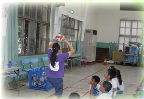
體育課 - 排球教學