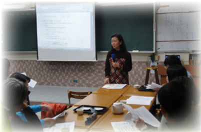
學校日 - 奉茶活動