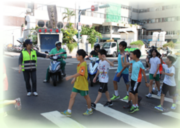
協助小福星通過西寧南路口

電梯、電扶梯及階梯的人行景觀陸橋—護童天橋，在各界翹首期待下正式啟用。佇立創新設計且緬懷過往的天橋往北望，視野意外的開闊，所有福星人以這個路口為起點，80米寬的林蔭大道就在身後展開，象徵著有了里長奶奶呵護，所有福星成員不僅安全無虞，更將全心向前進，邁向自我實現的光明未來。