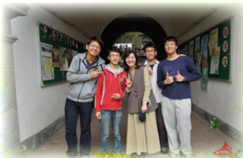
儷慧老師常協助校友重考上心中的理想科系

叛逆又憤世嫉俗，始終和人保持距離，只有打球時才能看到他的笑容，生活常規是令人頭痛的，幾次約談，總是冷漠以對，防衛性極強。和家長聯絡知道安安出生於破碎家庭，母