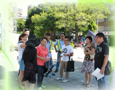
與民代和各單位會勘校門前動線