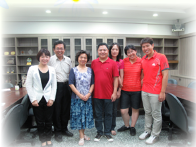
張團長的真性情，感動家長及老師

孩子們聽完之後，許多孩子都自動自發地向張團長說對不起，平時就感性的他，也忍住眼淚與內心的激動，不斷鼓勵孩子，並且再重新做一次潔牙指導，從此這群孩子也乖乖地聽張團長的話，用心的學習潔牙方法。