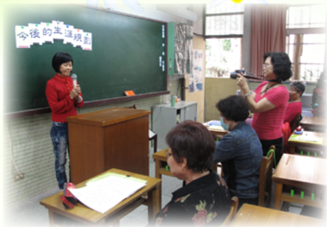
賴老師認真的幫學員拍照記錄