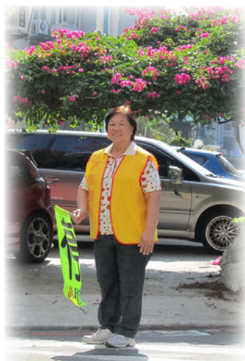
快樂執勤，不知老之將至

笑著說：「你很愛站導護哦！」她笑著說：「對啊！看著孩子平安過馬路，是我最快樂的事。」真是可愛可敬的好奶奶，大湖的孩子真是有福氣啊！。