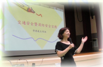
靜玫組長進行生動有趣的宣教