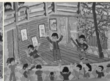
學生校園寫生作品—迎曦廣場