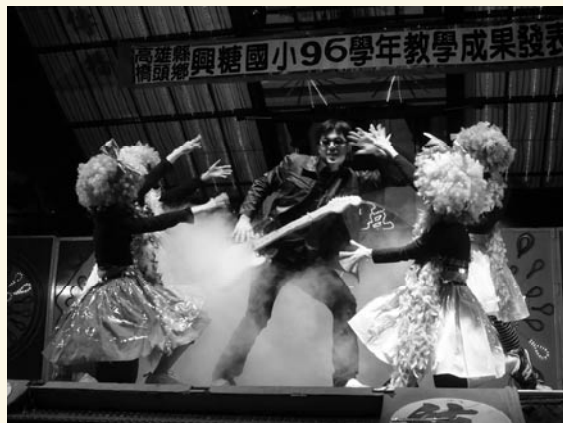
年度教學成果發表會