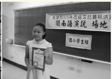
全縣鄉土演說第一名佳績