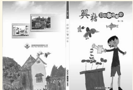
出版日記繪本教學專刊