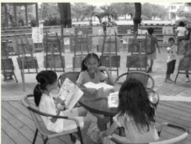
迎曦廣場多元功能展現