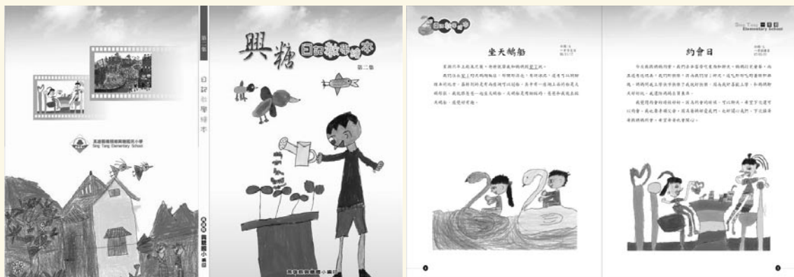
日記繪本教學專刊