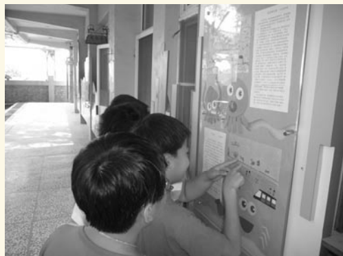
整合佈告與展示功能的日記教學步道