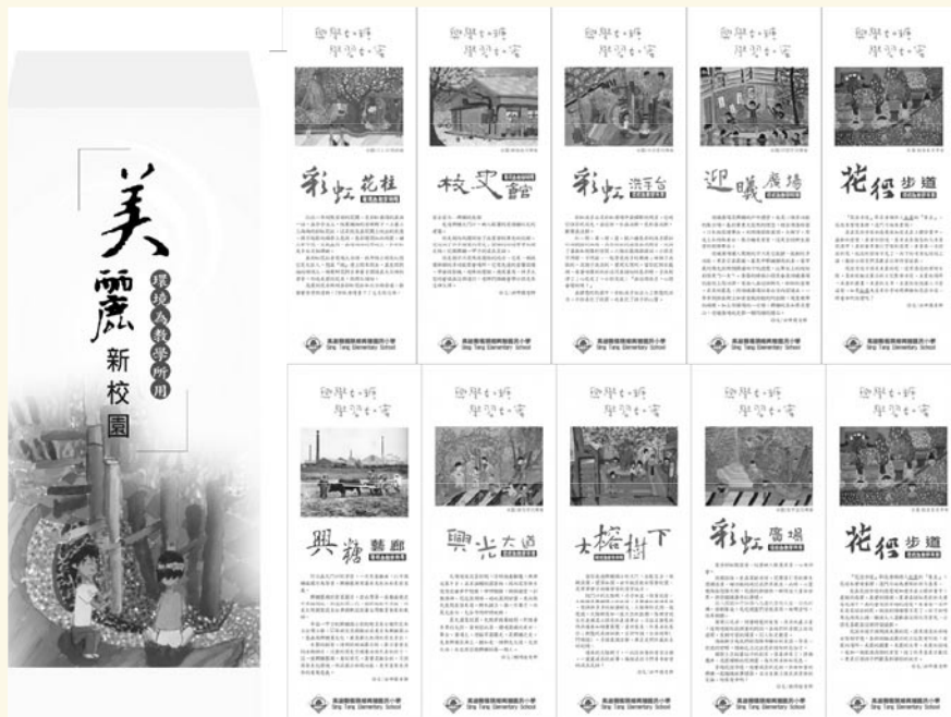
學校特色課程成果—整合繪畫、閱讀、寫作、解說