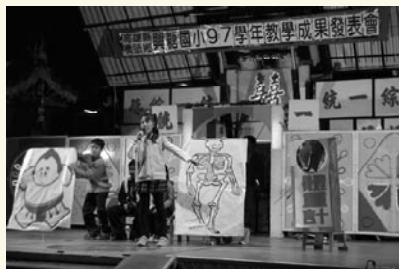
年度教學成果發表晚會