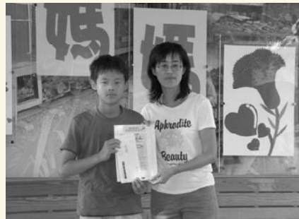
表揚參加校外投稿學生