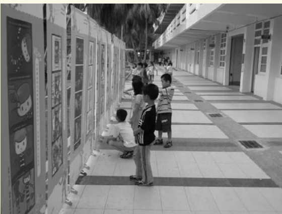
以色彩意象造景的彩虹教室及彩虹廣場