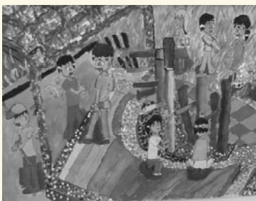
學生校園寫生作品—彩虹洗手台

誰？在哪裡？做什麼？」的句型結構，導引學生在構圖歷程中具備「畫中有詩、詩中有畫」的構圖規劃能力，啟發學生將畫面情境彩繪和畫面情境文字描寫相互轉譯的能力。