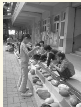
以色彩意象造景的花徑步道