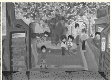
學生校園寫生作品—榕樹下