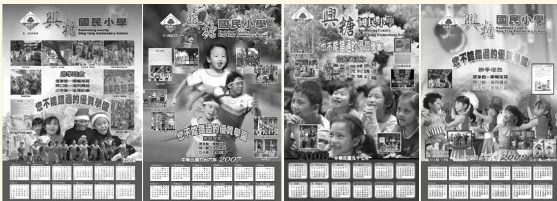
以學校教育理念及創意課程活動設計的年曆