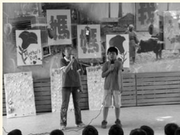
週三晨光時間勤訓練

日記改寫成劇本，生活化、趣味化的演活劇本的角色和生活故事。培養學生坐能寫、站能說、上台能自然表演、流利講述的生活能力。