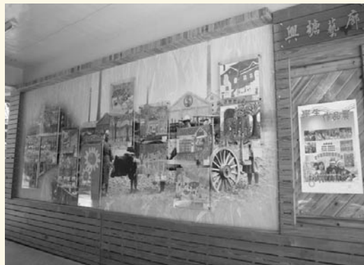
以糖業文化造景設計而成的多功能興糖藝廊