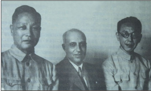
民國30年，攝於重慶，印度政治領袖尼赫魯訪華(中)；右為曾虛白先生，左為董顯光博士。

能一展抱負，此時曾先生結識了董顯光，由於志氣相投，兩人迅即結為亦師亦友的莫逆知交，成為長期合作打拼的伙伴（自傳，頁70-71；陳新萌，1984，頁226）。