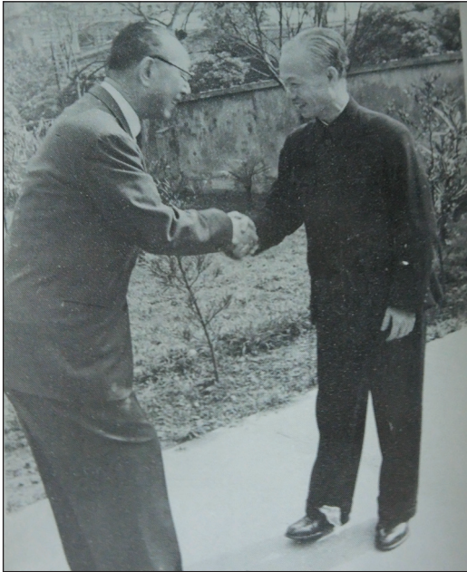
民國39年曾虛白先生(左)迎陳誠行政院長訪中央通訊社。