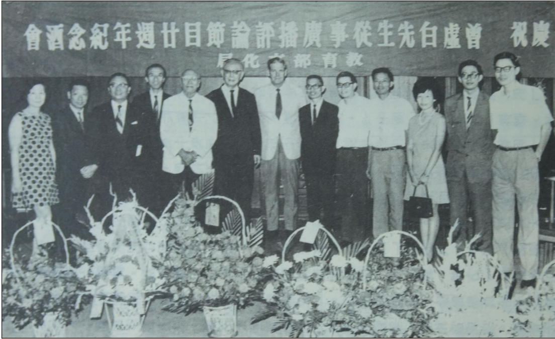
民國59年曾虛白先生(左起第六人)在中廣主持「談天下事」，一談二十年，教育部文化局特為舉行酒會。

、朱新民、張彼得、王家楫、倪源卿等都曾是國際宣傳處與新聞局的幹將（董顯光自傳，頁148-157；自傳，320-322；陳新萌，1984，頁234）。在國際宣傳與創設新聞局上，董顯光與曾先生闕功至偉，說董顯光是國際宣傳與新聞局的生父，那曾先生就是國際宣傳與新聞局的養父！