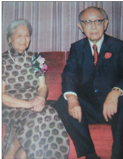
民國63年八十壽辰曾虛白夫婦合影。

曾先生的夫人名吳馥貞，上海商業鉅子之女公子，為上海中西女塾的高材生。曾先生與馥貞女士乃奉父母之命成婚，但在當時聖約翰和中西女塾被公認為「門當戶對」的結合，且曾先生早從馥貞女士的同學，也就是他的小姑母處