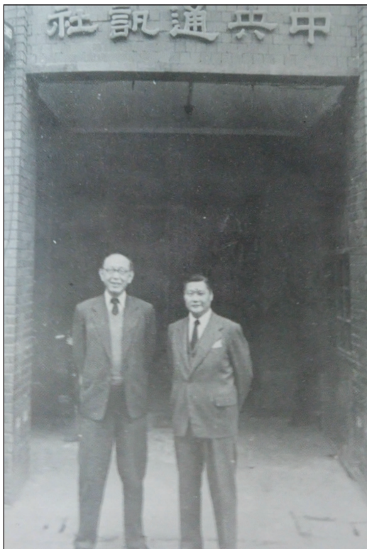
民國39年曾虛白先生(左)迎葉公超訪中央通訊社。

243-244)。一九七八年四月，美國大眾傳播學泰斗宣偉伯Wilbur Schramm教授來台，出席政大新聞所與香港中文大學傳播研究中心合辦之學術會議，曾先生、馬星野、王惕武、徐佳士等新聞前輩設宴款待，筆者亦應邀敬陪末座。入席時，兩人甫坐定，宣偉伯與曾先生就互相認出來了，原來宣偉伯是二十年前美方代表，親眼目睹了曾先生與塔斯社社長短兵相接的宣傳肉搏戰。對當時激辯的情況，宣偉伯還說他記憶猶新。