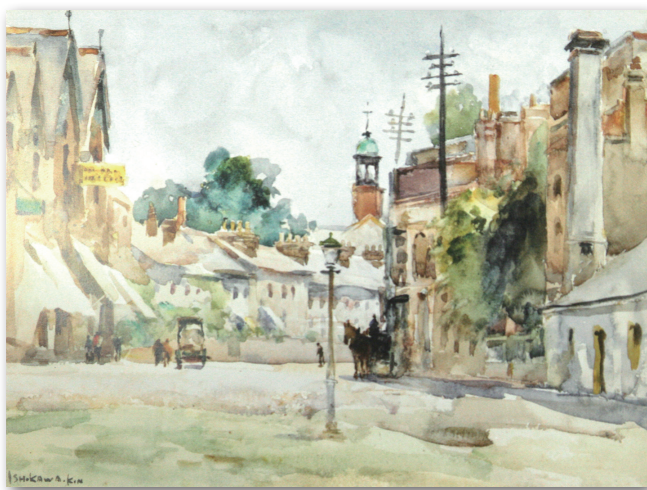
▲ 石川欽一郎1922年繪畫作品 倫敦街景

1932年欽一郎返回日本後，雖已年屆六旬，仍持續創作不懈，經常應邀以新作品參加日本國內重要的畫展。如前所述，1907年起，日本文部省開始舉辦「文部省美術展覽會」（簡稱「文展」）；迨至1919年，文部省成立帝國美術院，並制定全國性美術展覽會規則，於是，行之有年的「文展」改名為「帝國美術展覽會」（簡稱「帝展」）。1937年，文部省廢除帝國美術院，改而設立帝國藝術院，於是，「帝展」改由文部省主辦，而再更名為「文展」（又稱「新文展」）。1936年，欽一郎應邀以作品「河畔」（300円）參加文展招待展；1937年以降，其幾乎每年均獲邀提供作品參加「新文展」或文部省的特別展覽，第一～四回「新文展」其作品