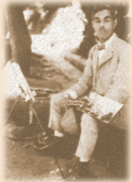
▲ 石川欽一郎獨照

石川欽一郎（1871～1945），終身致力於繪畫創作，尤其是水彩畫，積極參與美術團體的活動，是近代日本具代表性的畫家之一。其兩度前來臺灣任教，不僅盡心盡力從事學校美術教育，並利用課餘向社會大眾傳授西洋繪畫知識和技法，鼓勵學生籌組美術團體，展開近代臺灣美術運動。其結果，不僅啟發社會大眾認識臺灣之美，推廣近代西洋美學和文化風尚，並培育許多第一代臺灣人西洋畫家，對臺灣近代美術的發展，影響十分深遠，實可說是臺灣近代西洋美術教育啟蒙者、近代臺灣美術運動的導師。