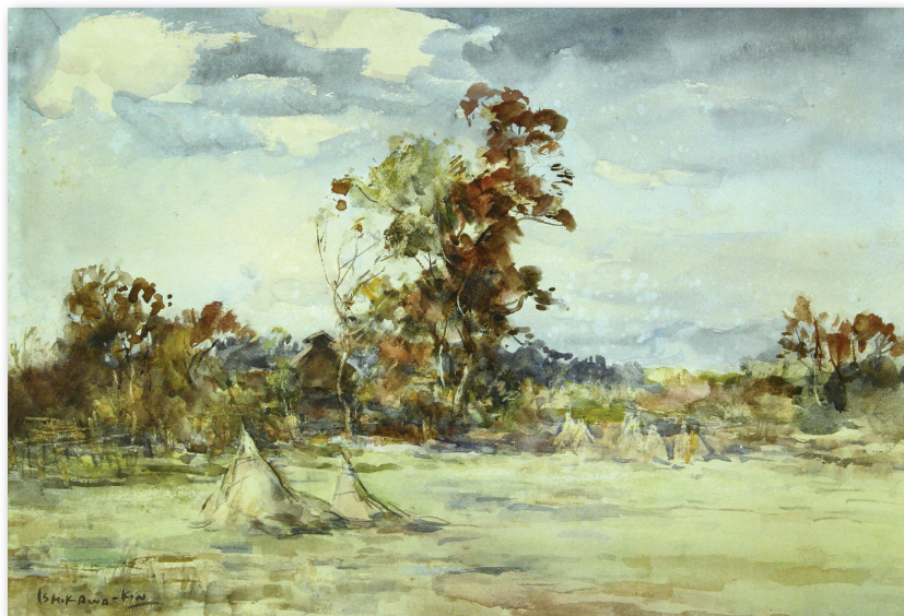
▲ 石川欽一郎繪畫作品 秋色