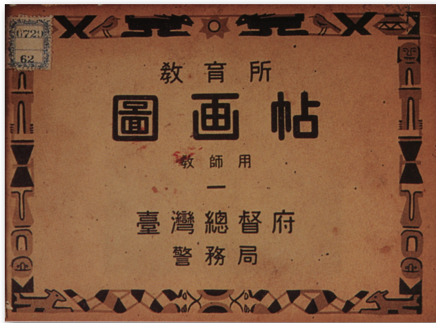
▲ 石川先生教學用教材-圖畫帖

1890年代後期，日本不少畫家紛紛前往歐洲，開啟赴歐遊學作畫之風氣，他們往往攜帶畫作前往歐美拍賣，作為漫遊的資金。受到此一風氣之影響，1899年欽一郎亦辭去印刷局工作，於1899-1900年前往歐洲遊學。1901年返回日本，一方面與石井柏亭及其他印刷局愛好美術的舊同僚等五人，組成西洋畫研究會小組織「紫瀾會」，並於1903年在東京美術學校校友會俱樂部舉行「紫瀾會同仁習作展覽會」，發表其向來的創作成果。另一方面，1901年適「明治美術會」解散，其中堅會員川村清雄倡組「巴會」、小山正太郎（1857-1916）等成立「太平洋畫會」，兩者分庭抗禮，欽一郎則參加「巴會」，並以畫作參展。此一時期，正逢日本水彩畫全盛時代的來臨，1901年大下藤次郎（1870-1911）出版《水彩画の栞》（水彩畫入門）一書，一年內即發行十五版；小林鍾吉、中村勝治郎、三宅克己（1874-1954）等西