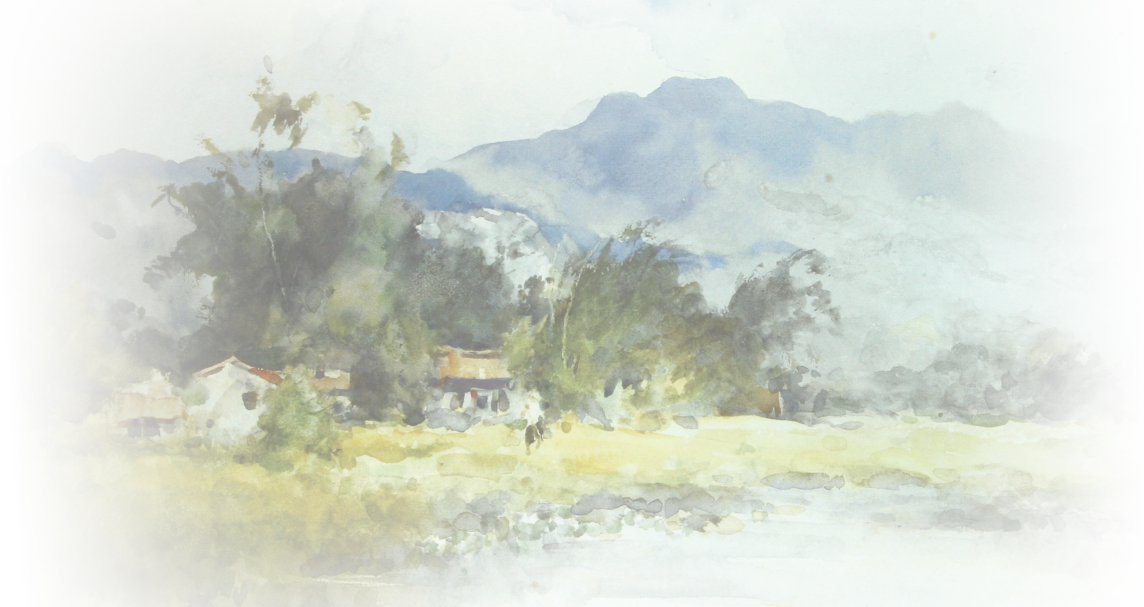
▲ 石川欽一郎1922年繪畫 池畔之家（圖：翻拍-《台灣近代美術誕生》播種者石川欽一郎 美術園丁倪蔣懷一書出處於台灣創價學會）

欽一郎經常在報章雜誌上發表文章和水彩畫作品，讚揚臺灣的優美風景，並介紹素描、水彩、油畫等西洋美術，例如1908年1、2月，其開始在《臺灣日日新報》發表其過去在滿洲戰地的水彩風景寫生作品，以及〈水彩畫と臺灣風光〉、〈寫生の趣味〉等文章，以充滿熱情的筆觸介紹近代美術創作水彩寫生與優美的臺灣風景。又如1926年以降，欽一郎陸續在該報發表其在臺灣各地寫生的水彩素