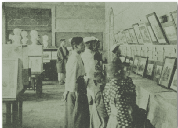
▲ 1909年師範學校水彩畫展會場