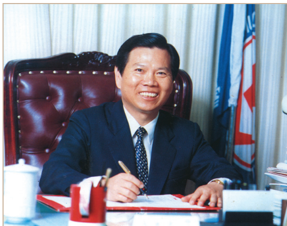
擔任台北市立師院校長時留影。