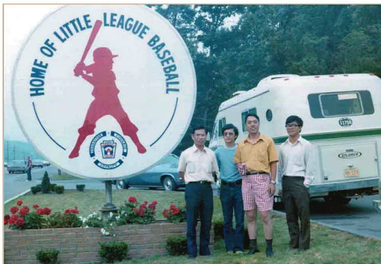
60年代，毛先生（左一）帶隊赴美參加盲人棒球賽。

先生的愛心來自於先天本性及後天師長的薰陶，一生都在實踐「愛的教育」，讓教育發光發亮。