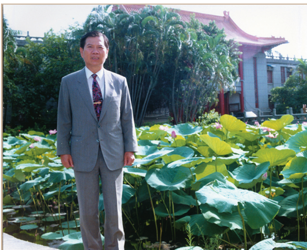
毛先生初任國立教育資料館館長，於館外荷花池畔留影。