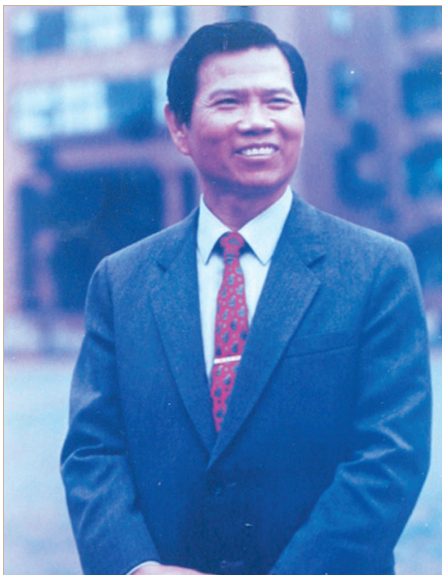
任台北市教育局長時獨照。

先生為研究及促進特殊教育，以及團結特教工作同仁，於1968年發起成立中華民國特殊教育學會，並於該年9月22日成立，對加強特殊教學方法之研究與改進、蒐集編印特殊教育資料、設計研究及製作有關特殊教育之教學器材、鼓勵並協助特殊教育人員之進修、推行特殊教育實驗工作、喚起社會對特殊教育之重視與聯絡國內外特殊教育機關團體及社會慈善團體等方面具有一定貢獻，尤其先生還兩度擔任理事長，一時傳為佳話。