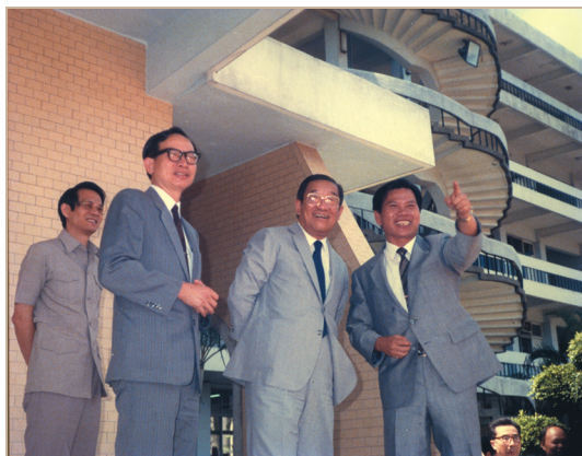
毛先生（右一）陪同教育部李煥部長（右二）巡視台北市立師院校園。