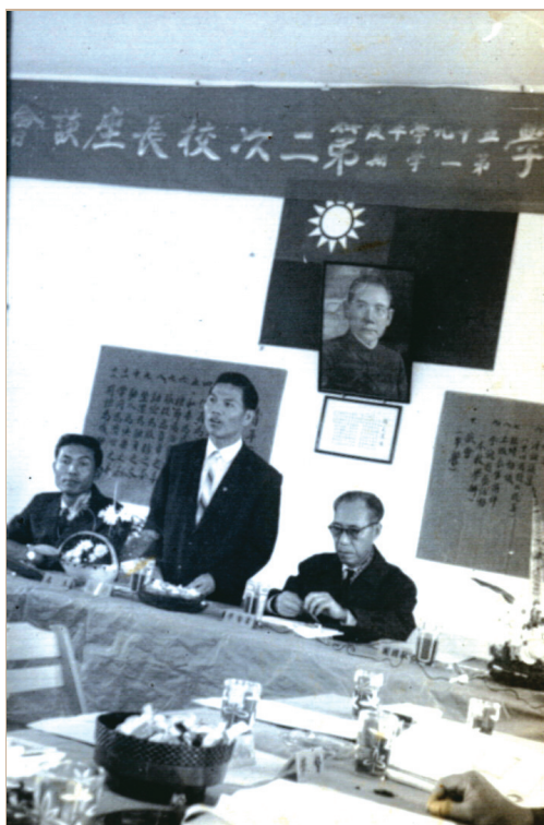
1970年毛先生擔任台東教育局長時留影。

在國教司任內，先生相當重視法令研訂，例如將過去的國民學校法，改進過去以機構為主體的立法原則，注入創思精神和現