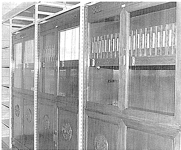
▲「蔣中正總統檔案」全部存放於雕花特製的紅木玻璃櫃中，櫃上並刻「永懷領袖」四字。