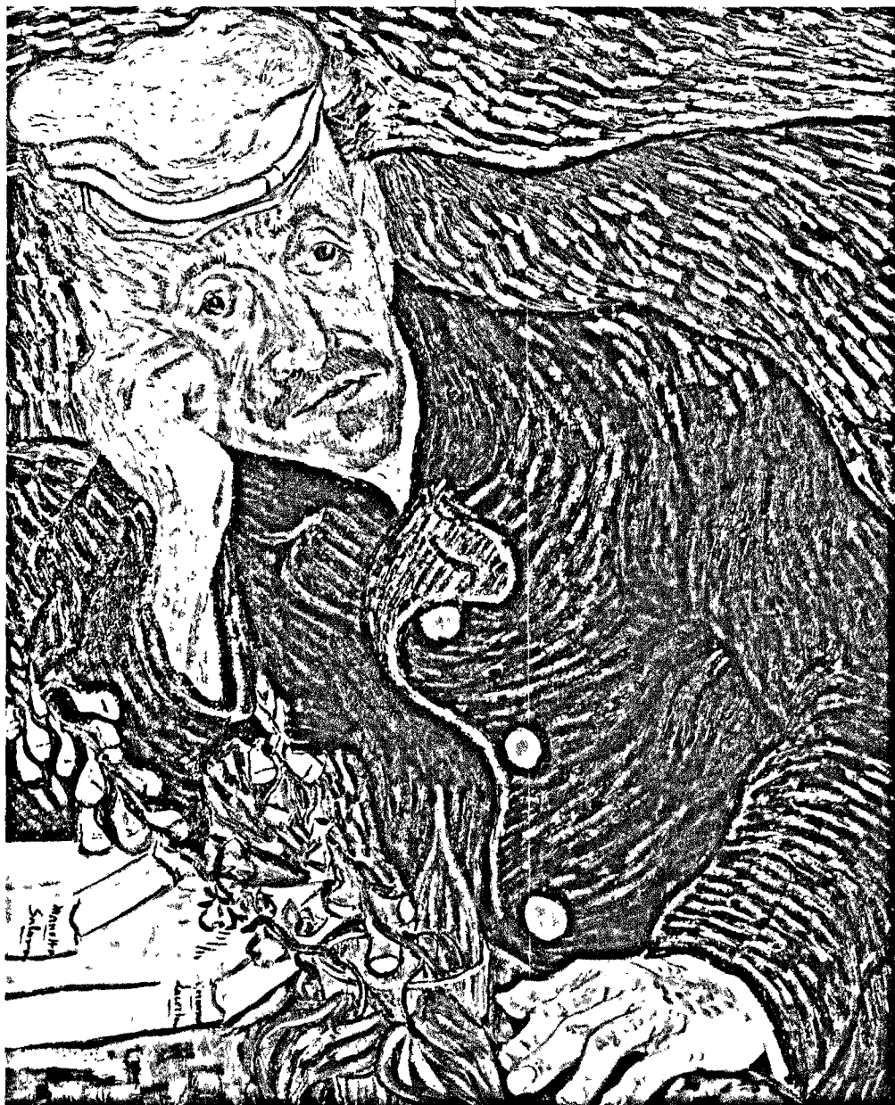
文生·梵谷(Gogh, Vincent van)所繪充滿愁容的「醫生」。

從心理學上講，個體心理嚴重失調是一種強烈的痛苦，它促使個人必須通過某種活動來擺脫。通過藝術來求得一種補償性的滿足，愛倫波曾經說過：「詩不是目的，而是一種激情」。創傷性的經驗造成個體與現實生活的差距或是不平衡，而孤獨的情境，更使得藝術家能夠體會自身的