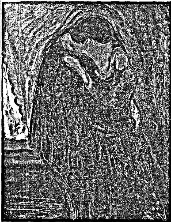
愛德華·孟克(Edvard Munch, 1863-1944)的創作「接吻」，用色彩、線條與形式呈現自己內在波動的情緒。

得自我可以與自我對話，孤獨是專注的探針，促使人們往自己的內心潛藏的深處探求，而非只是表面的意識或是情緒的感知，因此，過份關注外在現實與人情世故經營的藝術家，在瑣事的煩擾之下，是無法令人專注於在深層內心稍縱即逝的吉光片羽，更遑論做出深刻而感人的作品。許多藝術家終身未婚或者獨居，或是過著幾近與世隔絕的生活，譬如，作曲家貝多芬、布拉姆斯、柴可夫斯基，畫家梵谷、文學家但丁等等，都是在孤獨的煎熬之中產生不朽的巨作。另外，在全然的孤獨之中，卸下了為因應外在現實的扭曲狀態，真正純然的自我狀態方得顯現，而文學藝術創作正是要求自我風格的突顯，唯有在孤獨的情境之中，藝術家可以召喚並見到