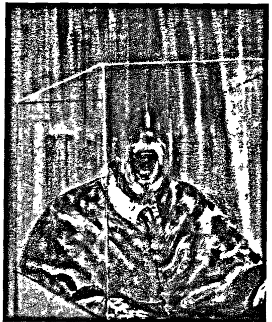
法蘭西·培根(Francis Bacon)的創作「Head VI」，以自身的扭曲之中表現孤絕的情境。

挪威畫家愛德華·孟克(Edvard Munch, 1863-1944)，其父親個性害羞，情緒敏感，有憂鬱傾向。孟克五歲時母親死於肺病，父親因此而鬱鬱寡歡，神經緊張，對宗教信仰產生瘋狂心態。孟克十四歲時，其姐瓊安也死於肺病。孟克自己也體弱多病，他自己回憶道：