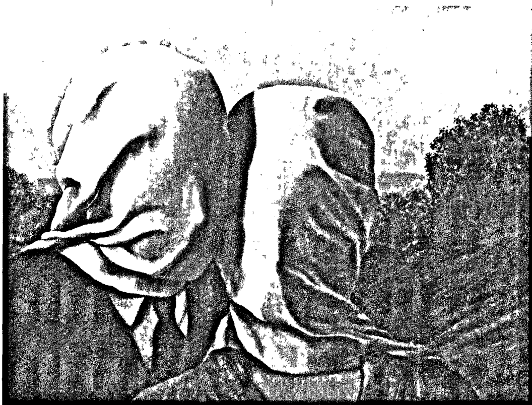
馬格麗特(Magret)的畫作常常出現蒙著白布的女人。